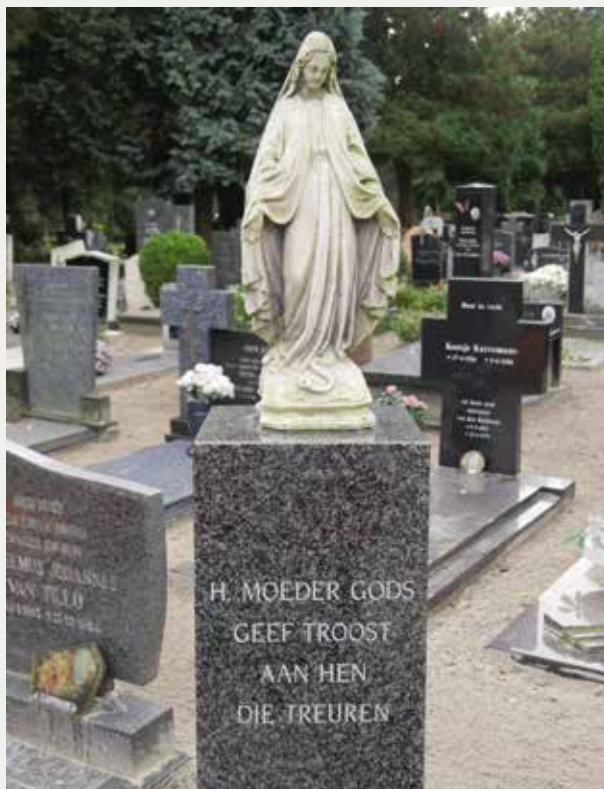
Parochiekerkhof in Lepelstraat (gemeente Bergen op Zoom).

De altijdgroene terebint of terpentijnboom met zijn enorme kruin komt voor rond de Middellandse Zee. Deze solitair markeerde vaak graven en was al in de Oudheid verbonden met de eeuwigheid.