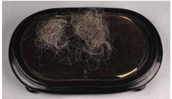
Haarlokken van Bilderdijk, afgeknipt na zijn overlijden. Collectie Werkgroep Bilderdijk, Leiden

de buste die kunstenaar Louis Royer in 1832 maakte en waarvan nadien kleinere versies werden vervaardigd.