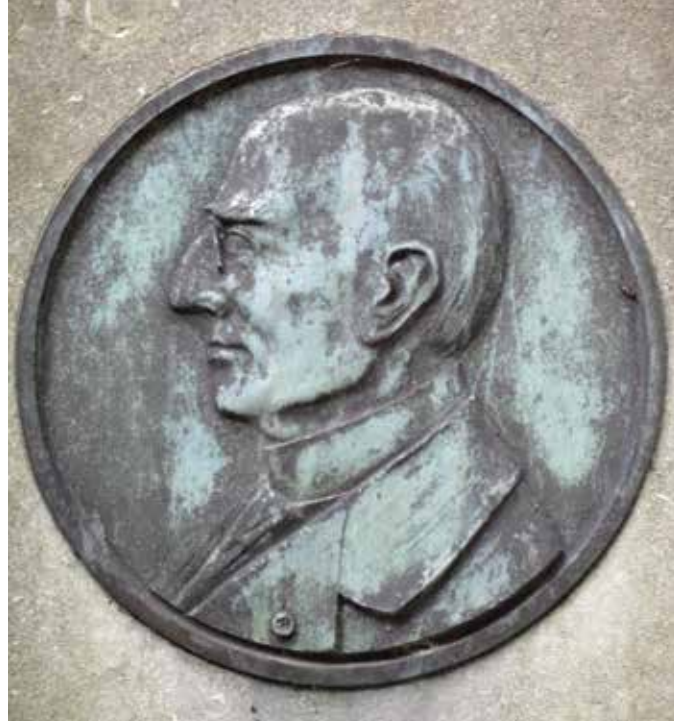
Een bronzen borstbeeld siert het grafmonument van wethouder Johannes de Breuk.

Ga bij het graf van Sevenhuijsen naar rechts en loop het pad af tot aan de rotonde. Aan het eerste pad naar links bevindt zich aan de rechterkant het graf van natuurkundige en Nobelprijswinnaar Hendrik Lorentz (1853-1928) (8). De bescheidenheid van het grafmonument, een simpele, liggende steen, staat in contrast met de reputatie van