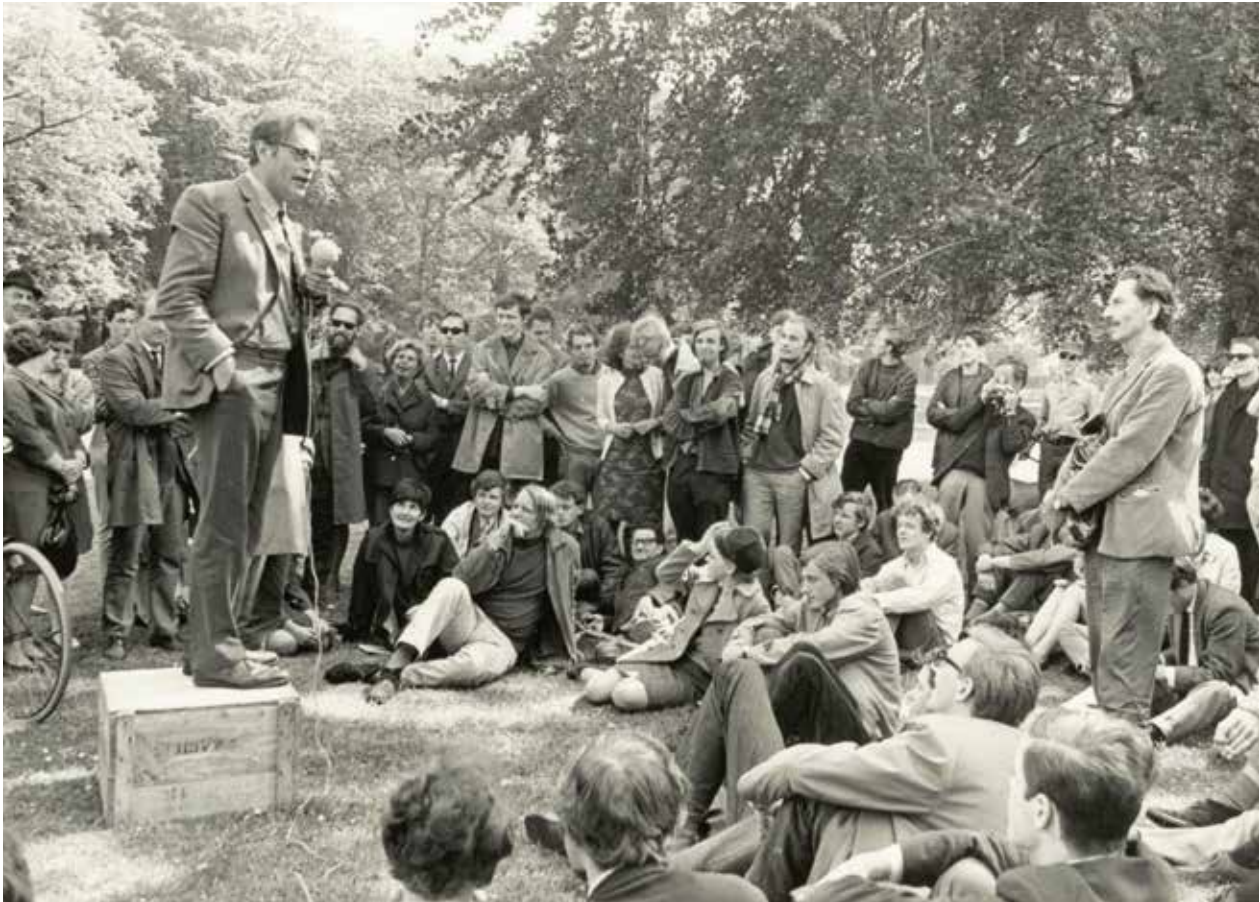
Godfried Bomans spreekt in 1967 op de zeepkist tot het publiek op het Vlooienveld in de Haarlemmerhout.

Godfried Bomans (1913-1971) was bij leven vooral bekend als auteur en televisie- en radiopersoonlijkheid. Ook vandaag nog kennen veel mensen hem van Eric of het klein insectenboek (1941), dat veelvuldig werd bewerkt voor film, televisie en toneel en tot strip. Kort voor zijn dood schreef Bomans een tekst waarin hij filosofeert over onze verhouding tot de ellende in de wereld. Die doet ons ook nadenken over het graf en de begrafenis van de auteur zelf.