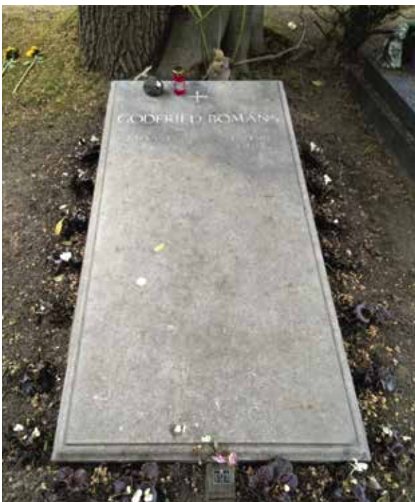
Het graf van Godfried Bomans op het Adelbertuskerkhof in Bloemendaal (grafnummer E123).

De grafsteen op het graf van Bomans en het televisiescherm communiceren zo beschouwd dezelfde boodschap van onmachtige nabijheid. In de visie van Bomans zijn het de media die de werkelijkheid van menselijk lijden of de dood dichtbij brengen, maar ook – en vooral – een nooit te overbruggen kloof markeren.