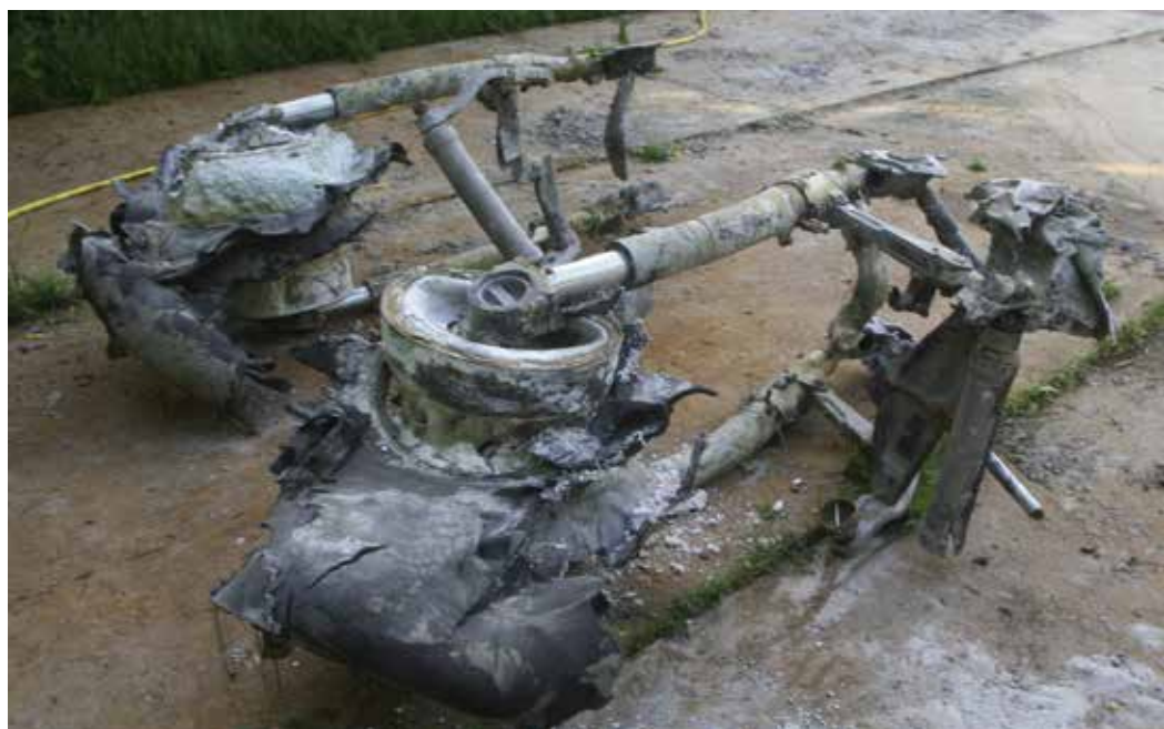
De twee landingsgestellen van het toestel op de locatie Nieuwe Niedorp, een Vickers Wellington T2990 (van het 311 Czech Squadron Bomber Command).

Er zijn ook particulieren die zich het lot aantrekken van de vermisten. Aalberts: 'Particulieren mo-