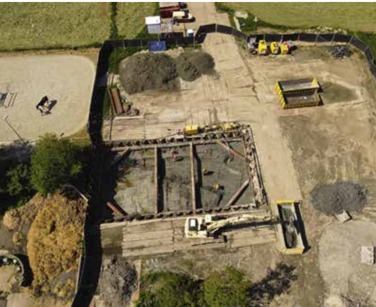
De bergingslocatie Nieuwe Niedorp.

Meer weten over dit onderwerp? Bekijk dan de documentaire 'Liever dood dan vermist' van Gisèle Mallant op figuliproductions.nl . Meer over het Nationaal Monument 'Missing Airmen' is te vinden op nationaalmonumentmissingairmen.nl .