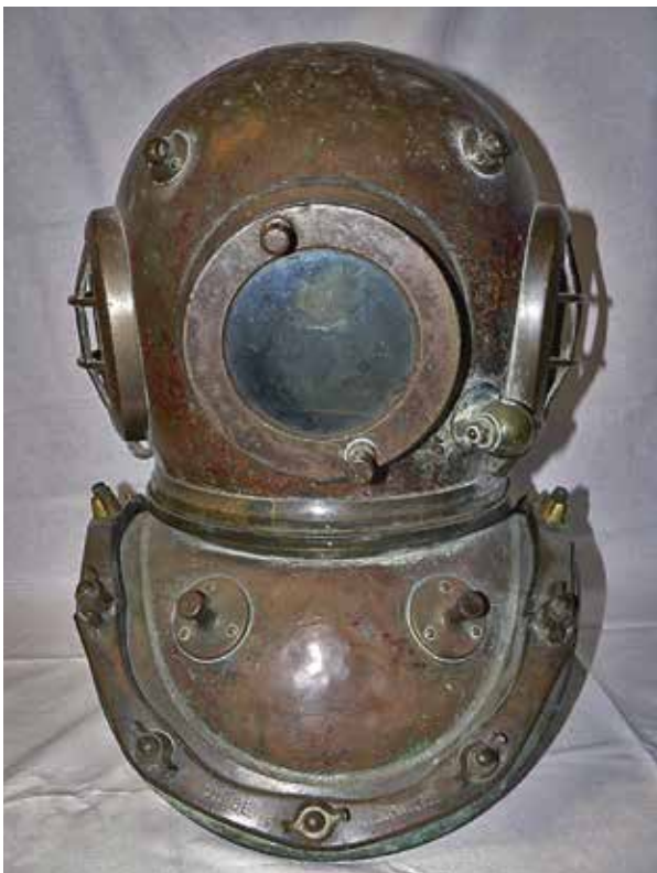
Het type koperen duikershelm dat Sparling gebruikte bij zijn bergingswerk.

kerke. Dat lukte maar ze kwamen helaas te laat voor het dochtertje van een van de vrouwen, dat intussen door de kou was bezweken. Deze Leendert Sparling bleek in een huurgraf in Rockanje te liggen. Overigens was dit de eerste ramp waar het Oranjehuis zich actief presenteerde: Prins Hendrik kwam persoonlijk meehelpen. De ramp was internationaal nieuws, ook omdat de passagiers uiteenlopende nationaliteiten hadden.