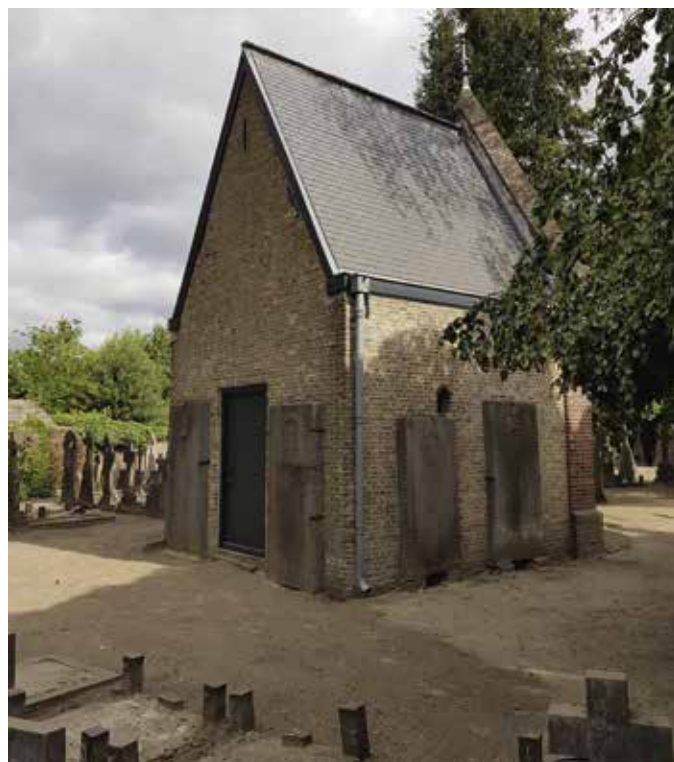
De kapel annex baarhuisje is een rijksmonument. Er staan zeventiende-eeuwse zerken tegenaan, afkomstig uit de oude kerk die hier stond.