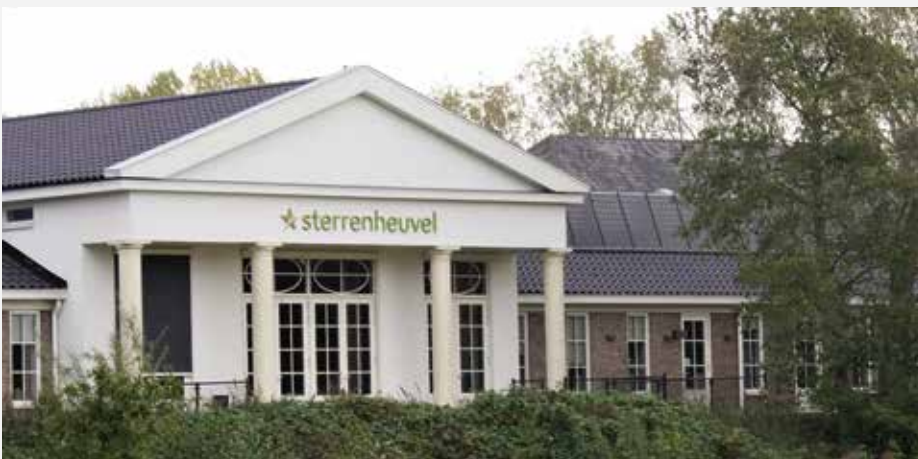
De Après la Vie Academie verzorgt de opleiding voor uitvaartbegeleiders onder andere op Sterrenheuvel.

Verontwaardigd is hij als hij bij gastlessen in het onderwijs merkt dat scholen zo weinig aandacht besteden aan de dood: 'Ik word altijd ingeschakeld op het moment dat er iets ernstigs gebeurd is. Waarom wordt er in een vak als Maatschappijleer niet structureel aandacht besteed aan zaken als erfrecht en levenstestamenten?'