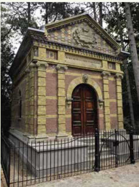
De fraai gerestaureerde grafkelder van de familie Van Vollenhoven (1874) op de Algemene Begraafplaats in Heemstede.

Op zaterdag 22 april is Terebinth te gast op de Algemene Begraafplaats te Heemstede. Daar krijgen de deelnemers aan deze themadag onder andere de unieke gelegenheid om de grafkelder van de familie Van Vollenhoven te bezichtigen. Zie voor het programma het maartnummer van dit blad, en de facebookpagina of de website van Terebinth.