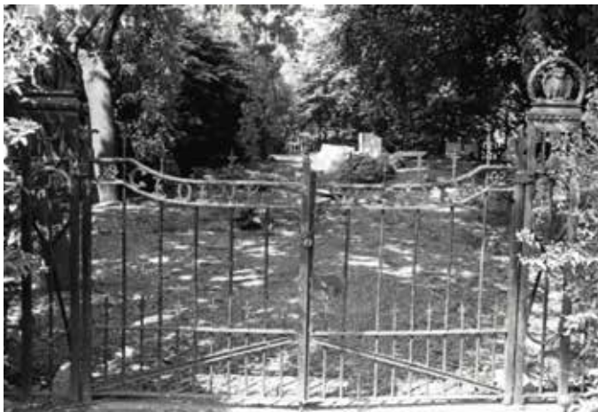
Achter het toegangshek is de verwaarloosde staat van de begraafplaats te zien.

kocht was haar toebedeeld na het overlijden van haar man in 1892. Bij de verkoop stelde zij als voorwaarde dat zij er een familiegraf kreeg, waarschijnlijk ingegeven door het feit dat ze zestien kinderen baarde, van wie er voor 1892 reeds acht waren overleden. Daarnaast had zij voor zichzelf eeuwigdurend grafrecht bedongen. Zij overleed in 1920. Helaas ontbreekt de originele grafsteen van de weduwe, wel is nu precies bekend waar zij ligt begraven. Haar graf is bijzonder, omdat het keer op keer heeft weten te voorkomen dat de begraafplaats geruimd werd. Sinds 1954 zijn bij herhaling plannen ingebracht om de begraafplaats te ontruimen en het stuk grond te bebouwen. Alle plannen zijn stevast van tafel geveegd: het eeuwigdurend grafrecht van de weduwe waarborgt het voortbestaan van deze begraafplaats.