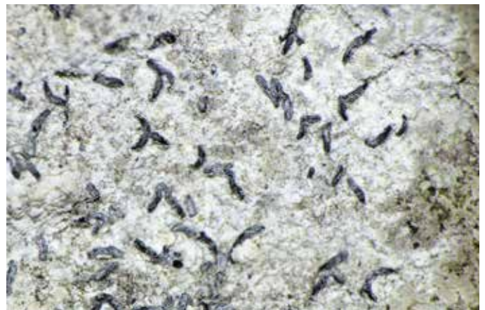
Witberijpt muurschriftmos komt alleen voor op de droge 'onderkant' van schuinstaande, beschaduwde kalkstenen grafmonumenten.

Elk korstmos dat in Nederland voorkomt heeft een eigen naam, zowel een Latijnse naam (de wetenschappelijke naam) als (meestal ook) een Nederlandse naam. Mos-