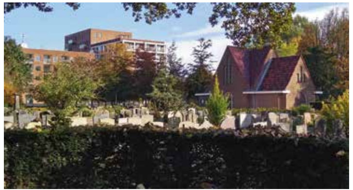
Overzicht van begraafplaats Rustoord in Diemen, met de fraai opgeknapte aula en uitzicht op de nieuwe wijk aan de overkant van het water. Foto voorzijde: Onbetwist topstuk van de Noorderbegraafplaats in Assen is het Brumsteede-monument, volop voorzien van funeraire symboliek.

Tot slot: we zoeken met ingang van het septembernummer een nieuwe eindredacteur . Helpt u mee? De advertentie staat op pagina 26 en komt ook op onze website en facebookpagina. Zegt het voort.