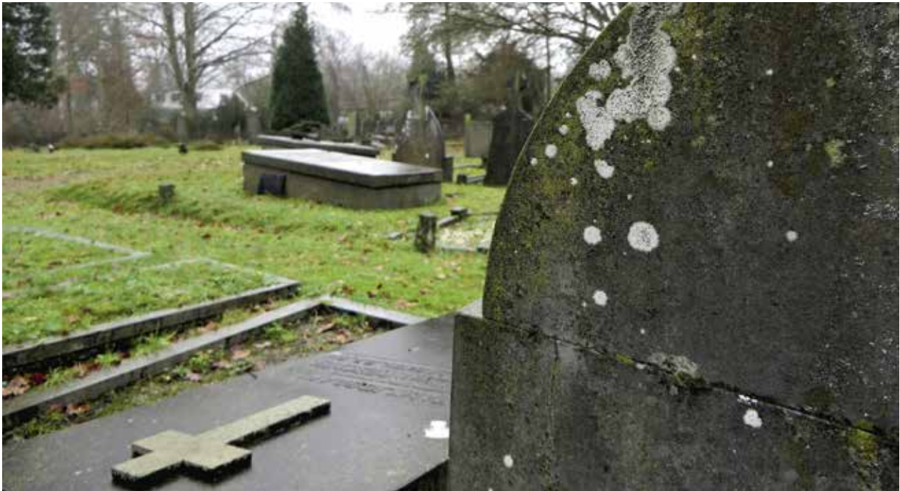
Op de steen vooraan groeien witte, gele en bruine korstmossen.

Midden in de stad Lochem ligt langs de Zutphenseweg de Oude Begraafplaats. Het toegangshek is wat verscholen achter een dichte heg. Bezoekers die de begraafplaats oplopen treffen een bijzondere plek aan met een rijke historie en bijzondere natuur. Door de ruime en gevarieerde opzet van de begraafplaats en de ouderdom ervan, is het een paradijs voor korstmossen en andere planten en dieren.