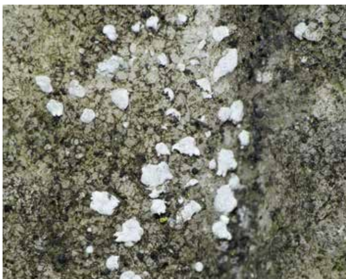
Geschubd dambordje. Dit korstmos bestaat uit kleine grijze schubjes die maximaal één millimeter groot worden en is in Nederland bedreigd.