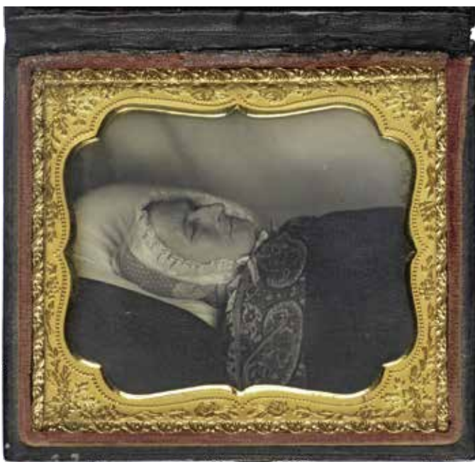
Post-mortemportret van een onbekende oude vrouw. Daguerreotypie, objectnummer RP-F-F14377, Rijksmuseum Amsterdam

Menig nabestaande bezit een sieraad met een haarlok van de overledene