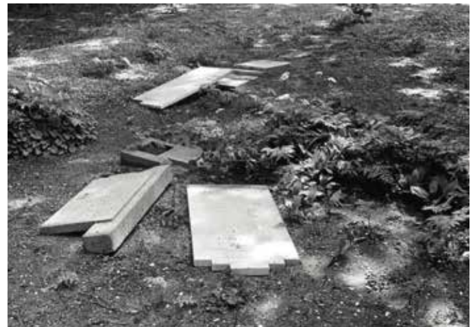
Schade aan de begraafplaats, gefotografeerd in 1973.

Zie ook: 'Schiebroek: een gesloten boek'. In: Rita N. Hulsmann en Jannes H. Mulder, Begraven in Rotterdam en omstreken . Rotterdam, De Terebinth, 1999.