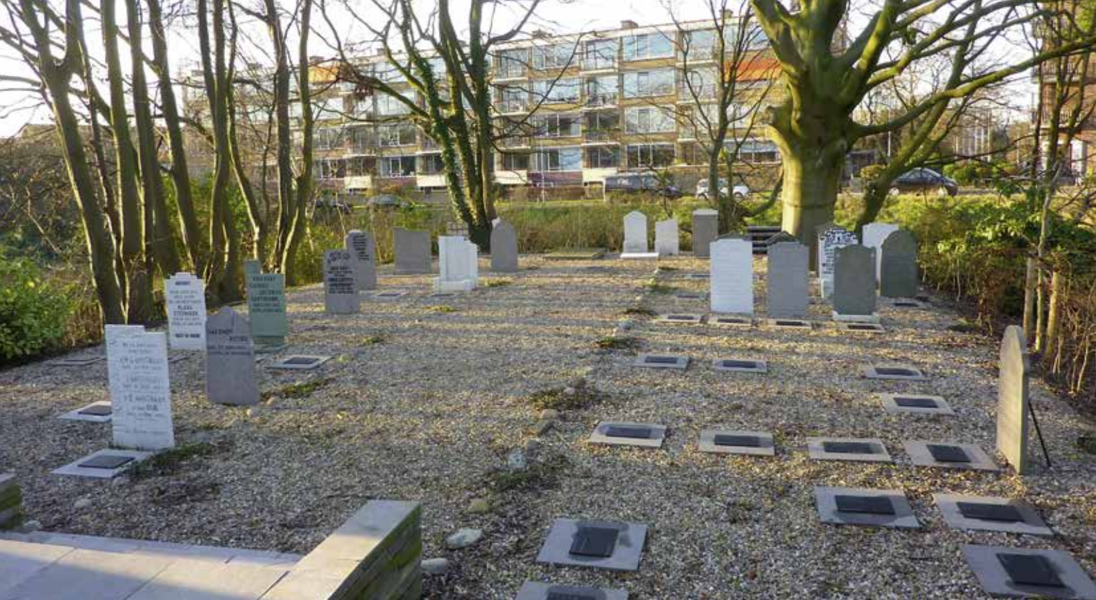
Overzicht van de gerenoveerde begraafplaats.