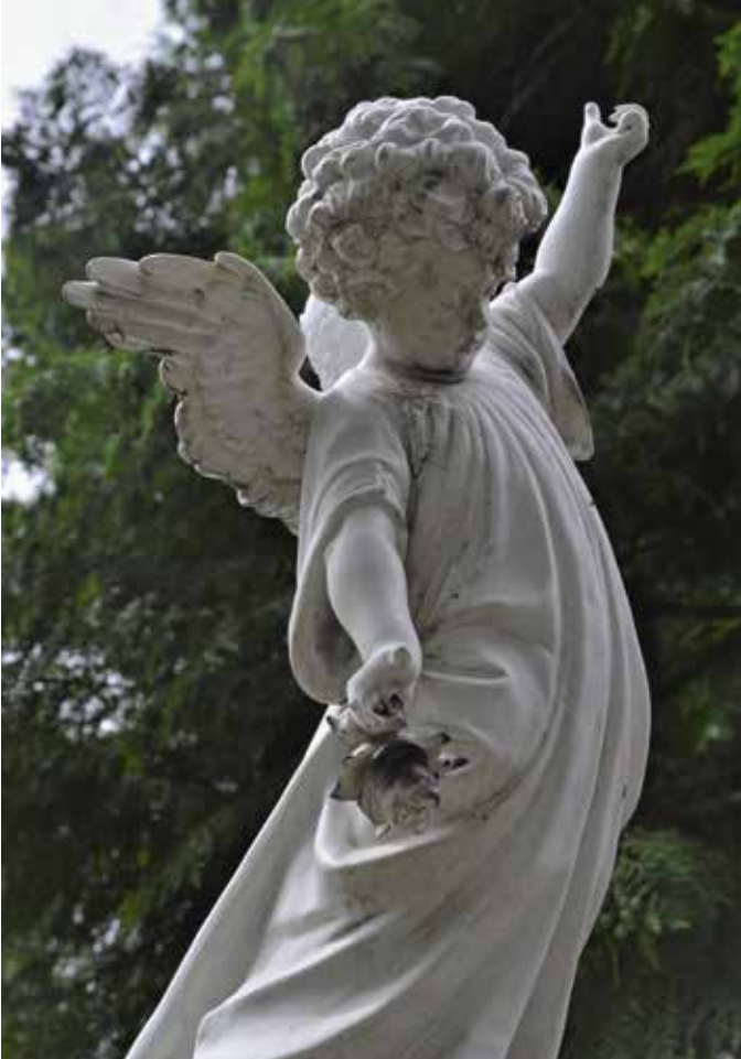
Detail van een grafmonument op Rustoord.

het levensverhaal en van wie niet en – niet onbelangrijk – welke vorm gaven we aan onze verhalen? Een papieren boekje leek ons een goed idee.