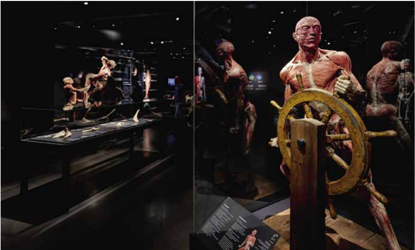
Voorbeeld van een opstelling in The happiness project in Amsterdam.

tentoonstellingen van de geestelijk vader van de plastinatietechniek, de Duitse anatoom Gunther von Hagens. Daar dienen ze vooral een educatief en esthetisch doel.