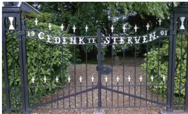
De aanblik van de begraafplaats nu. Het toegangshek uit 1903 is gerestaureerd op initiatief van de Vereniging Stedebouwkundig Wijkbehoud.