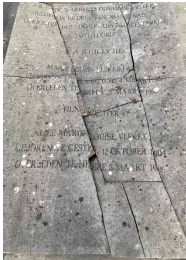
De deksteen op het graf van Petrus Vlekke was in dertien stukken gebroken. Foto links: Restaurateurs van Atelier Lamier zijn aan het werk met de nieuwe deksteen.