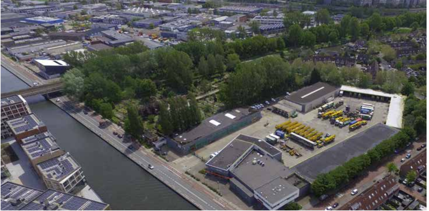
Luchtfoto, de groene begraafplaats Rustoord omringd door spoorlijn, Weespertrekvaart, woonkern en bedrijf Saan.