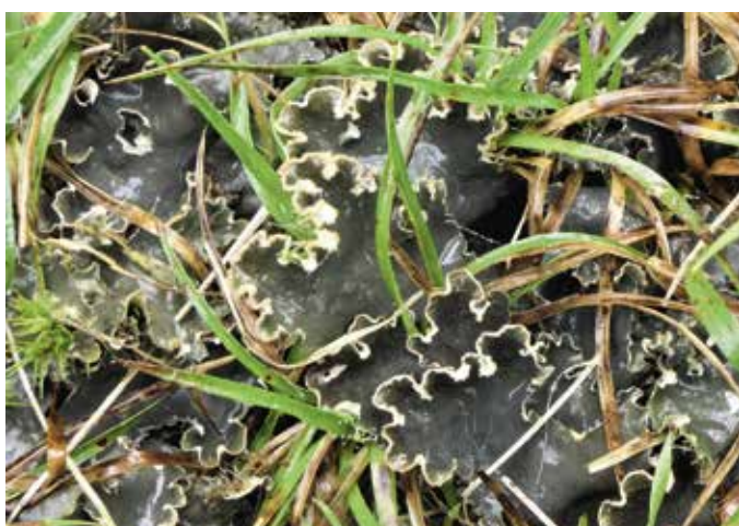
Het kaal leermos.

vreter, Vliegenstrontjesmos, Doolhofschijfje en Hamsterootje zijn zomaar een paar voorbeelden van soorten met een aansprekende naam die op de begraafplaats in Lochem voorkomen. Ondanks hun fascinerende namen zijn de meeste korstmossen erg klein. Alleen de grootste soorten zijn met het blote oog goed waar te nemen. De meeste soorten laten zich pas goed zien met een loep die tien maal vergroot. Voor wie de moeite neemt om een steen letterlijk onder de loep te nemen gaat er een fascinerende wereld open. De kleinste korstmossen hebben namelijk de meest fantastische vormen en kleuren, en veel soorten zijn felgeel gekleurd of vormen schitterende patronen. Die felle kleuren krijgen ze doordat ze allerlei chemische stoffen aanmaken als afweer tegen beestjes. Omdat ze zo langzaam groeien, kunnen ze het zich niet veroorloven om meteen opgegeten te worden. In totaal komen er op deze begraafplaats in Lochem meer dan honderd soorten korstmossen voor, waarvan er tien landelijk zeldzaam of zeer zeldzaam zijn. Twee soorten staan zelfs op de Rode Lijst korstmossen en zijn dus landelijk bedreigd: Geschubd dambordje en Zwarte grafkorst. Laatstgenoemde soort komt in Nederland vrijwel alleen voor op oude kalkstenen graven.