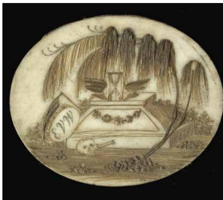
In een ovaal medaillon zijn met mensenhaar een grafzerk met treurwilg, zeis en een gevleugelde zandloper afgebeeld op een benen plaatje. Daarbij de initialen EVW. Foto Museum Rotterdam, objectnummer 20343

Inderdaad heeft de glazen urn net zoveel weg van een dildo als de gestileerde kerstboom van Paul McCarthy's Rotterdamse Santa Claus-sculptuur van een anale plug. Duidelijk is dat de urn uitdrukking geeft aan zowel geestelijke als lichamelijke verbondenheid en dus niet alleen uitnodigt tot een stil mijmeren bij kaarslicht. Terwijl de urn opgevat kan worden als spoor van het verlangen naar