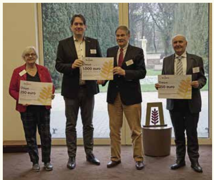
De drie genomineerden van 2020 waren (v.l.n.r.) de Nederlandse Stichting tot Behoud van de Graftroumsel te Veenhuizen, de Stichting Sovjet Ereveld te Leusden (winnaar) en de Stichting Het Oude Kerkhof te Roermond.

draagt onvermoeibaar bij aan de kwaliteit van de begraafplaats als wandelpark door oude grafmonumenten op te (laten) knappen.