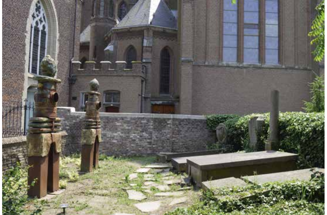
Een gedeelte van het kerkhof met priestergraven.

goed ingepast in de omgeving. Rust voor mens, plant en dier, via een opknabbeurt van het groen en de aanleg van een looproute met bankjes. Ons plan gaat bovendien de aantrekkingskracht van de Heemtuin en de Beeldentuin