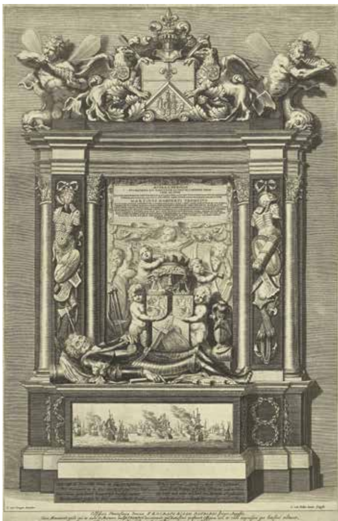
Graftombe van admiraal Maarten Tromp in de Oude Kerk te Delft. Prent Cornelis van Dalen (II), ca. 1656-1664.