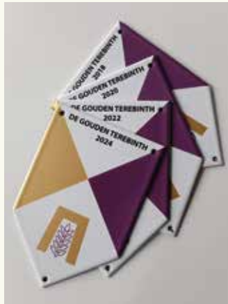
Voorbeeld van de schildjes die de winnaar van de Gouden Terebinth kan bevestigen bij de ingang van zijn of haar begraafplaats.