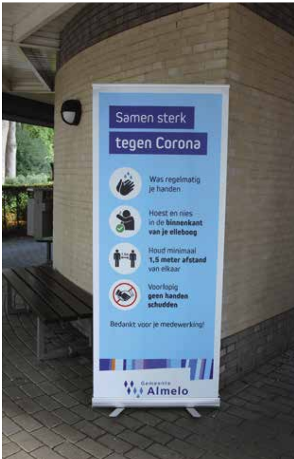
Corona-instructie op de Gemeentelijke begraafplaats te Almelo.

In januari 2020 werden we geconfronteerd met een nieuwe epidemie. We zagen onheilspellende beelden van markten met levende dieren uit het Chinese Wuhan en kort daarop van opgestapelde doodkisten in het Italiaanse Bergamo. Via wintersport en carnaval dook corona al in februari op in Brabant. Deze pandemie bezorgde verpleeghuizen, ziekenhuizen en de uitvaartwereld gedurende al die tijd overwerk. Overheidsmaatregelen troffen de economie en de samenleving hard. Reeds boze burgers radicaliseerden tot coronaontkenners en complotdenkers. Zij richtten hun pijlen op politici, medici en andere wetenschappers die de Nederlandse samenleving met nepnieuws over corona in een wurggreep zouden nemen.