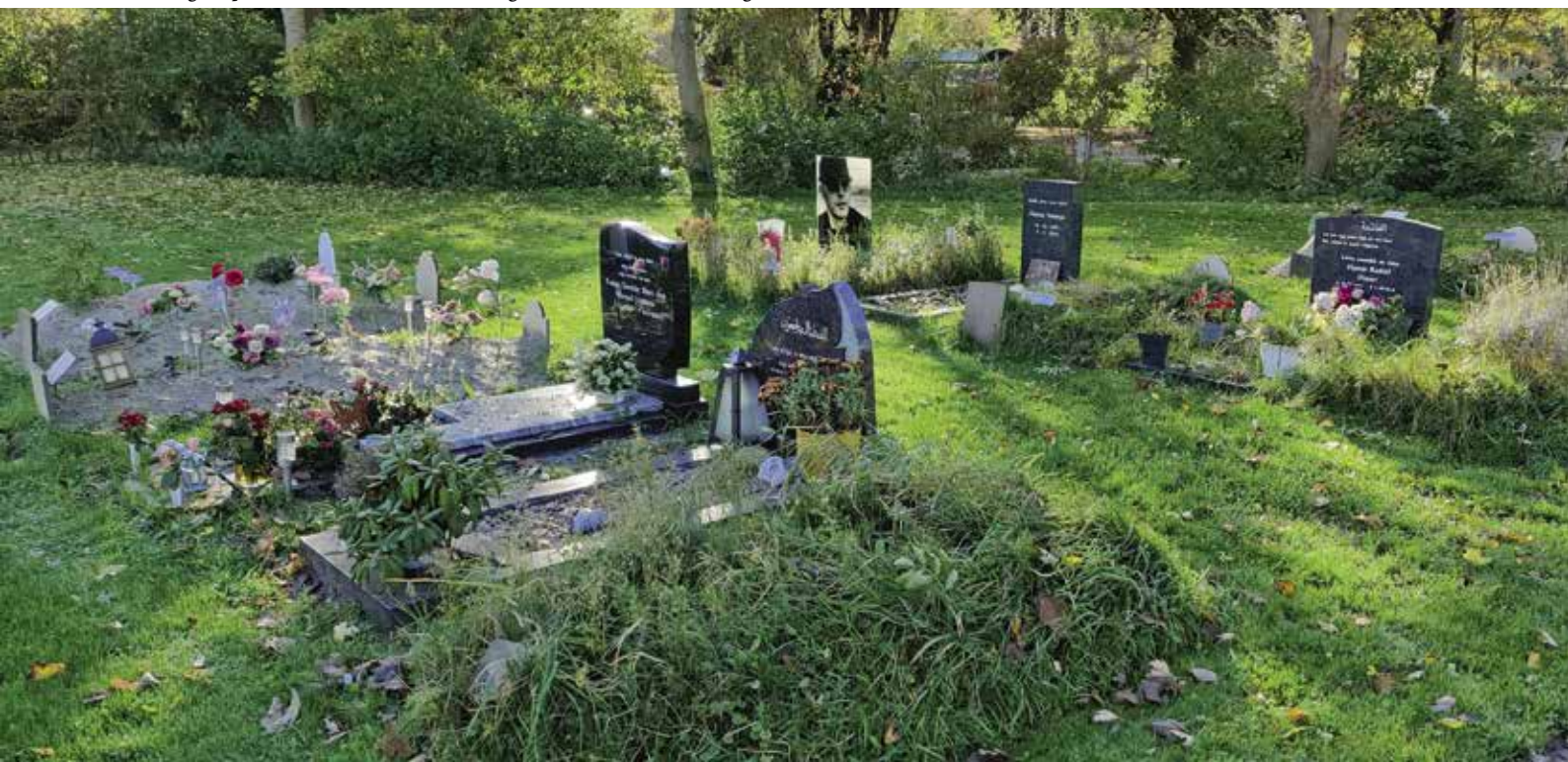
Noorderbegraafplaats Leeuwarden. Islamitisch grafveld met verschillende grafvormen.

Ten tweede het creëren van specifieke voorzieningen voor migranten- en minderhedengroepen op regionaal niveau . We gaan ervan uit dat (gemeentelijke) begraafplaatsen onder de huidige kostendruk de voor de hand liggende minderheden al relatief goed in het vizier hebben. Dat ze bijvoorbeeld aparte velden aanleggen voor moslims of voor groeiende nieuwe migrantengroepen zoals de Armeense christenen in Maastricht. Gelet op de relatief kleine omvang van minderheden en migrantengroepen op lokaal niveau ligt het voor de hand om voorzieningen op regionaal, eventueel provinciaal niveau te clusteren, zoals streven naar één Chinese begraafplaats per provincie. Voorbeelden als de Chinese begraafplaats bij Kranenburg