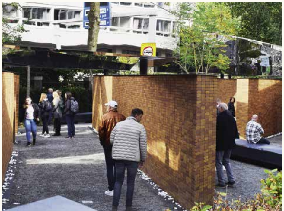
Bezoekers van het Namenmonument zoeken naar namen en laten steentjes achter.