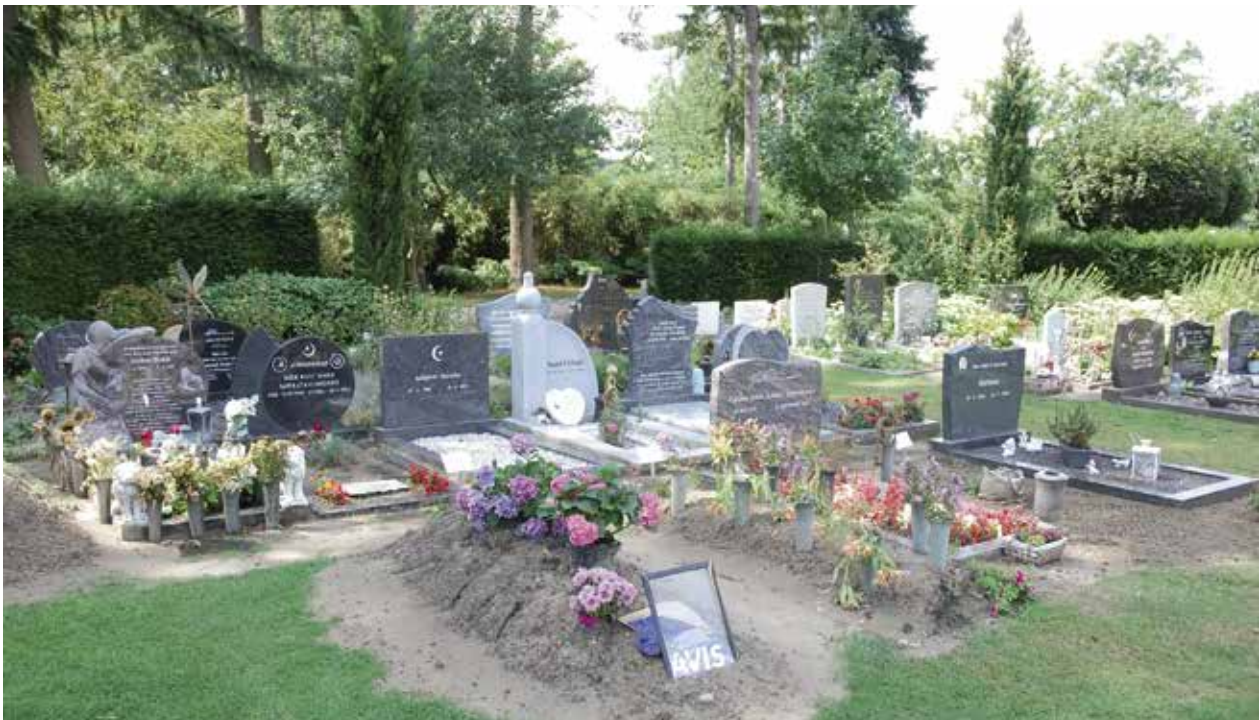
De Islamitische begraafplaats in Almere.

Elke overledene moet verder in een afzonderlijk graf worden begraven. Het lichaam wordt in beginsel ongekist op de rechterzijde in het graf gelegd met het gezicht richting Mekka, dus met het hoofd naar het zuiden. In Nederland moeten de graven daarom noordoost-zuidwest georiënteerd zijn. Daarna wordt het lichaam afgedekt. Door deze wijze van begraven is een moslimgraf ruimer. Bovenal willen moslims een eeuwig graf, zodat zij ongestoord de Dag