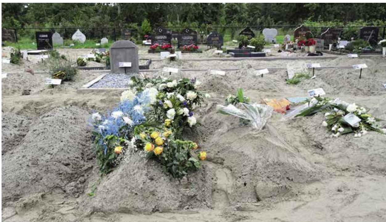
Gemeentelijke begraafplaats Almelo, islamitisch gedeelte.

De groeiende behoefte aan grafruimte voor moslims in Nederland is vermoedelijk blijvend. De tweede en derde generatie is ingeburgerd en wil na het overlijden in de geboorteplaats worden begraven. Tijdens corona is ook duidelijk geworden dat zij het graf zo gemakkelijker bezoeken. De grafteksten zullen vaker gedeeltelijk of geheel in het Nederlands zijn gesteld. Eeuwige grafurust blijft echter een heikel punt.