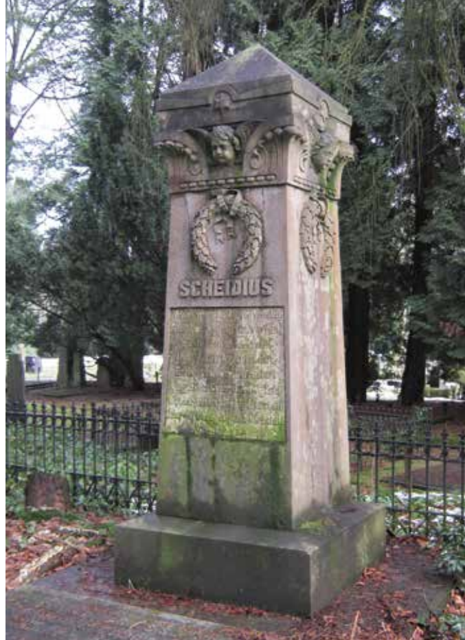
Na een grondige restauratie is de laatste rustplaats van de familie Scheidius in alle glorie hersteld. Goed te zien is de versiering op de cippus (de afgeknotte piramide).