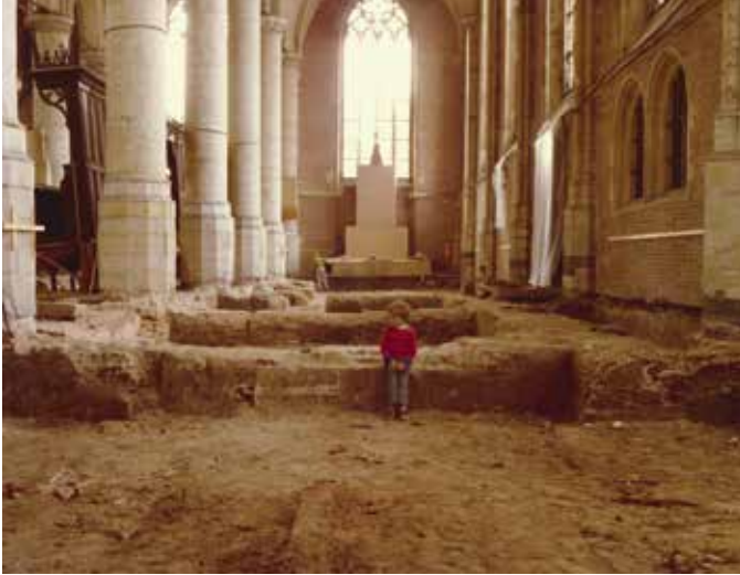
Na de sloop van de keldergraven is een stevig zandbed neergelegd.

van 1978-1982 geen stoffelijke resten uit de kerk verhuisd naar de Groenesteeg. Iedereen die ooit in de kerk is begraven, is daar nog steeds, al zijn de stoffelijke resten wel grandioos door elkaar gehusseld.