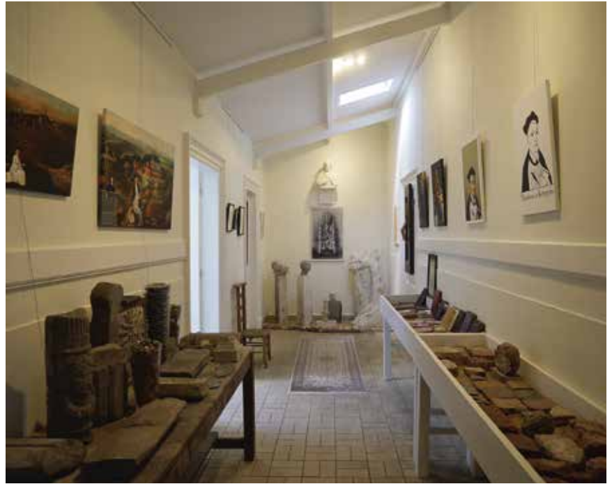
Overzicht van de opstelling in de gang van het museum, met bodemvondsten, schilderijen en uitgaven van de Navolging .

Thomas vertegenwoordigt de tweede generatie Moderne Devoten, een vernieuwende hervormingsbeweging die rond Geert Grote uit Deventer is ontstaan. Grote verzette zich tegen misstanden binnen de katholieke kerk en riep