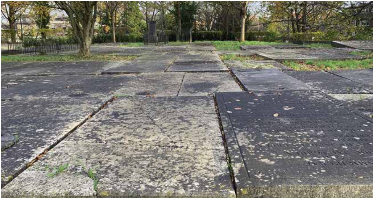
Keldergraven op begraafplaats Groenesteeg.

‘ H is wel een gruwelijk onderwerp’, zei mijn tante tegen mij nadat ze Het mysterie van de graven in de Pieterskerk uit de brievenbus had gehaald. Natuurlijk was zij trots op haar neef en zijn succesvolle onderzoek naar de vraag waar de stoffelijke resten in de Pieterskerk in Leiden waren gebleven. Maar toch. ‘Ik weet niet zeker of ik dat wel helemaal ga lezen. Al die botjes en knekeltjes.’