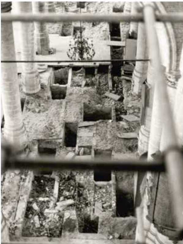
Het koor van de Pieterskerk van bovenaf. De keldergraven bestonden uit gepleisterde halfsteens muurtjes.

‘ H is wel een gruwelijk onderwerp’, zei mijn tante tegen mij nadat ze Het mysterie van de graven in de Pieterskerk uit de brievenbus had gehaald. Natuurlijk was zij trots op haar neef en zijn succesvolle onderzoek naar de vraag waar de stoffelijke resten in de Pieterskerk in Leiden waren gebleven. Maar toch. ‘Ik weet niet zeker of ik dat wel helemaal ga lezen. Al die botjes en knekeltjes.’