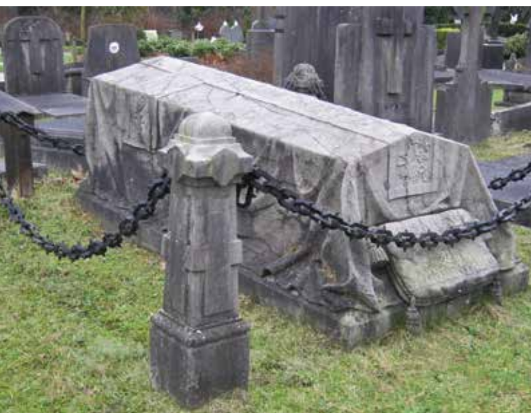
Baarkleed, kruisvormige loper en knielkussen op het graf van meesterslager Schmeink en zijn vrouw, zijn gedetailleerd uitgebeeld.

Wandel ook eens een stukje aan de overkant van de geasfalteerde Weg langs de Begraafplaatsen om de grote diversiteit aan planten te zien. In dit gedeelte, De Vlinder (21), mocht de natuur jarenlang doorwoekeren, maar de oorspronkelijke opzet is grotendeels prachtig hersteld.