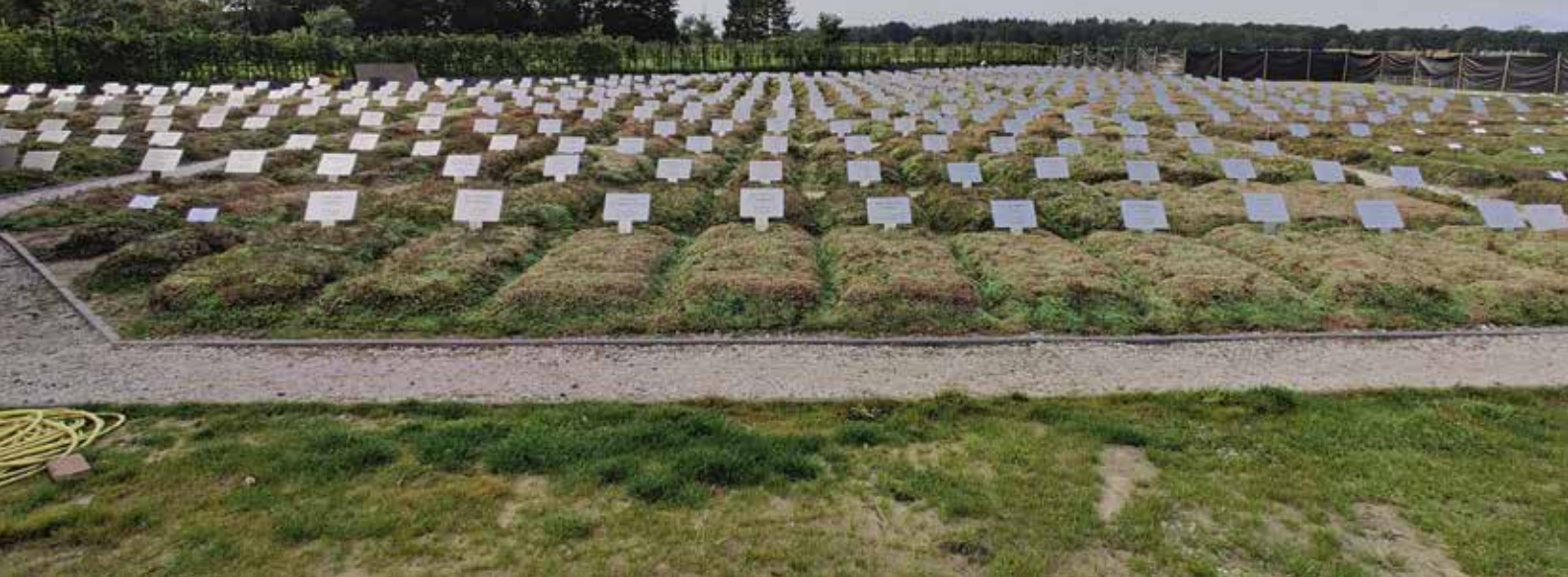
Islamitische begraafplaats Riyad Al Jannah, Zuidlaren.

Het is zover. Dit is het laatste, afsluitende artikel over het onderzoek binnen het Europese Hera-project. Ter herinnering: Sinds juli 2019 hebben wetenschappers in zes Noordwest-Europese landen (Verenigd Koninkrijk, Ierland, Zweden, Noorwegen, Luxemburg en Nederland) onderzoek gedaan naar integratie en uitsluiting van minderheden op begraafplaatsen en crematorium-terreinen.