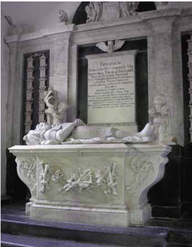
Het grafmonument van Hieronymus van Tuyl van Serooskerke in de Hervormde Kerk te Stavenisse.

Beeldhouwkunst was of in de kerk of bij de adel te zien