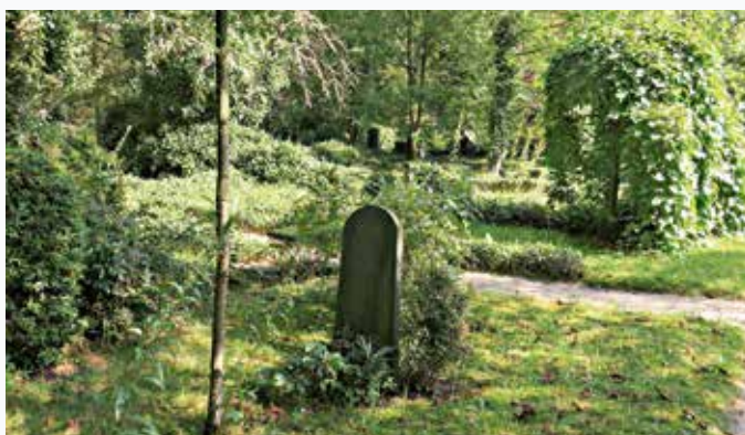
Begraafplaats Huis te Vraag.

Ooit lag het terrein in Sloten en maakte deel uit van het landgoed van Huis te Vraag. Nadat dit in verval was geraakt, kocht aannemer Pieter Oosterhuis de grond en stichtte er in 1891 de Protestantsche begraafplaats Te Vraag. In 1921 werd Sloten geannexeerd door Amsterdam en de begraafplaats raakte ingesloten door bebouwing. Aangezien Te Vraag overvol was en uitbreiding niet werd toegestaan, verkocht de toenmalige