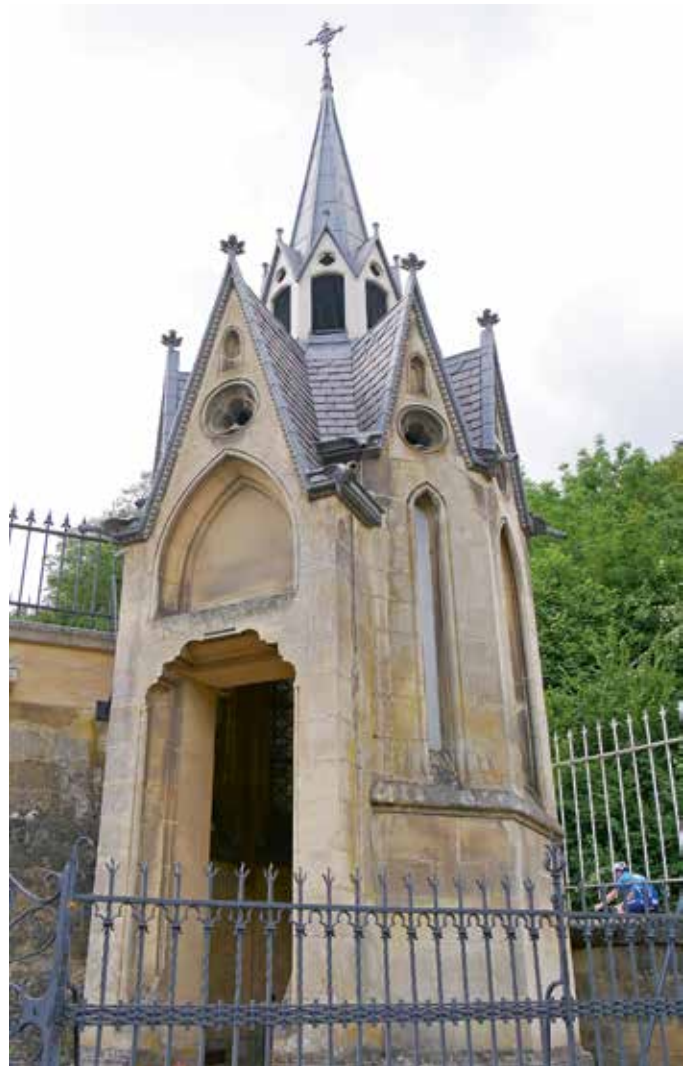
Een wielrenner zwoegt de Cauberg op.