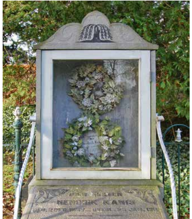
Rechthoekige graftrommel voor Hendrik Kanis te Kampen, geïntegreerd in het staande grafmonument. Foto Bert Pierik Foto omslag: Graftrommel van 'lieve dochter en zuster Geertien' op de begraafplaats in Roden. Foto Bert Pierik