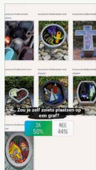
Schermafbeeldingen van het onderzoek