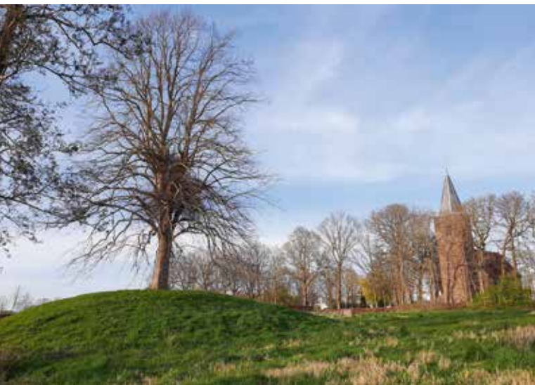
Stinswier met kerk.