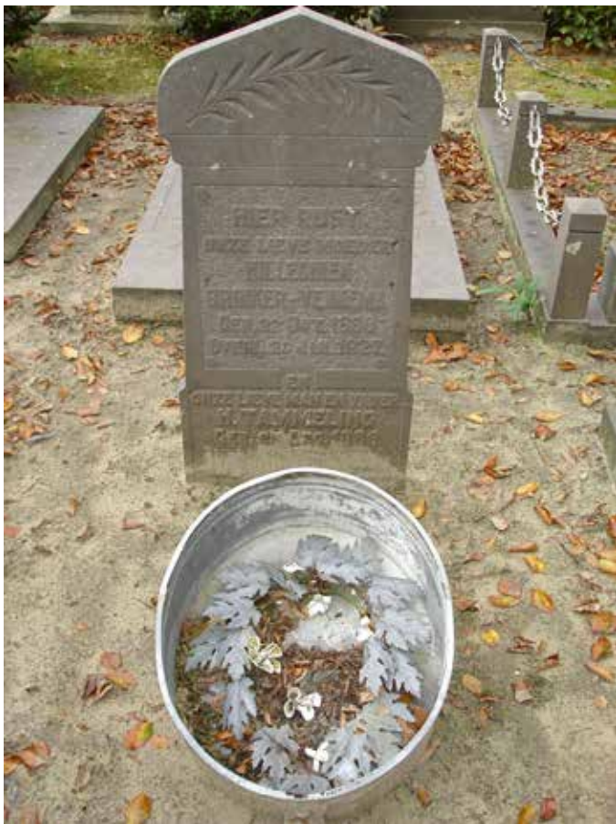
De graftrommel van meester Tammeling in 2017, na ruim tachtig jaar in weer en wind.

H oe begon het? Een enkeling in het dorp wist nog wel dat er ergens voorin op de begraafplaats aan de Voorweg een hoopje oud roest lag – een graftrommel. Steevast volgde dan uitleg: dat er vroeger overal van dat soort blikken trommels op graven gelegen hadden, met kunstbloemen erin. Dat de een na de ander verdwenen was en dat er op heel Voorne misschien nog maar eentje over was: die in Oostvoorne.