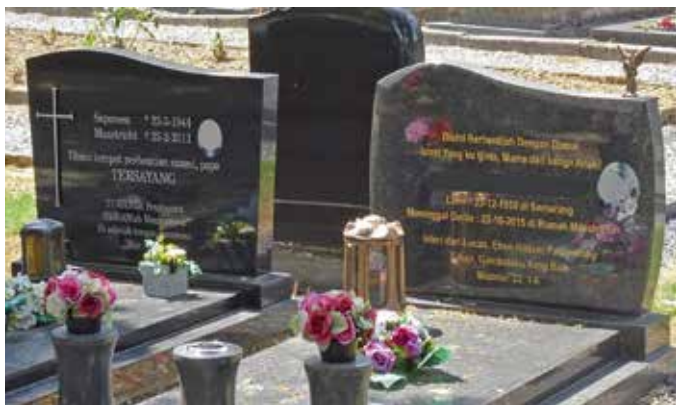
Moluks-Maleise teksten op grafmonumenten.

Het Europese Hera-project onderzoekt hoe migranten en hun nabestaanden mede vormgeven aan het funeraire erfgoed. In deze rubriek belichten we de situatie in Nederland. Deze keer: Molukse graven op de begraafplaats van Heer, Maastricht.