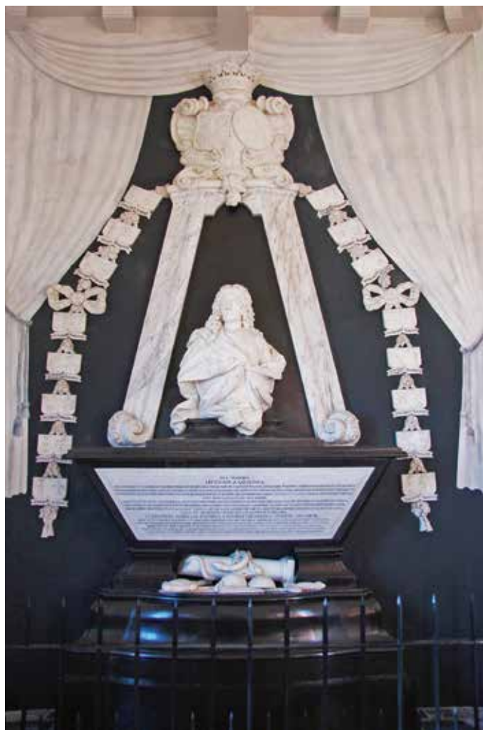
Grafmonument van Sicco van Goslinga door Xavery in Dongjum.

Het contract met Xavery van 22 december 1733 bepaalde dat de tombe recht moest doen aan de 'hooge geboorte en ander qualijtjen van de overledene'. Hij werd namelijk