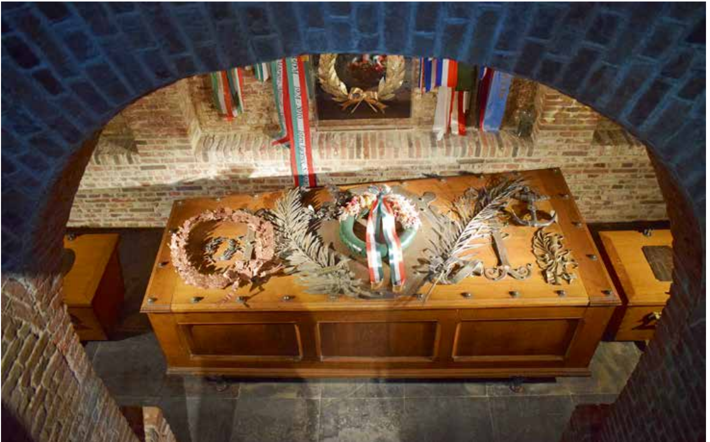
Huidige situatie in de grafkelder, met de kist van De Ruyter in het midden en ter weerszijden een verzamelkist. Aan de wand de zilveren Hongaarse lauwerkrans.

een zerk begraven, waar haar kist later voor de aanleg van vloerverwarming geruimd werd. Tijdens de werkzaamheden in 1956 werd de kist van De Ruyter nog eenmaal geopend. Hij zag er inmiddels zo slecht uit, dat toen gemaakte foto's op verzoek van de familie vernietigd zijn.