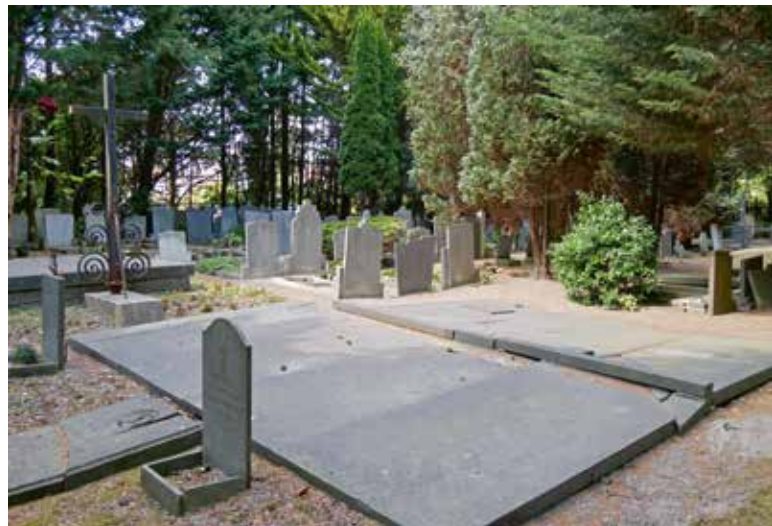
Het eigenlijke kerkhof, achter de voortuin, met de priestergraven bij het kruis en de keldergraven. Linksvoor de zerk met een afbeelding van een gevleugelde zandloper op het graf van priester Mazza, die in 1830 de grond voor het kerkhof aankocht en kort daarna overleed.

Landelijk staat onze begraafcultuur ernstig onder druk, zeker de katholieke