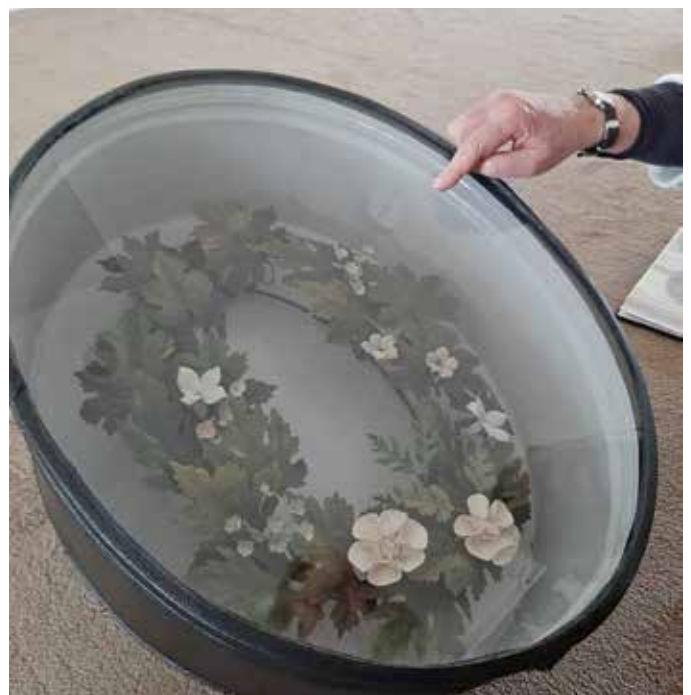
De trommel in 2020, gerestaureerd door medewerkers van het graftrommelatelier in Veenhuizen.