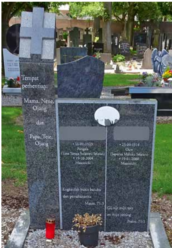
Christelijke elementen op een grafmonument: een kruis en een psalmtekst.

Ook valt het overwegend protestantse karakter van de graven op. De meerderheid heeft nog altijd een verwijzing naar een Bijbeltekst of een afbeelding van een kruis.