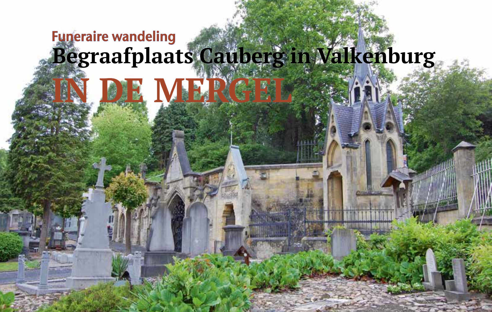
Neogotische graven met kapelletje.

Denk aan Valkenburg en je denkt aan de schoolreis die je in je jeugd maakte met bezoek aan de grotten, de kasteelruïne inclusief de kabel- en rodelbaan. Stadje van kastelen, van vuursteen en van mergel, doorsneden door de Kleine Geul. De levende historie in het heuvelland met vele terrassen aan gezellige straten, waar de geur van gebraden halve haantjes zich moeiteloos vervlecht met het Romeins verleden. Sommige dingen veranderen niet.