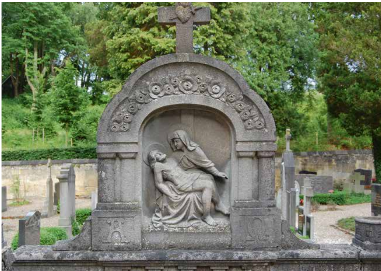
Piëta, detail van het graf van de familie Pappers-Flachs uit 1921.