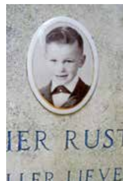
Foto op een kindergraf, op zich al een tijdsbeeld.

Begin mei kopte de editie Westland van het Algemeen Dagblad : 'Begraafplaats aan de Dijkweg gaat flink op de schop'. Misschien niet echt groot nieuws, want de laatste bijzetting was in 1981 en per 1 januari 1982 werd het kerkhof formeel gesloten. Na dertig jaar vereiste grafcrust is het dan ook niet verwonderlijk dat de eigenaar plannen met het perceel heeft. Wat gaat hier gebeuren? Altijd interessant, want plannen voor ruiming worden in veel plaatsen gemaakt – maar alternatieven zijn er (gelukkig) ook.