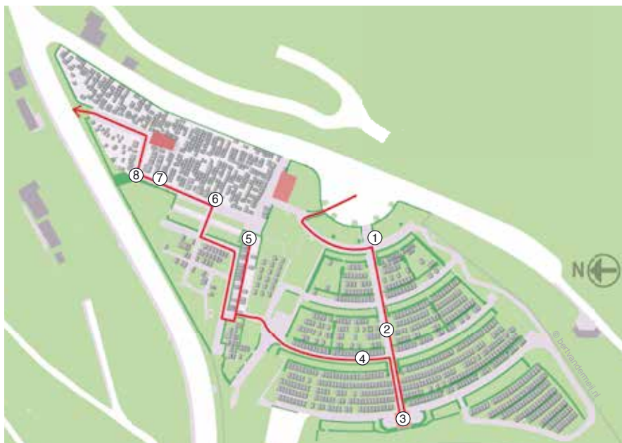
Overzicht van de wandeling.

We vervolgen onze weg, met de grafkapel rechts van ons. De vensters zijn zo beschilderd (met monogrammen, kransen en andere religieuze symbolen) dat ze de suggestie van glas-in-lood moeten wekken. De kapel is gesloten voor publiek. Dit oude deel van de begraafplaats zit vol grafsymboliek: geknakte bloemen, palmtakken, kransen van eikenbladeren, gesluisde urnen en een enkele gestileerde gevleugelde zandloper. We zien ook talloze decoratieve elementen, zoals druivenranken, fijn- en prikwerk, reliëfs, familiewapens en portretten. Veel versiering heeft een religieus karakter: kruizen, kruisbeelden, Christuskoppen en beeltenissen van Maria met kind.