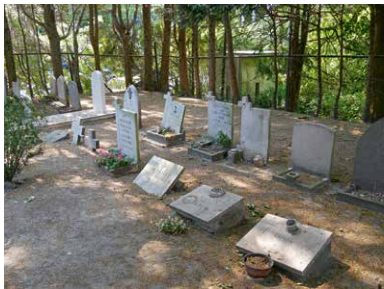
Het hoekje kindergraven rechts van het tweede toegangshek, met het enige oorlogsgraf op dit kerkhof.