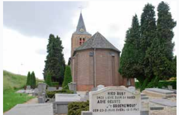
Het kerkhof van Hien, gemeente Neder-Veluwe.