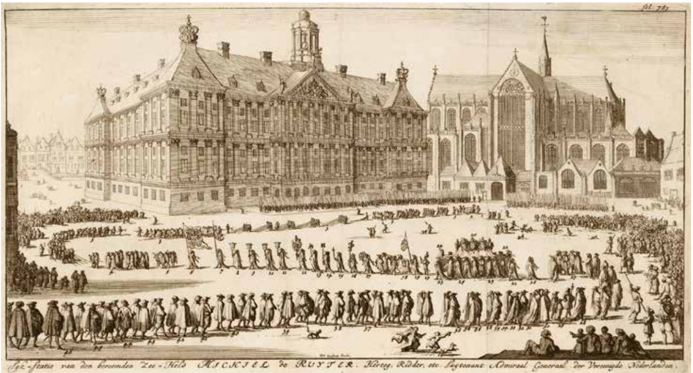
'Lyk-statie van den beroemden zee-held Michiel de Ruyter.' Prent uit 1683 van Jan Luyken.