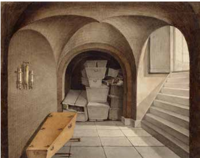
De grafkelder in 1813. Tekening van Gerrit Lamberts.

Op een prent van Lambert Gerrits uit 1813 is te zien hoe opeengestapeld de kisten in de crypte stonden. De tekening geeft vooral een kijkje in het rechter gedeelte. Links onder staat de grote kist van Michiel de Ruyter.