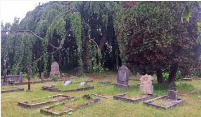
De oude R.K. Begraafplaats in 's-Heerenberg.

Het programma begint om 11:00 u in Grandcafé De Snor, Molenstraat 2, 7041 AE 's-Heerenberg. 's Ochtends zijn er lezingen over Begraafplaats Martinus te Didam en de Joodse Begraafplaats te 's-Heerenberg. Na de lunch zijn er rondleidingen over de Protestantse Begraafplaats en de oude R.K. Begraafplaats. Vanaf 16:15 u sluiten we af met een borrel die tot 17:00 u duurt. Het volledige programma vindt u op onze website terebinth.nl , ook als pdf, zodat u het uit kunt printen. Aanmelding: uiterlijk 25 september a.s. via bureau@terebinth.nl (tel. 06 2417 3646) Deelnamekosten (incl. koffie en lunch; excl. borrel): € 20 (donateurs) en € 25 (niet-donateurs); a.u.b. uiterlijk 25 september overmaken op rekeningnummer NL 92 INGB 0000 3355 36 t.n.v. Terebinth, o.v.v. 10 oktober.