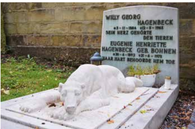
Het graf met de liggende ijsbeer van circusdirecteur Willy Hagenbeck en zijn vrouw.

Het pad loopt hier dood en, terug bij de joodse begraafplaats, wandelen we door over het protestantse deel in de