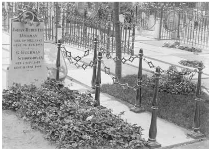
Graf IJzerman op begraafplaats Zorgvlied, 1891. Er zijn diverse graftrommels te zien.

In wat tot nu toe is gepubliceerd over graftrommels, ligt de focus vooral op het object zelf. Hierbij gaat het om het praktische gedeelte van het bewaren voor de toekomstige generaties, zoals restauraties. En hoewel bij genoeg trommels de functie in stand wordt gehouden, en dus de