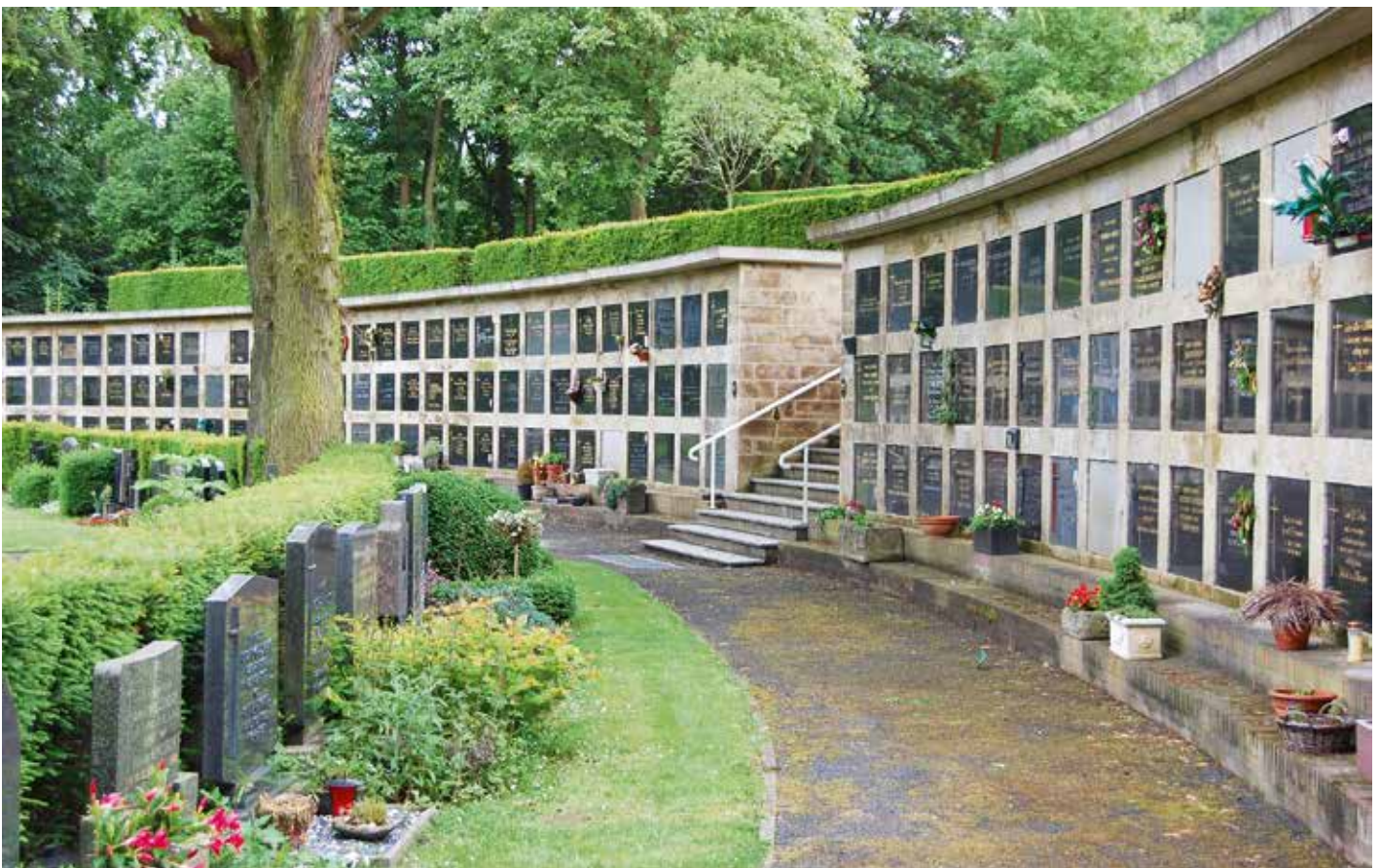
De wandgraven zijn afgesloten met donkere sluitstenen.

Bij de ingang staat een informatiebord. De begraafplaats is onderdeel van de wandelroute Begraven: onder- en bovengronds, zie mergelnu/wandelroute-begraven.html