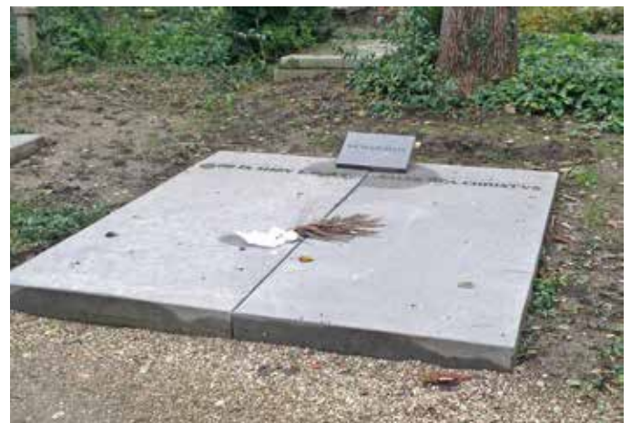
Graf van de negentiende-eeuwse schrijver Nicolaas Beets op Soestbergen in Utrecht. Beets rust links onder de Bijbeltekst 'God is mijn licht'. Later is een steen met zijn naam geplaatst. Het graf is kort geleden gerestaureerd.