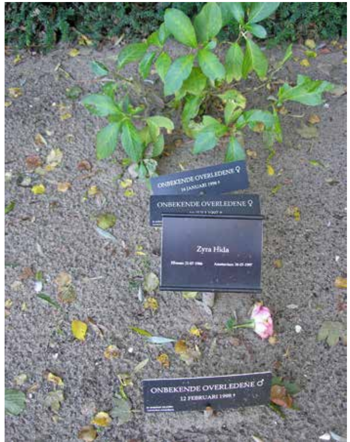
Graven van onbekenden en een alsnog geïdentificeerde overledene.