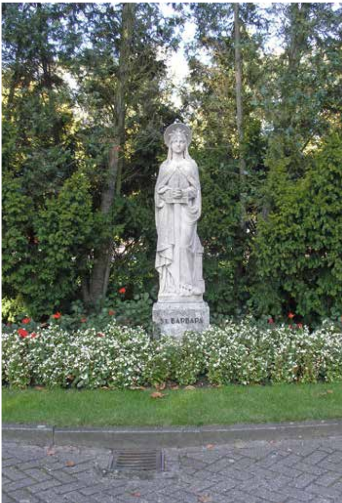
Sint Barbara op de gelijknamige begraafplaats in Amsterdam, die waakt over bekende en onbekende doden.