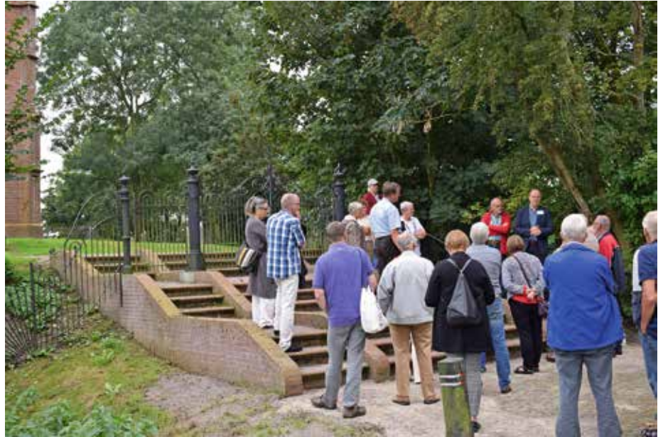
De opnieuw in de oude vorm opgemetselde trappen van Toornwerd. Op deze begraafplaats staat geen kerk, alleen een toren die linksboven nog net is te zien.

Ook legde hij uit dat niet alles onder handen genomen hoeft te worden. Bemoste stenen kunnen zo blijven, de begroeiing geeft het kerkhof karakter. Als de tekst leesbaar moet worden, kan alleen dat deel van de steen worden schoongemaakt en kunnen zij- en achterkanten onaangevoerd blijven. Wat niet in acute nood verkeert, mag ook rustig blijven liggen, zolang maar af en toe wordt gekeken of alles nog goed gaat.