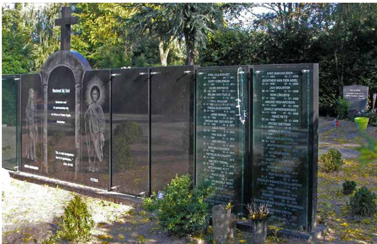
Tweede grafmonument van het Drugspastoraat Amsterdam.

Van de ongeveer 350 uitvaarten per jaar die de gemeente verzorgt (het aantal is vrij stabiel), is een klein deel een Eenzame Uitvaart: tien tot vijftien per jaar. Er wordt dan geen enkele nabestaande/vriend/ buurvrouw op de uitvaart verwacht. De gemeente schakelt vervolgens stichting De Eenzame Uitvaart in, een ‘poule des doods’ van dichters die sinds 2002 een gedicht speciaal voor de overledene schrijven en op de uitvaart voordragen. ‘Dit vanuit de gedachte dat ieder mens de moeite waard is om over na te denken en het verdient om met speciaal voor hem of haar gekozen woorden begraven te worden’, aldus de website. Medewerkers van TRUP zijn zoveel mogelijk aanwezig op ‘grote, problematische en eenzame uitvaarten’. De verantwoordelijkheid blijft immers bij de gemeente liggen.