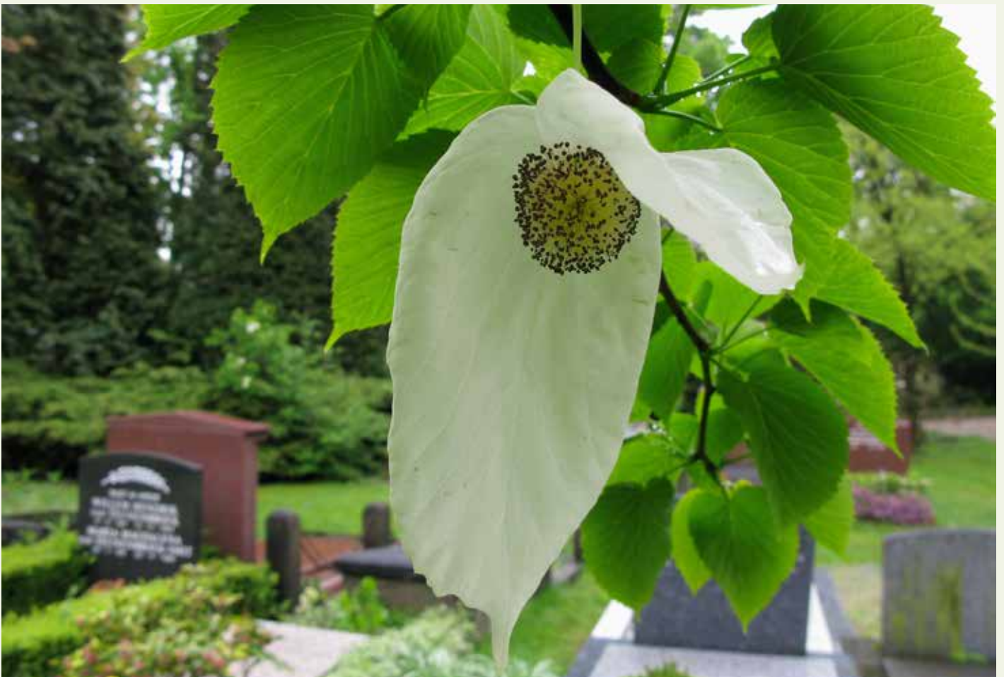
Zakdoekjesboom op De Nieuwe Ooster.