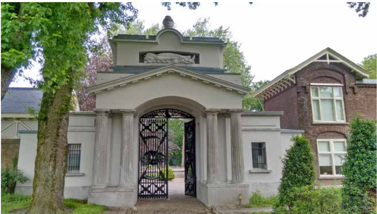
De oude poort met het toegangshek vol doodsymboliek en een dode in zijn grafkelder.

In de jaren dertig vond aan de andere kant van de singel de laatste uitbreiding plaats, 'Over de brug', uitgevoerd als werkverschaffingsproject. Dat werd aangelegd door landschapsarchitect J.T.P. Bijhouwer, die ook het nabijgelegen Kralingse Bos ontwierp. Hier zijn graven in Art Deco-stijl en sommige vertonen verwantschap met gebouwen in de stad uit die tijd, zoals de Bijenkorf van Willem Dudok of het Atlanta Hotel van F.A.W. van der Togt. De vier delen hebben allemaal hun karakter en vragen een eigen manier van onderhoud: bij het eerste restauratie, het tweede reconstructie, het deel van Springer conserveren en bij deel O kunnen transformaties plaatsvinden.