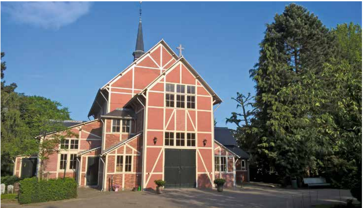
De aula van de begraafplaats Sint Barbara in Amsterdam, die onlangs is gerestaureerd.