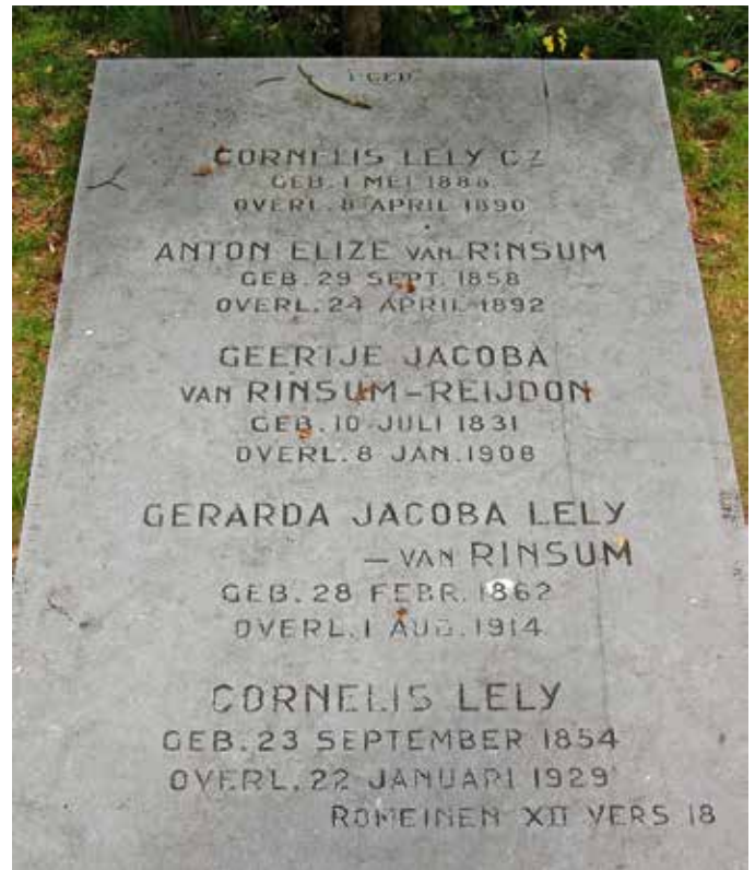
Graf van Cornelis Lely op de Gemeentelijke Begraafplaats Kerkhoflaan in Den Haag.

Desondanks zijn rechthebbenden bekend die een naamloos graf willen, maar zich toch verzetten tegen foto's. Neem een dichter die begraven lag bij slachtoffers van een razzia van de Wehrmacht in 1944. Toen bekend werd dat hij lid was geweest van de SS, liet de weduwe hem in alle stilte herbegraven in een grotere gemeente. Het is begrijpelijk dat foto's van dat tweede graf ongewenst zijn. Nabestaanden vrezen bij publicatie vernielingen - maar vandalisme komt bijna altijd voort uit willekeurige baldadigheid.