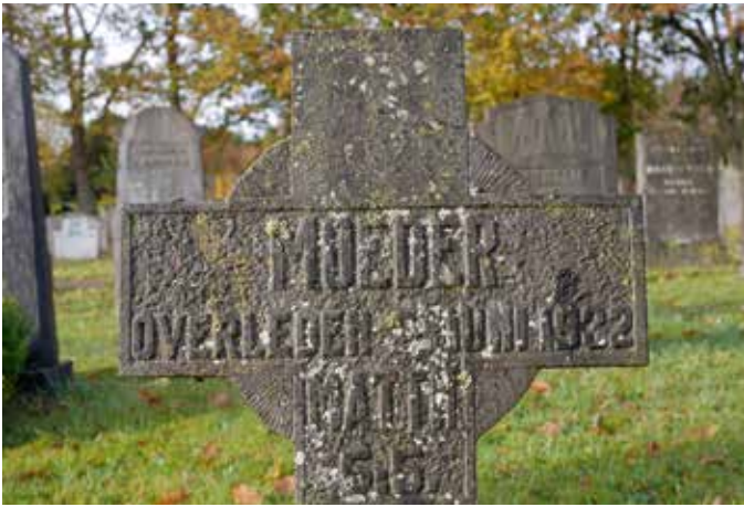
Anoniem graf met de inscriptie 'moeder', overlijdensdatum, en Matt 5:5.

Daar ontbreekt het wel eens aan. Twee voorbeelden op de Algemene Begraafplaats Kerkhoflaan in Den Haag. Cornelis Lely (1854-1929) staat met naam en data nog net vermeld onder eerder gestorven familieleden. Doet die zuinigheid recht aan de staatsman, aan wie we de Zuiderzeewerken danken? Daarentegen is het simpele 'Thorbecke' op zijn tombe in overeenstemming met de onverschrokken eenvoud van de grote wetgever tegenover academici, adel en koning Willem III. Funeraire cultuur is veelvormig en gevarieerd.