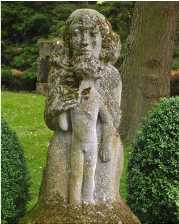
Graf met het beeld 'Moeder en kind' van Hendrik Chabot. Zie p. 18.