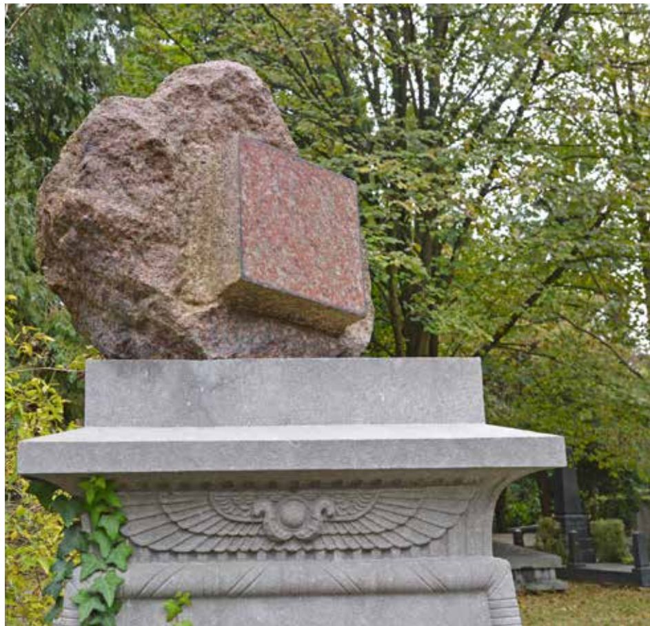
Vrijmetselaarsgraf waarbij de stèle uit een ruw gehakt granieten rotsblok bestaat, met daarin een gepolijst vierkant.