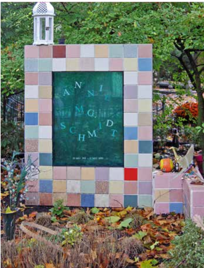
Het graf van de bekende kinderboekenschrijfster Annie M.G. Schmidt ligt op Zorgvlied in Amsterdam prominent aan een hoofdpad en wordt veel door bewonderaars bezocht. Het werd op een toegankelijke manier ontworpen door haar zoon.

In Europa zijn het Cimiterio Monumentale in Milaan of Père Lachaise in Parijs beroemde begraafplaatsen. Welgestelden hebben daar tempeltjes en standbeelden boven hun graf opgericht. Op begraafplaatsen in Nederland komt dat sporadisch voor. Wie zou dat die familie misgunnen? Wie naast naam en data ook titels vermeldt of functies, wil passanten duidelijk maken welke VIP hier begraven ligt. Dat kan de drang zijn zich te onderscheiden, maar ook een terecht maatschappelijk of kunstzinnig eerbetoon.