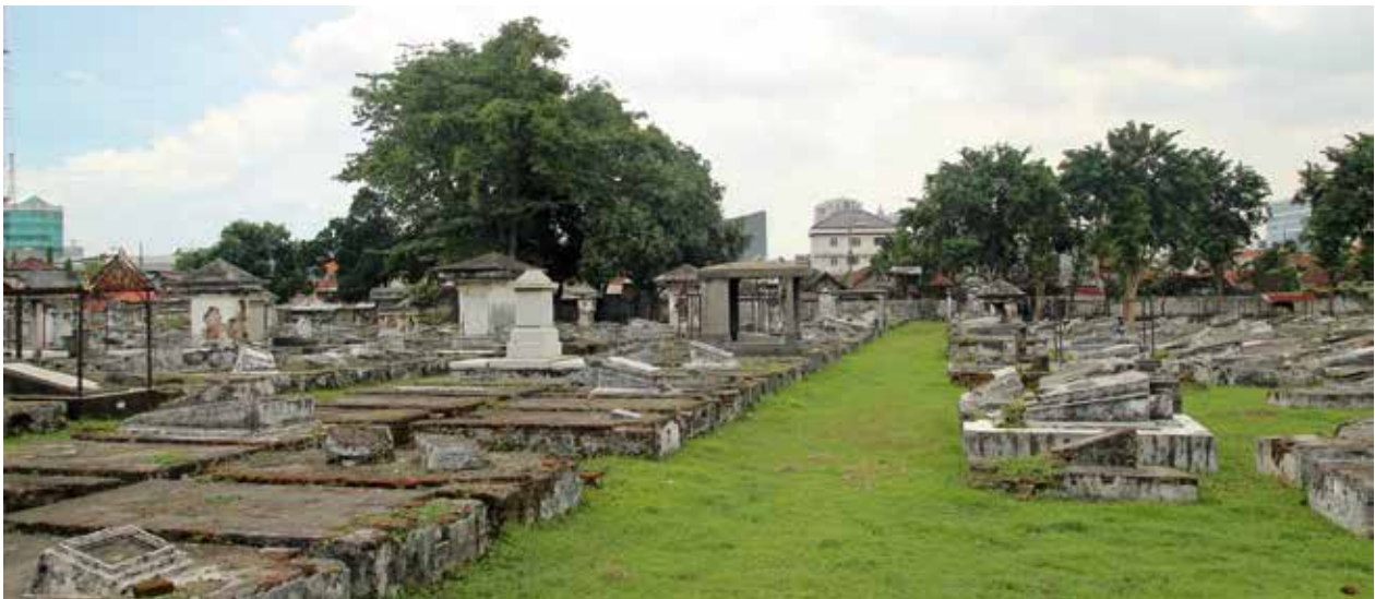
Een pad op de oude begraafplaats Peneleh in Surabaya. Deze structuur is geheel intact, wat niet kan worden gezegd van de grafmonumenten.

Links: dodenakkers.nl/artikelen/buitenland krancher.com/begraafplaats-peneleh-soerabaja pentalpha.nl/diversen/peneleh