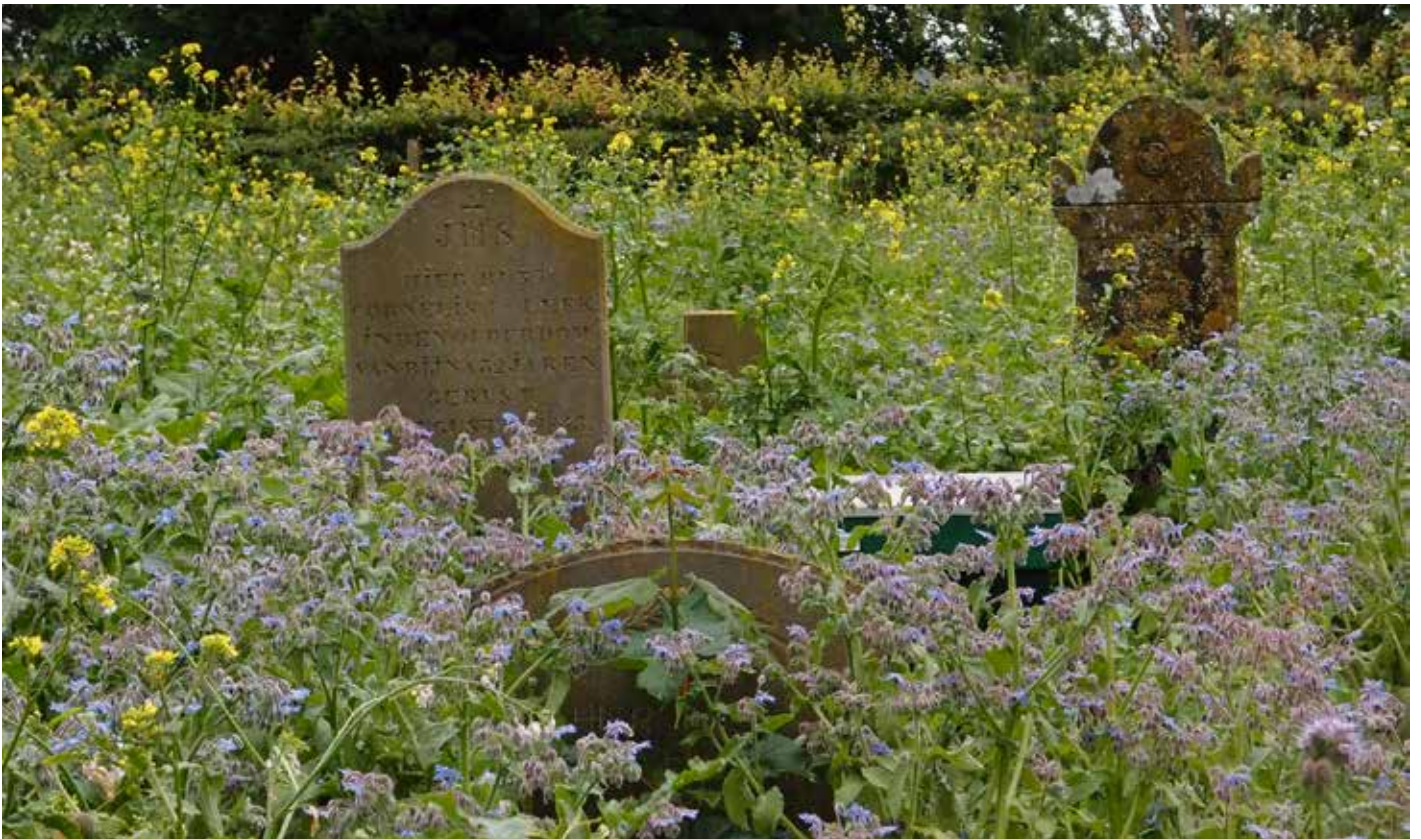
Kerkhof op het omringende terrein van de Protestantse Kerk in Egmond-Binnen, die in 1836 werd gebouwd op de plek van de oude abdijkerk.

De monniken worden begraven op de kleine kloosterbegraafplaats aan het einde van het bospad. Deze rustplaats is eenvoudig ingericht, aan weerszijden van het pad liggen de monniken en oblaten begraven. Eenvoudige