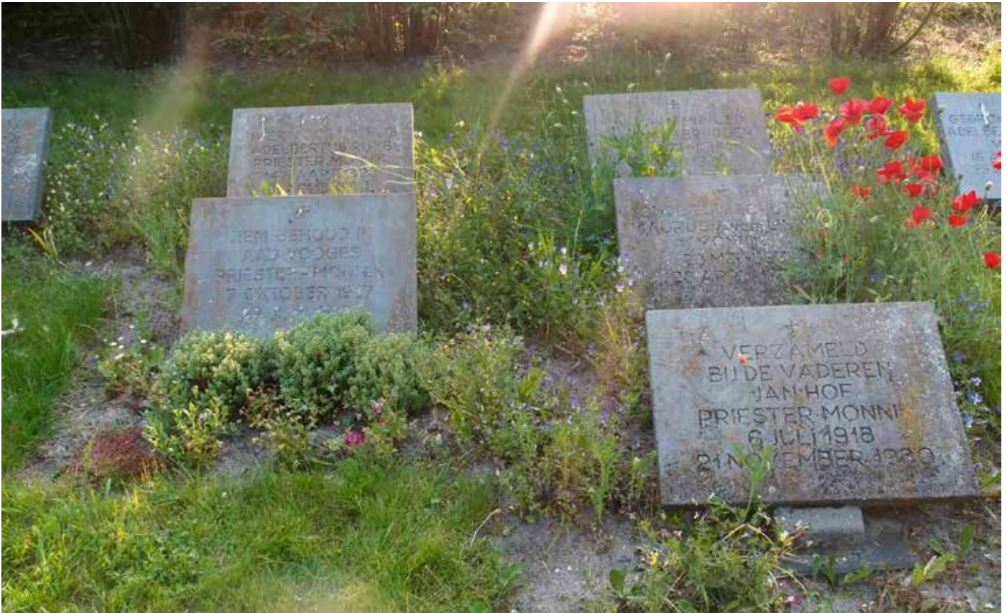
Eenvoudige stenen op de kloosterbegraafplaats van de Abdij van Egmond.

vierkante stenen sieren hun graven. Op de kop van het pad staat een markant modern vormgegeven kruisbeeld.