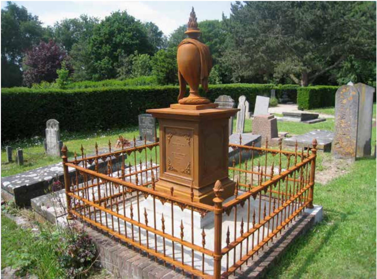
Graf uit 1839, Begraafplaats Huisduinen in Den Helder, opgericht door 'vrienden en wapenbroeders' van de overledene.