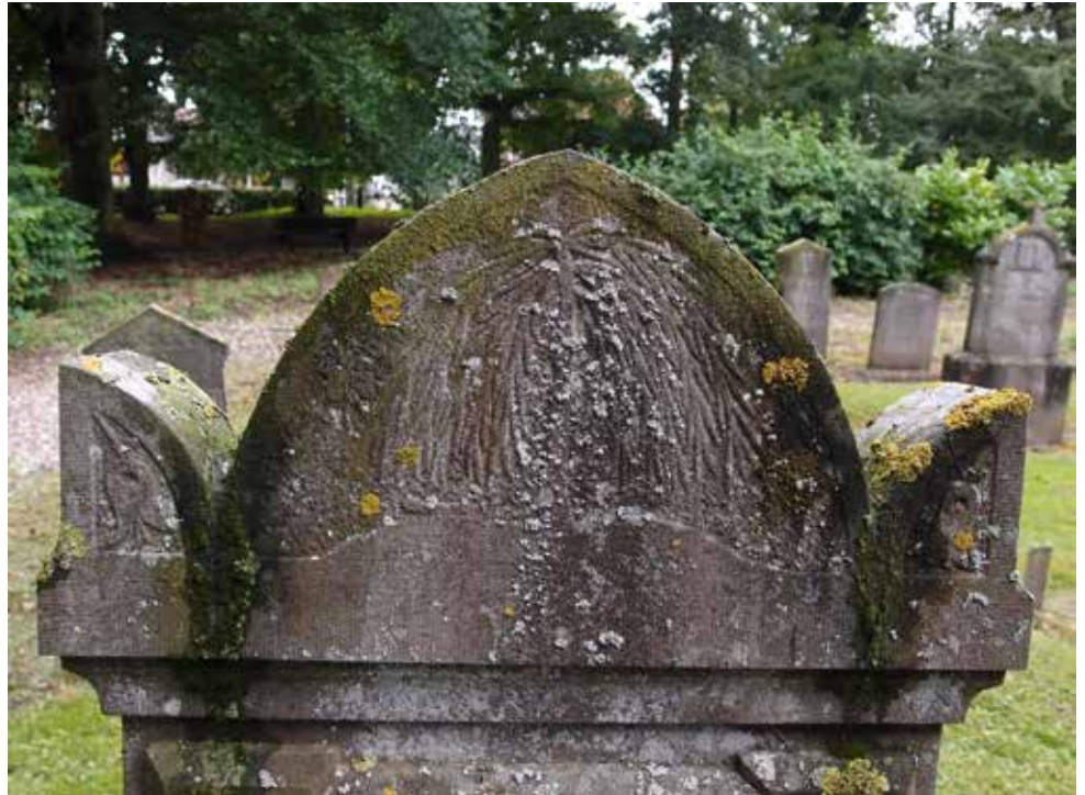
Grafsteen met acroteria ('oortjes') voor het ophangen van doodskransen op de begraafplaats van Egmond aan Zee.

Egmond aan Zee heeft met haar witte vuurtoren een blikvanger van formaat. De toren werd in 1831 gebouwd als 'waker der zee', maar fungeert sinds 1834 ook als monu-