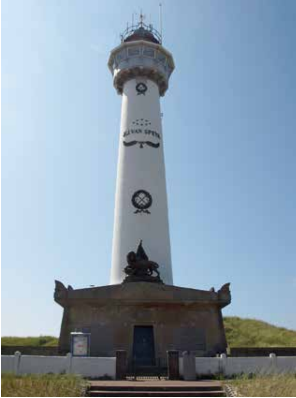
Monument voor luitenant-ter-zee Van Speijk, ontworpen door Jan David Zocher Jr. in de vorm van een graf, waarbij de vuurtoren van Egmond als gedenknaald fungeert. Foto omslag: Het eerste columbarium op Begraafplaats & Crematorium Westerveld in Driehuis, dat architect W.M. Dudok daar bouwde, zie p. 12-13.