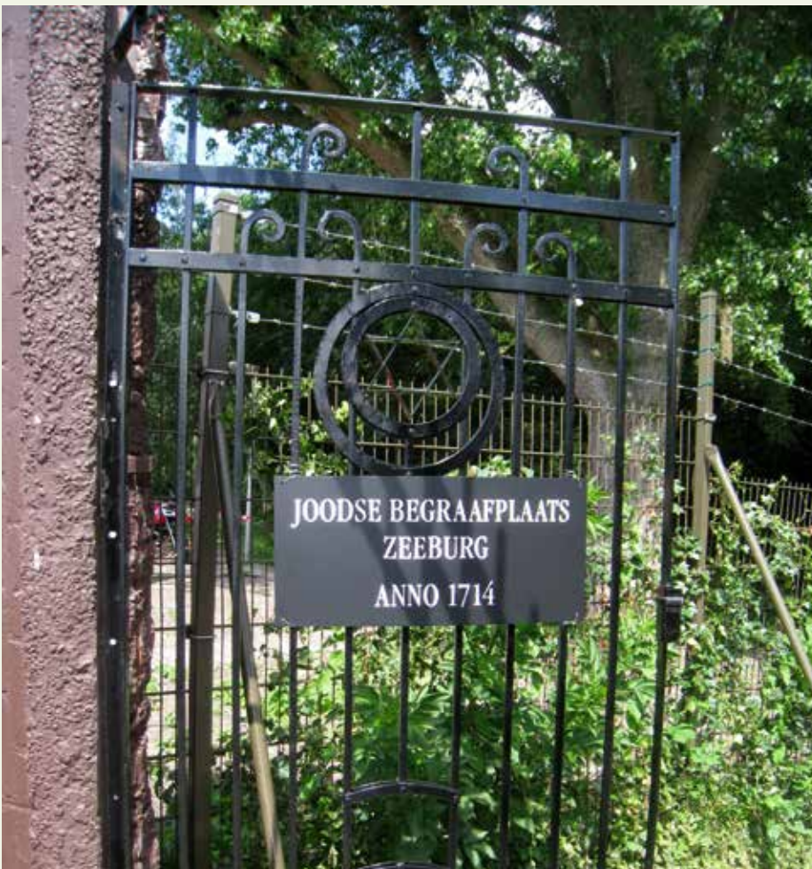
Poort van de joodse begraafplaats Zeeburg in Amsterdam, die nu wordt gerestaureerd.