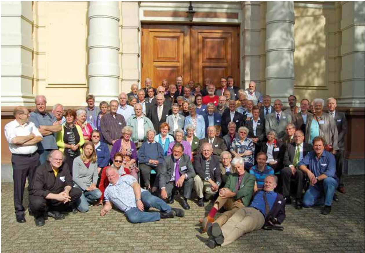
Aanwezigen tijdens het 25-jarig bestaan van de Terebinth in 2011 te Hilversum.