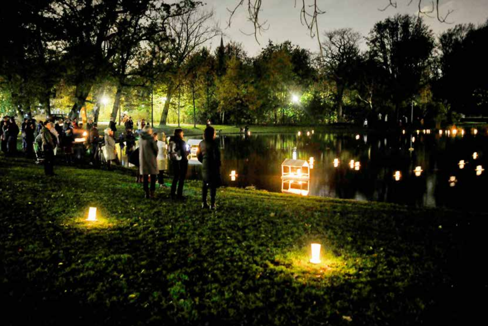
Allerzielen in het Vondelpark bij de grote vijver in 2013.