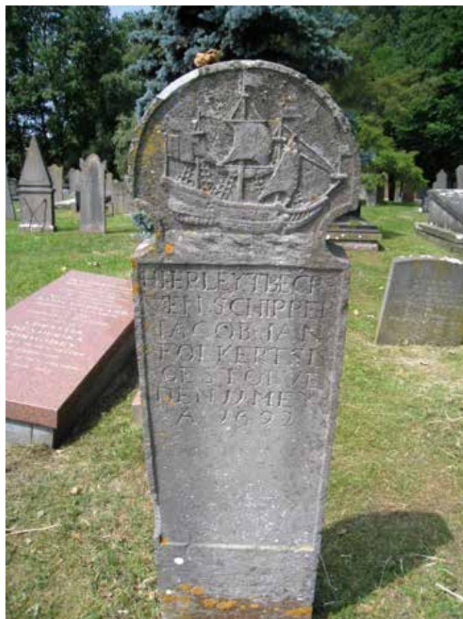
Graf van een schipper uit 1692 op de Algemene begraafplaats Huisduinen in Den Helder.