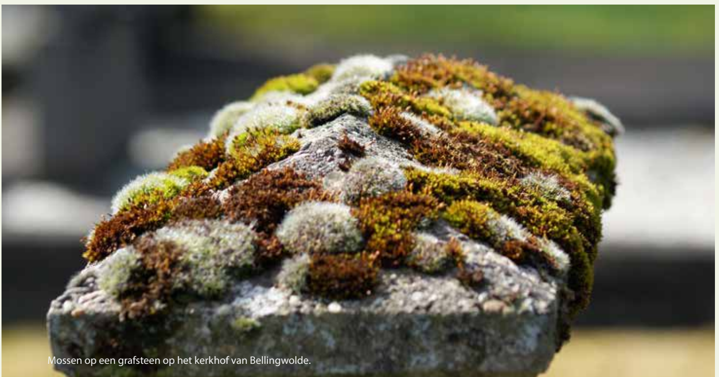
Mossen op een grafsteen op het kerkhof van Bellingwolde.