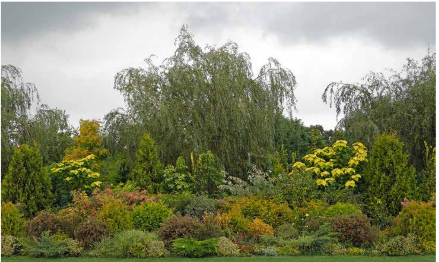
De 'gele rand' op begraafplaats Nieuw Bergklooster in Zwolle van tuinontwerper Harry Pierik, die als een ondergaande zon over de graven schijnt.