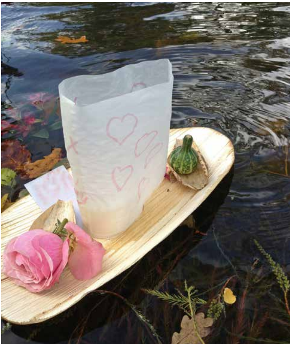
Bootje met een kaarsje, een briefje en enkele voorwerpjes.

Vondelpark Amsterdam, grote vijver 2 november, vanaf 18.30 uur allerzieleninhetvondelpark.nl