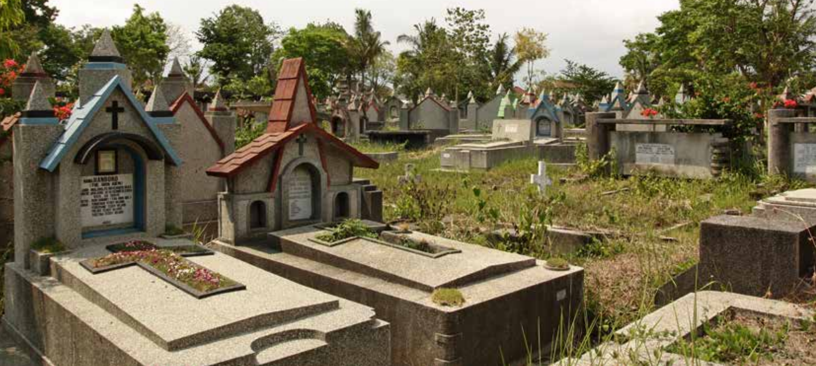
Dichtgegroeide grafvelden op de oude Europese begraafplaats in Malang op Java, waar hedendaagse grafmonumenten de oudere wegdrücken.

Afgezien van de oorlogsbegraafplaatsen uit de Tweede Wereldoorlog zijn er feitelijk geen Nederlandse begraafplaatsen meer te vinden in Indonesië. Toen na vier jaar strijd het doek voor Nederlands-Indië viel, werden alle openbare, gemeentelijke en staatseigendommen overgedragen aan de nieuwe republiek. Vanaf 27 december 1949 werden ook alle door het koloniale bewind aangelegde begraafplaatsen in feite gemeentelijke begraafplaatsen naar Indonesische wetgeving.