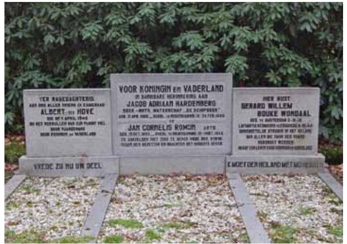
Gemeenschappelijk graf van oorlogsslachtoffers op de gemeentelijke begraafplaats van Markelo