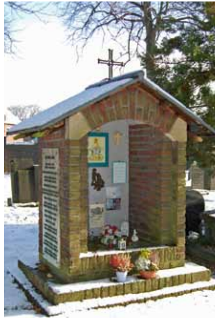
Kapelletje en monument De Schommel voor de slachtoffers van de Montessorischool