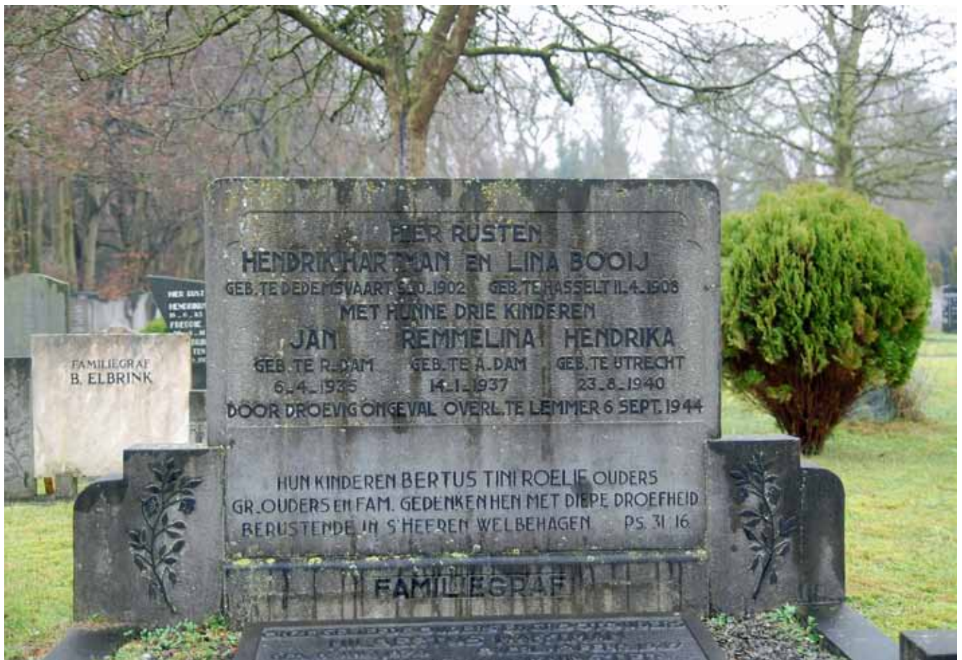
Graf op Bergklooster te Zwolle van een schippersechtpaar met hun drie kinderen die omkwamen door geallieerd vuur