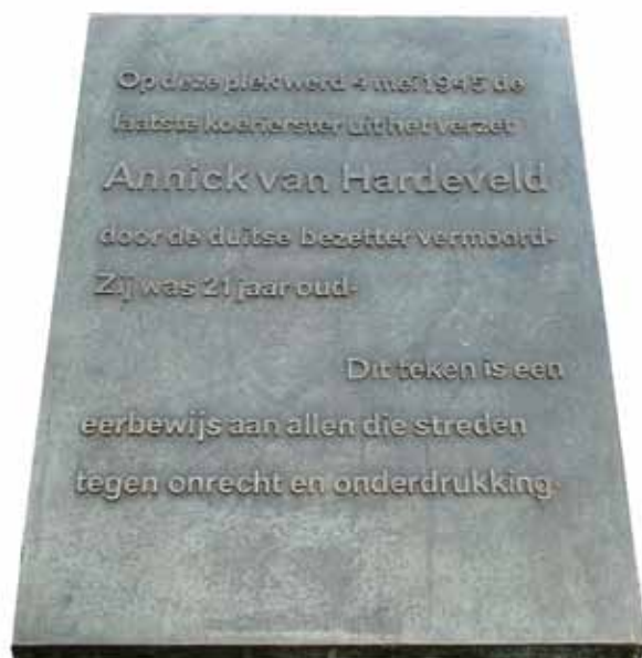
De plaquette op het Hekelveld