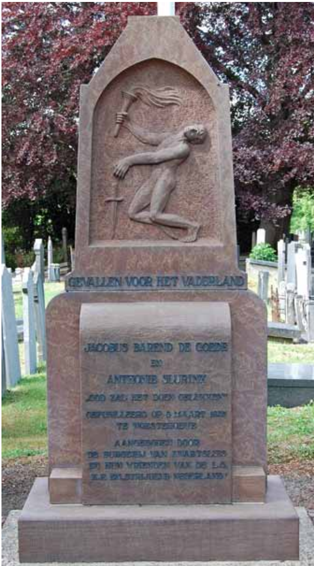
Oorlogsmonument ter nagedachtenis aan gefusilleerde slachtoffers bij Woeste Hoeve op de oude begraafplaats van Zwartsluis