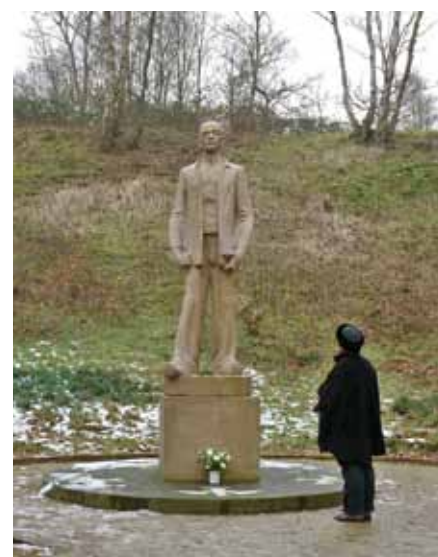
Monument De Stenen Man in kamp Amersfoort, nationaal monument ter herdenking van de gevallen

Na de bevrijding ontdekte het opsporings- en identificatieteam Amersfoort zeven massagraven