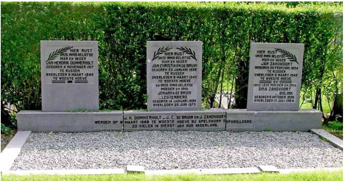
Graf op de oude begraafplaats van Rijssen waar de partners van de oorlogsslachtoffers later bij zijn begraven