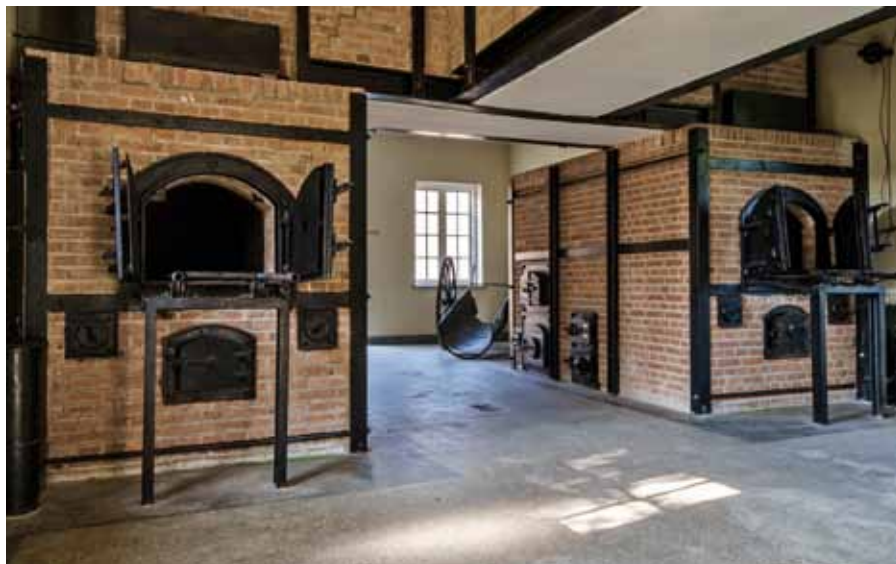
Het crematorium in kamp Vught (in 2014)