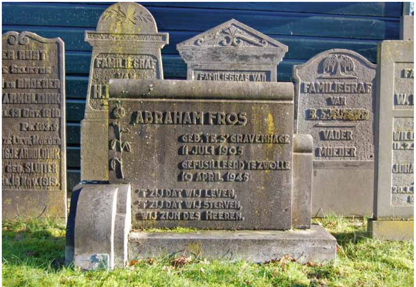
Steen van een oorlogsslachtoffer die is herbegraven in Loenen en nu op de begraafplaats Bergklooster in Zwolle achter het museumschuurtje is geplaatst