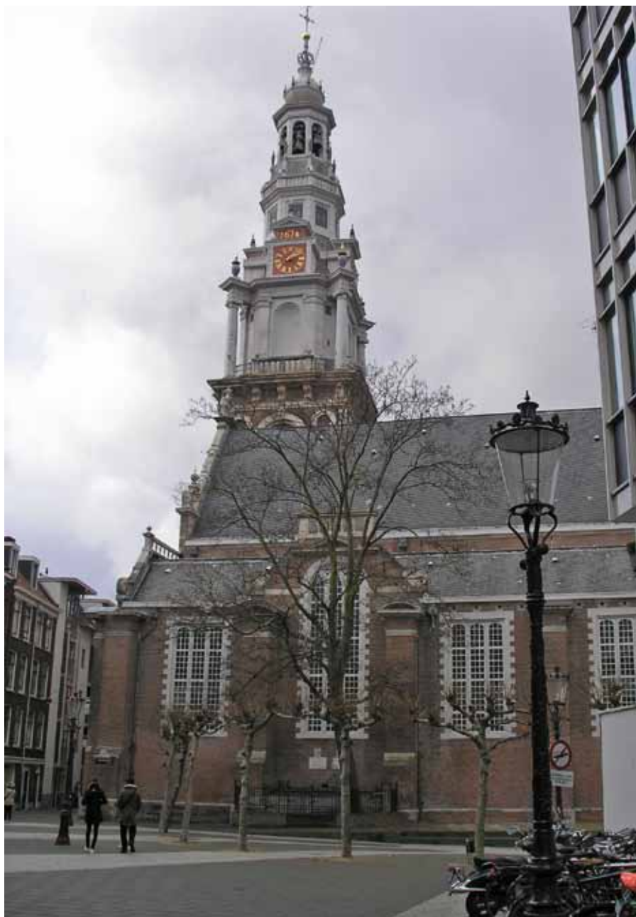
De Zuiderkerk