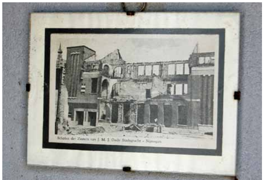
Afbeelding van de gebombardeerde Montessorischool in het grafmonument van de slachtoffers

in de plaats van de deelnemers binnen de stoet. Op begraafplaatsen was tot het midden van de twintigste eeuw de klassenindeling gebruikelijk. Ook bij herdenkingen is sprake van onderscheid. Na oorlogen kregen gesneuvelde opperbevelhebbers lange tijd alle aandacht. Sinds de invoering van de dienstplicht in de Franse tijd worden ook omgekomen soldaten geëerd. Na de Tweede Wereldoorlog dacht men bovenal in termen van goed en fout. Gesneuvelde geallieerden en omgekomen verzetsstrijders hadden daadwerkelijk het naziregime bevochten. Zij kregen als helden alle aandacht. Anderzijds maakte het feit dat bevrijders burgers hadden gedood, een herdenking van burgers pijnlijk. Tijdens de