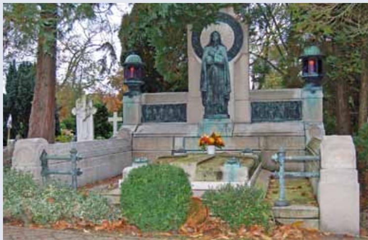
Familiegraf Wiegman met de laatste rustplaats van de katholieke politicus Carl Romme

Na de lezing zal Cappers tijdens een rondwandeling laten zien dat verschillende vernieuwingen uit het verleden nog steeds zichtbaar zijn. Uiterlijk 15.00 uur eindigt de excursie.