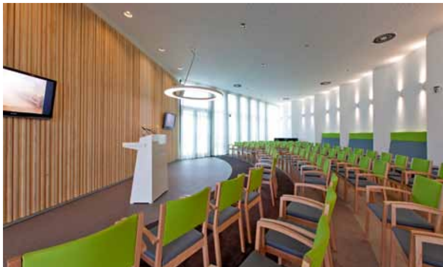
De aula met kleurschakeringen van subtiele aardetinten en groen

Het nieuwe publieksgebouw is ook buitengewoon duurzaam. Het is zeer licht gebouwd, zonder gebruik van beton of steen in de gevels, maar met Accoyahout, houtskelbouw, isolatiemateriaal en glas.