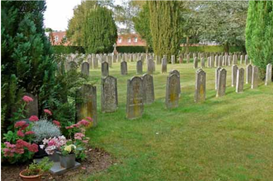
Uniforme patiëntengraven