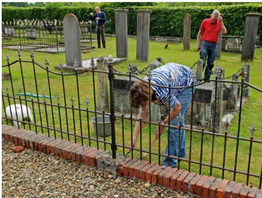
Op het kerkhof bij de kerk van Gasselte

Provinciaal Landschapsbeheer richt zich vooral op het duurzaam in stand houden van het landschap. Naast een beheerplan kan men met vrijwilligers het beheer uitvoeren en het draagvlak voor landschapsbeheer vergroten. Maar werken op een kerkhof of begraafplaats is specialistisch werk en vraagt om specifieke kennis.