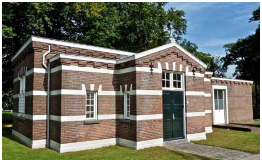
Mortuarium voor vrouwen

ken, weeskinderen en bedelaars. Hun graven liggen rechts van de toegangsweg. In 1890 werd het eerste graf gegraven op het prachtige landgoed. De begraafplaats past er goed in: de plek oogt verzorgd en