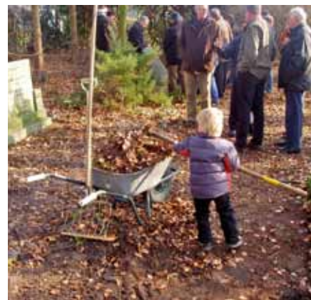
Jonge geleerd, oud gedaan