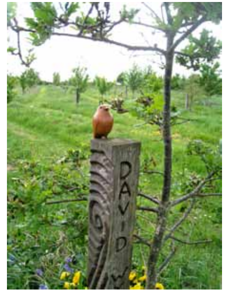
Engeland, Olney Green Burial Ground

Ook natuurbegraafplaatsen laten zien hoe wij met de dood omgaan, hoe wij vormgeven aan ons levenseinde