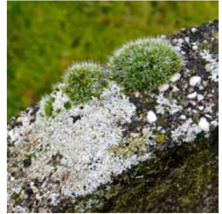
Unieke korstmossen

In het gesticht waren twee congregaties verantwoordelijk voor de verpleging: de zusters van Barmhartigheid en de broeders van Onze Lieve Vrouw van Lourdes, die gespecialiseerd waren in de zorg voor zie-