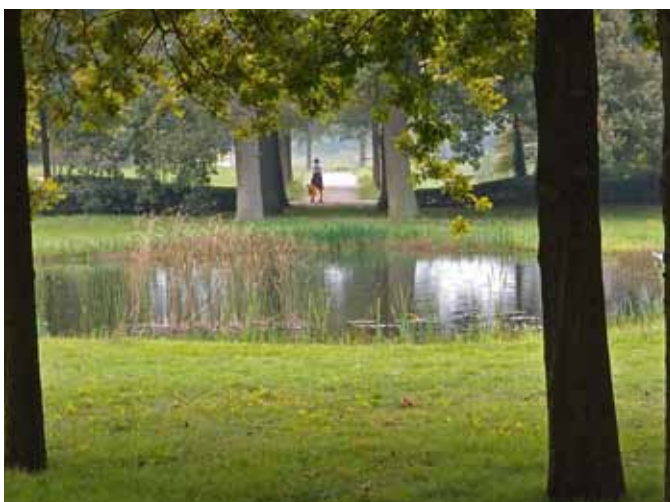
Doorkijkje op Kranenbrug

Dit was de laatste excursie van het seizoen 2014. In 2015 opent De Terebinth in april of mei het nieuwe excursiesizoen. Suggesties en ideeën voor nieuwe bestemmingen zijn welkom via pr@terebinth.nl