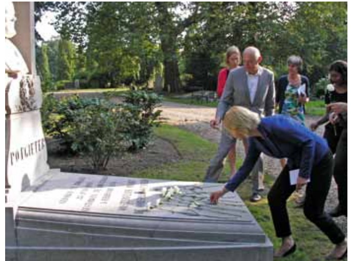
Witte anjers voor Potgieter

sche waarde. Ze vormen, naast boeken, een tastbare erfenis van onze literatuurgeschiedenis. De Koninklijke Boekverkopersbond storte € 75.000,- in het fonds, het Cultuurfonds heeft dit bedrag verdubbeld.