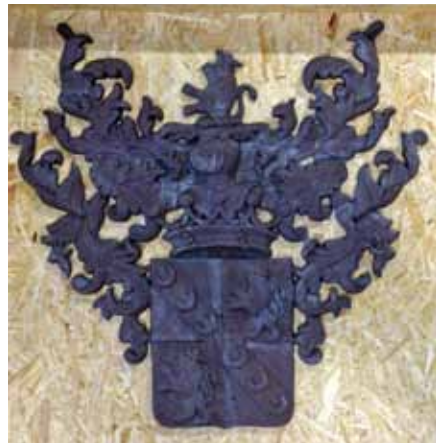
Het familiewapen van De Bellefroid, voor en na de restauratie