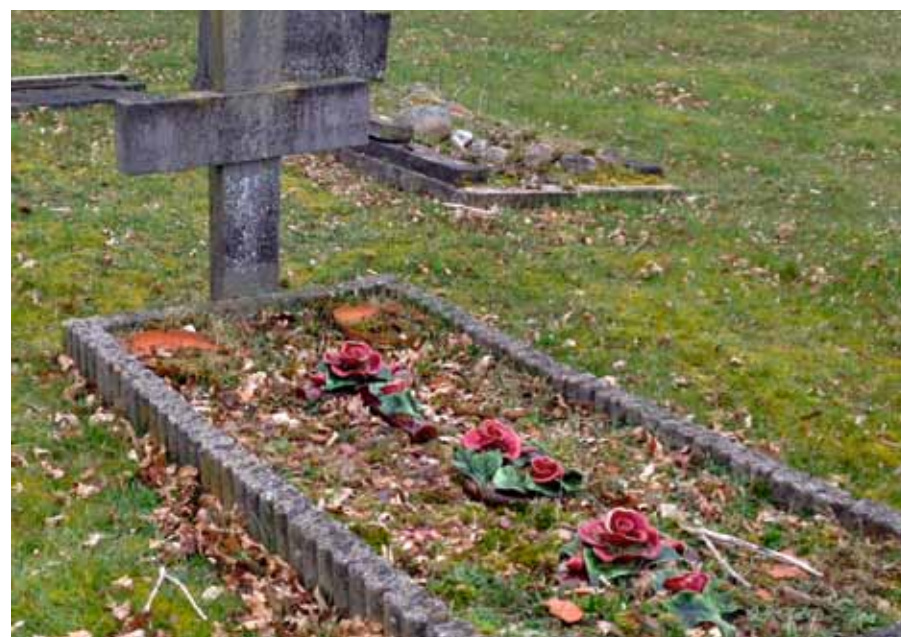
Twee kruizen en een krans van keramik, oude begraafplaats Zuidlaren

één fabriek in Frankrijk, in Bethune, die deze vorm van majolica maakt. De merken Mahieu en Céramiques de France worden hier geproduceerd en zijn als laatste overgebleven in een lange 'bloemrijke' Franse traditie. Ofschoon het nog steeds handwerk is, zie je dat het flamboyante van de oudere stukken niet geëvenaard wordt. Omwille van het productieproces worden de bloemen nu eenvormiger gemaakt, terwijl je in de oudere exemplaren 'de hand van de maker' herkent. Deze oudere exemplaren duiken nog wel eens op rommelmarkten op. Voor het behoud van keramik op begraafplaatsen is niet alleen een taak weggelegd voor gemeenten, instellingen en vrijwilligers, maar gaat het ook om de bewustwording van de gemeenschap.