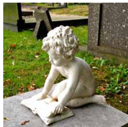
Lezend kindje van porselein, oude deel begraafplaats Roden