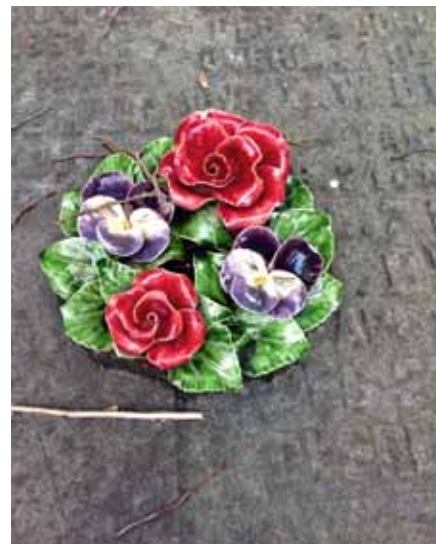
Majolica krans met rozen en violen, begraafplaats Kovelswade, Utrecht

Zoals Bok en Halkus al schrijven: er is nog