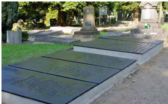
De graven van de familie De Bellefroid, voor en na de restauratie