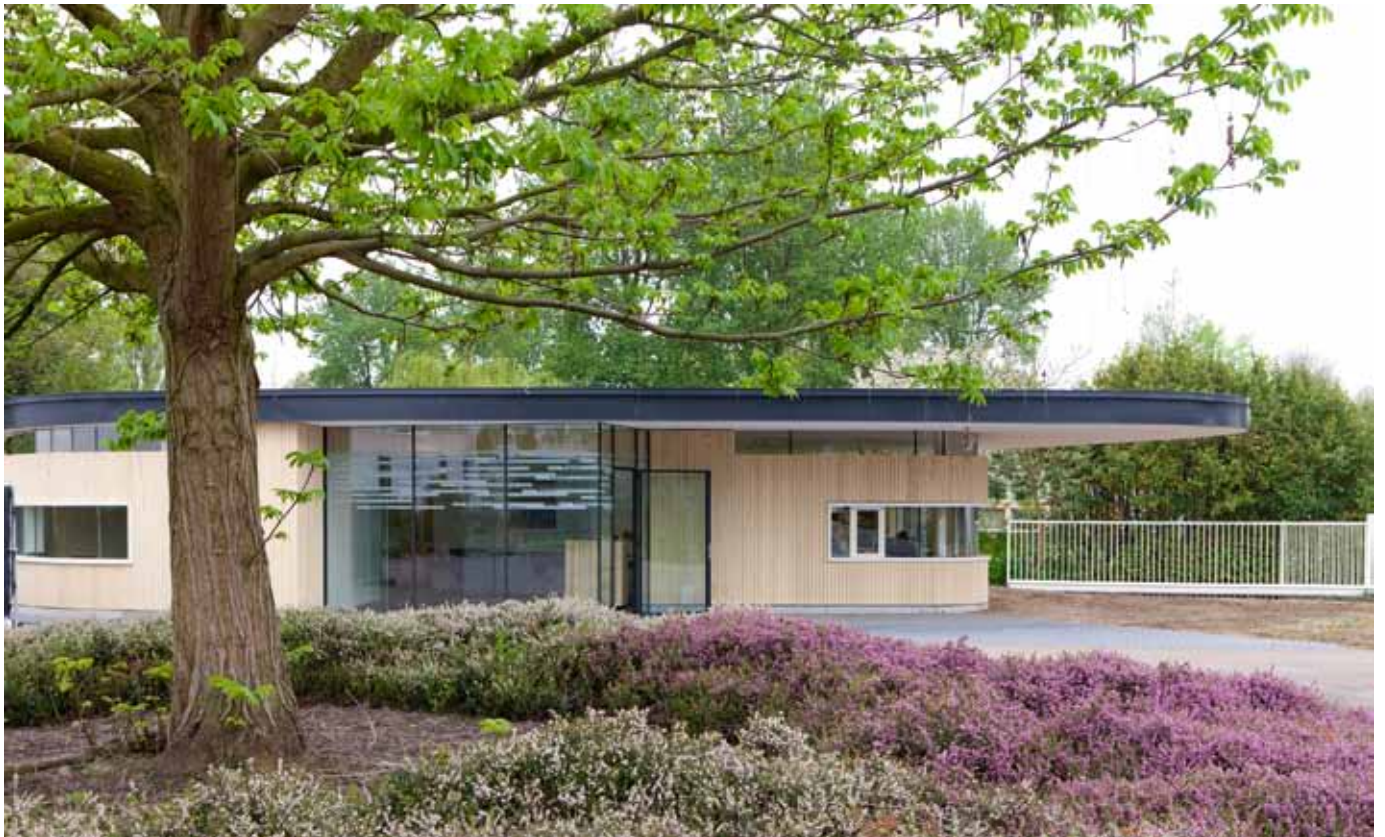
Het plectrumvormige publieksgebouw uit 2012