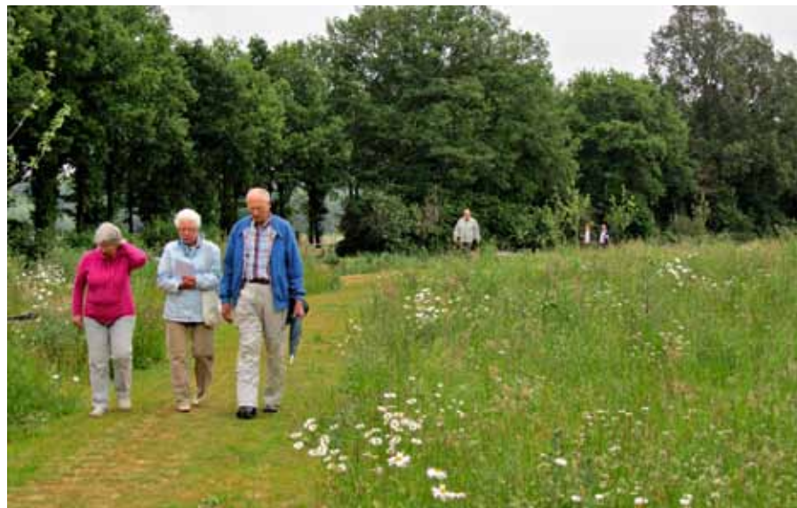
Opening natuurbegraafplaats Slangenburg, Doetinchem

Er zijn nu al veel mensen die zich laten cremieren en niet voor een graf kiezen. Overigens zijn er wel allerlei urnentunnels en -muren op begraafplaatsen te vinden. Een natuurbegraafplaats is een soort tussenvorm: je weet nog wel waar iemand is begraven, maar het uitgangspunt van de overledene was eigenlijk dat hij/zij op een gegeven moment helemaal in de natuur op wil gaan, met gedenkteken en al. De markerings van het graf duurt dan even lang als het houten gedenkteken tijd nodig heeft