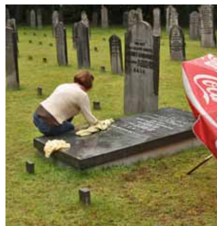
Op de joodse begraafplaats in Apeldoorn

Ook geeft de cursus inzicht in de ecologische en cultuurhistorische waarden van kerkhoven en begraafplaatsen