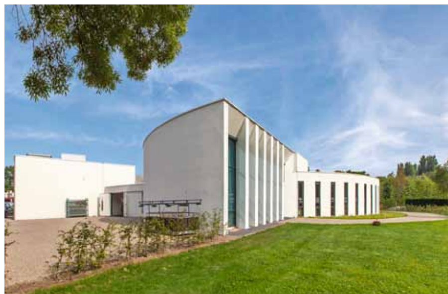
Het ronde aulacomplex met crematorium en ontvangstruimte uit 1988

Beeld en ontwerp: EGM architecten, www.egm.nl