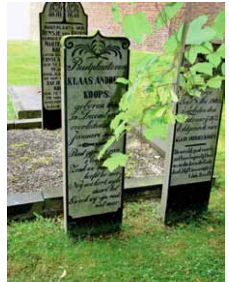
Ooststellingwerf