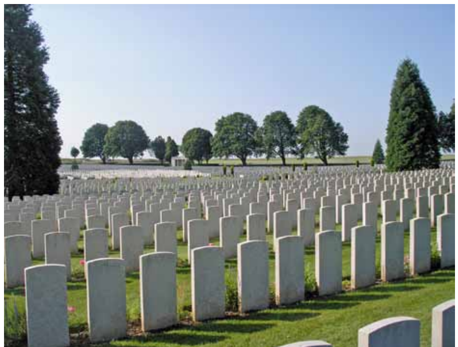
Britse militaire begraafplaats Cabaret Rouge

Goed per trein en auto te bereiken. De steden Arras en Lens bieden prima overnachtingsmogelijkheden. Of neem een landelijke B&B, zoals www.legoutdeshotes.eu/ in Ablain-Saint-Nazaire. Er zijn ook diverse bustrips te boeken. Meer info: www.wegenvanherdenking-noordfrankrijk.com