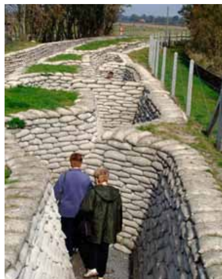
Loopgravencomplex bij Diksmuide

Als je de Westhoek bezoekt word je voortdurend herinnerd aan de Eerste Wereldoorlog. Honderden grotere en kleinere Britse, Belgische, Franse en Duitse oorlogsbegraafplaatsen markeren het landschap. Op bijna elk kruispunt verwijzen kleine groene bordjes naar een 'war cemetery'. In Ieper, Zonnebeke, Poperinge en Kemmel vertellen musea het verhaal van Den Grooten Oorlog. Iedere avond wordt om stipt acht uur onder de Menenpoort in Ieper de 'Last Post' geblazen. Een traditie die al sinds de zomer van 1928 bestaat en alleen onderbroken werd tijdens de Tweede Wereldoorlog. Agenten zetten het verkeer stil en de blazers van de vrijwillige brandweer van Ieper stellen zich op voor de ceremonie. Elke dag, zomer of winter, regen of zonschijn weerklinkt het befaamde Britse militaire eresaluut. Soms zijn er honderden toeschouwers, soms een handjevol.