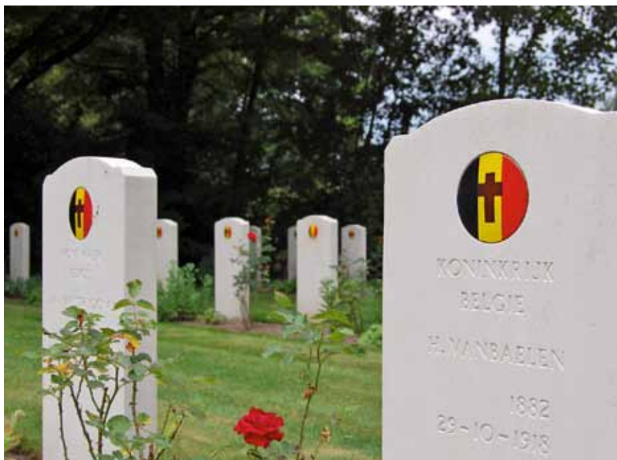
Detail van 'Britse' headstone