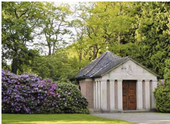
Het mausoleum bij de rododendrons