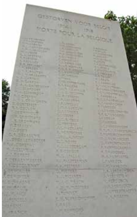
Namen van niet-begraven militairen

Tekst: Antoinette Hofman, student geschiedenis Radboud Universiteit Nijmegen