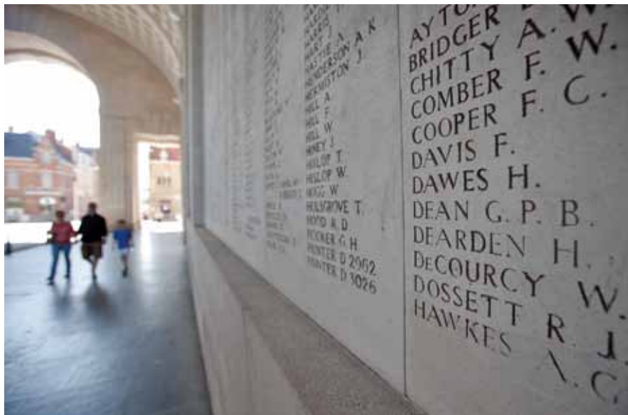
Op de Menenpoort staan de namen van 54.896 vermiste militairen van het Britse Gemenebest