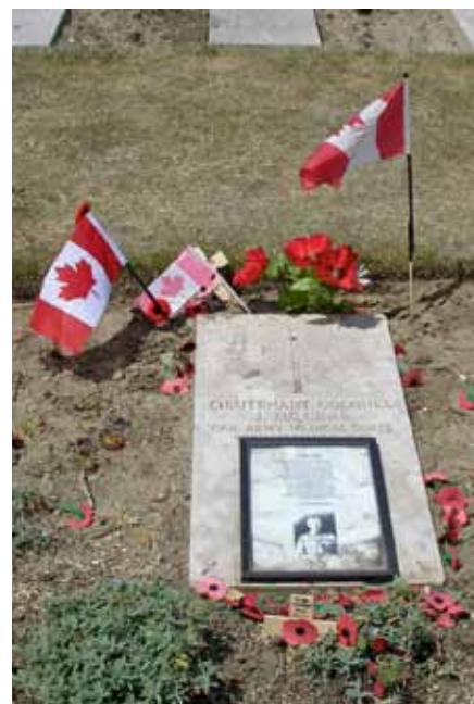
Liggende grafsteen McCrae

McCrae was niet tevreden en gooide het gedicht enige maanden later weg. Een collega zou het gedicht hebben gevonden en naar het tijdschrift Punch hebben gestuurd, dat het in december publiceerde.