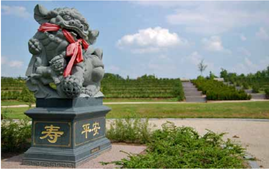
Chinese deel van begraafplaats Kranenburg, Zwolle