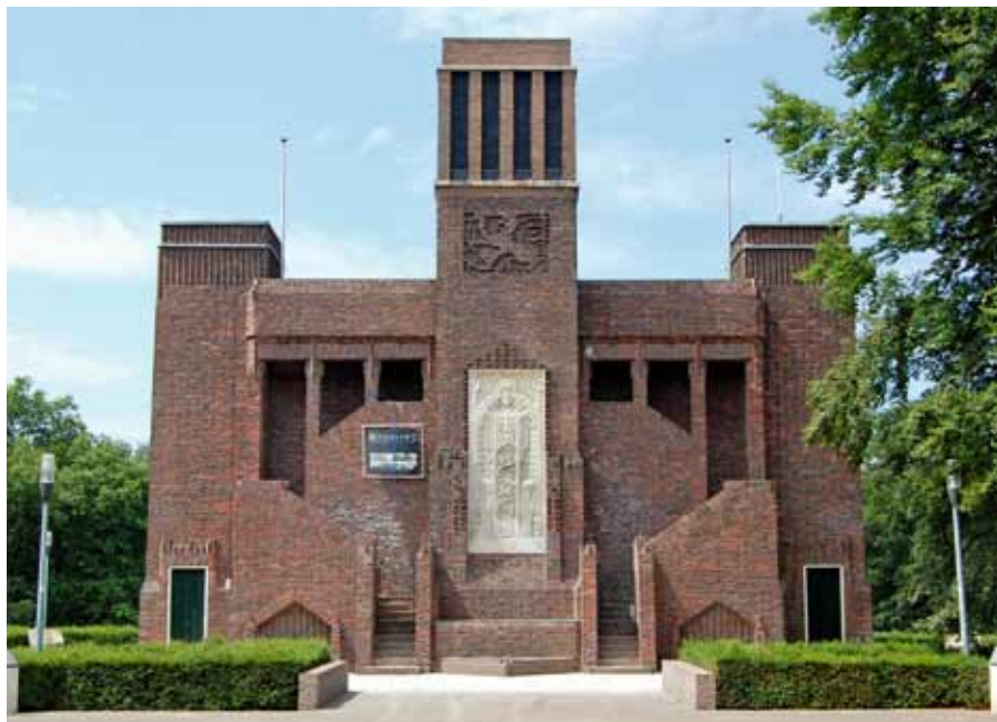
Het Belgenmonument in Amersfoort