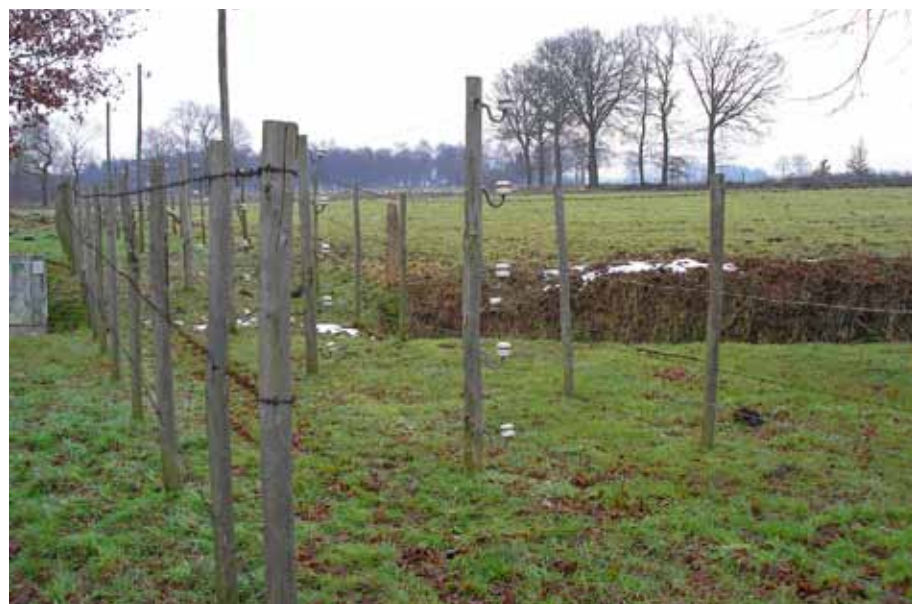
Vredesmonument de Dodendraad bij Zondereigen in België

De meeste slachtoffers waren spionnen, smokkelaars, Duitse deserteurs, Belgische vluchtelingen en onvoorzichtige burgers. Vaak stond er in de krant een bericht over iemand die was doodgebliksemd, oftewel in aanraking was gekomen met de Draad.