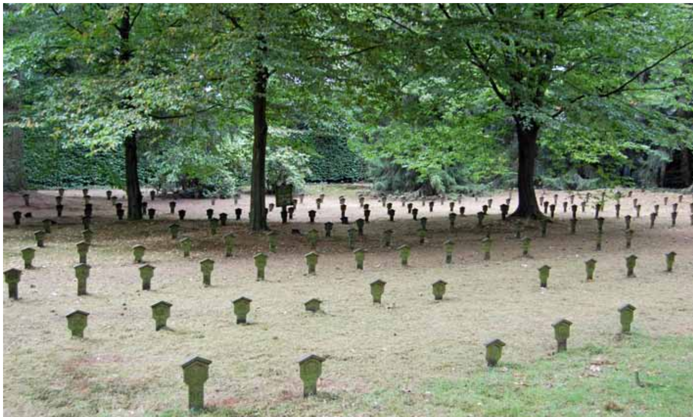
Op dit deel van de Oude Begraafplaats liggen de Belgische vluchtelingen die in vluchtoord Nunspeet zijn overleden