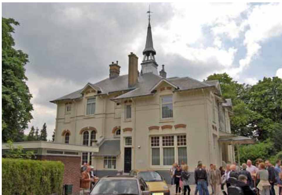
Protest op 1 juni tegen de sluiting van de aula