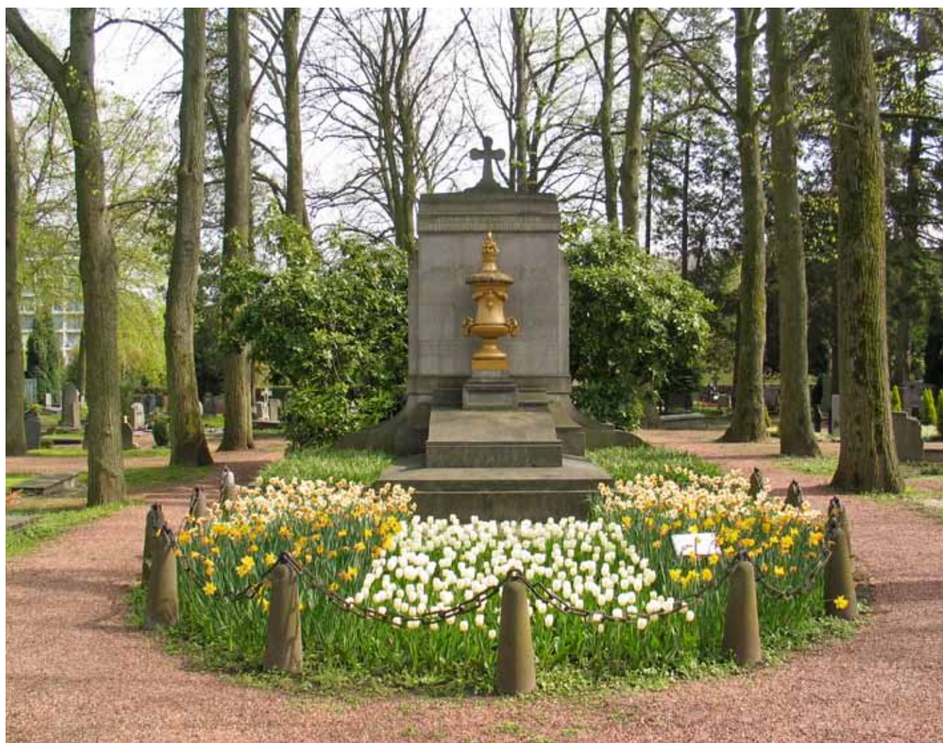
Herdenkingsmonument voor Belgische geïnterneerden op begraafplaats Akerstraat in Heerlen.