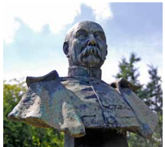
Borstbeeld Thomson aan de Hereweg in Groningen

Koningin Wilhelmina vergeleek Thomson met Michiel de Ruyter en Jan Pieterszoon Coen