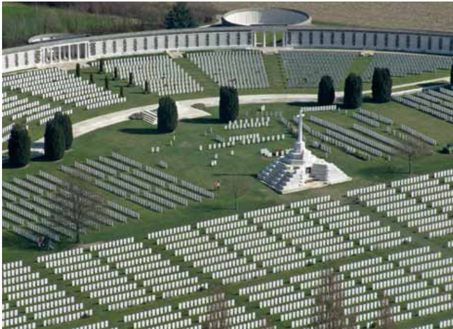
Immense Tyne Cot Cemetery bij Passendale

De Westhoek laat zich omschrijven als een mooi landschap met een wrede geschiedenis. De littekens van 'Den Grooten Oorlog' zijn in het landschap achtergebleven. Hoe vreemd ook, de streek is een nagenoeg ongeschonden stukje Vlaanderen met vriendelijke stadjes en verstilde dorpjes, waar het gulle Vlaamse leven je toelicht.