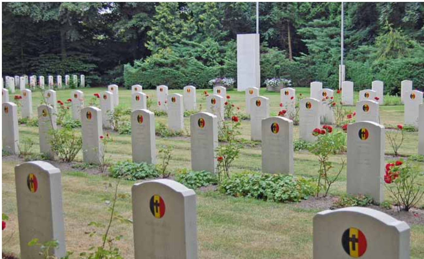
Belgisch militair ereveld