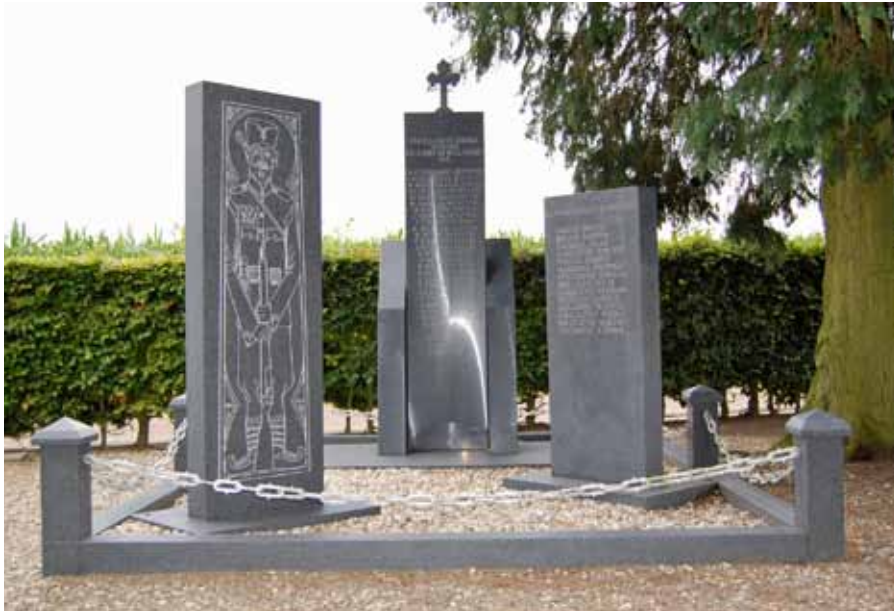
Monument voor Servische militairen in Garderen

In dit nummer staat de Eerste Wereldoorlog centraal. Maar oorlogen brengen altijd andere rampspoed met zich mee. En onheil in de vorm van gebrek, plundering, verkrachting en ziektes treft vooral de burgerbevolking. Zo ook dit keer. In het laatste oorlogsjaar brak de Spaanse Griep uit. Terwijl de oorlogvoerende partijen de Nederlandse neutraliteit respecteerden, stopt een besmettelijke ziekte niet bij de grens. Veel funeraire sporen uit de Eerste Wereldoorlog in Nederland verwijzen daarom naar de Spaanse Griep.