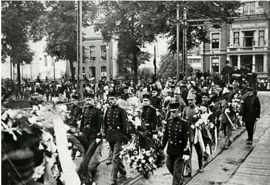
De begrafenisstoet van overste Thomson in de straten van Groningen.

Op 28 juni is in de corridor tussen Eerste en Tweede Kamer een beeld onthuld van overste Thomson. Hij sneuvelde een eeuw geleden in Albanië. Wat deed een Nederlandse militair daar aan de vooravond van de Eerste Wereldoorlog? En waarom wordt hij nog steeds herdacht? Een constructie van wisselende herinneringen.