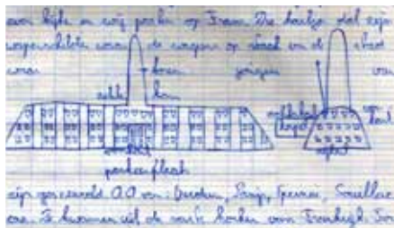
Uit het dagboek

school meer over de oorlog te horen. Nadat Gavrilo Princip op 28 juni 1914 de Oostenrijkse troonopvolger Frans-Ferdinand in Sarajevo had vermoord, raakten als gevolg van bondgenootschappen en mobilisatieschema's onder meer Oostenrijk-Hongarije, Duitsland, Italië en het Ottomaanse rijk in oorlog met Engeland, Frankrijk, Rusland, Servië en de Verenigde Staten. Hoewel ook België neutraal was, had dit land de pech in de aanvalsroutes van het Duitse leger te liggen. Nadat op 11 november 1918 een wapenstilstand overeen was gekomen, slosten de oorlogvoerende naties in 1919 vrede in Versailles.