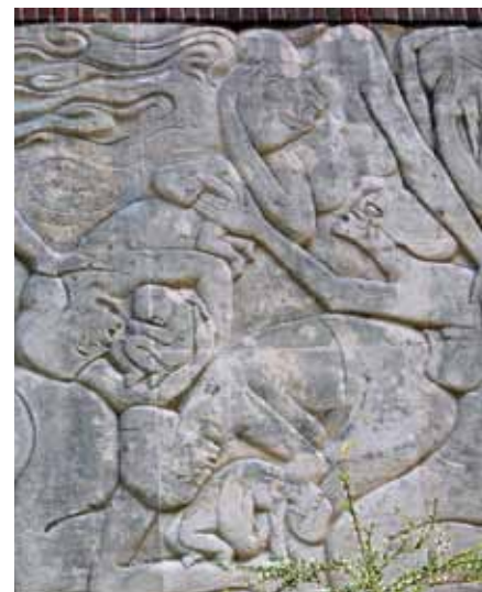
Detail uit het beeldhouwwerk van Hildo Krop