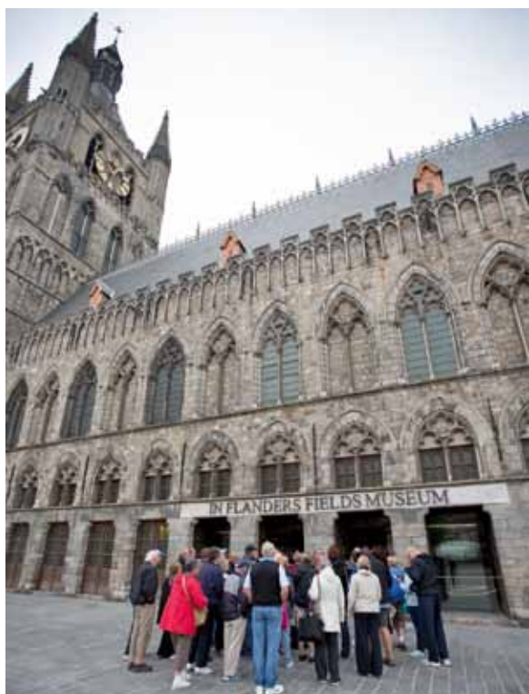
Het In Flanders Field Museum te Ieper

Dit artikel verscheen eerder in de Reisgids, mei/juni 2011