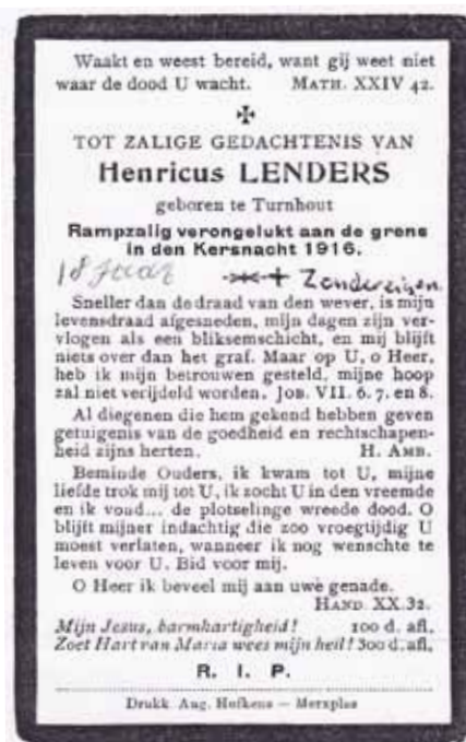
Hij smokkelde documenten.

Schattingen van het aantal door de Draad gedode mensen variëren van enkele honderden tot 850. Onbekendheid met elektriciteit verklaart deels het grote aantal slachtoffers.