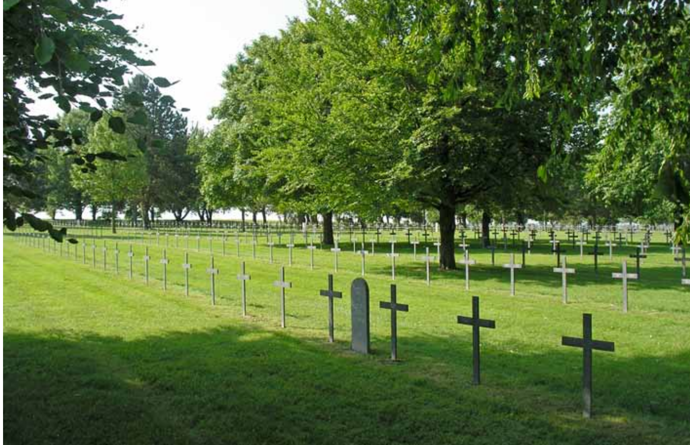
Duitse militaire begraafplaats Maison Blanche