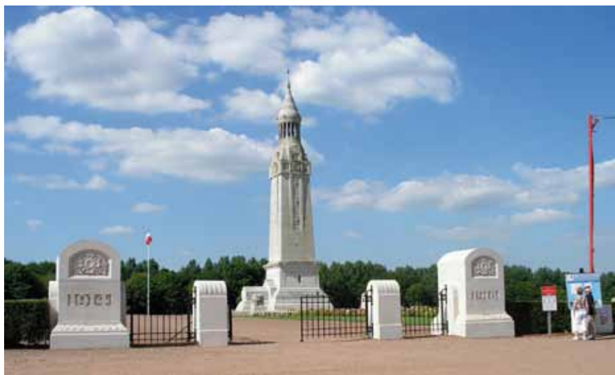
Fransen militaire begraafplaats Notre-Dame-de-Lorette