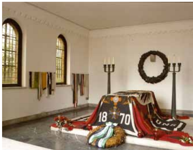
Op de vlag met het adelaarswapen staat de tekst 'Gott mit uns'