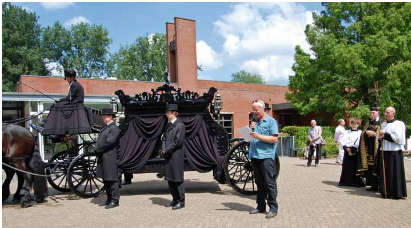
Voorzitter De Terebinth spreekt na aankomst van de rouwkoets