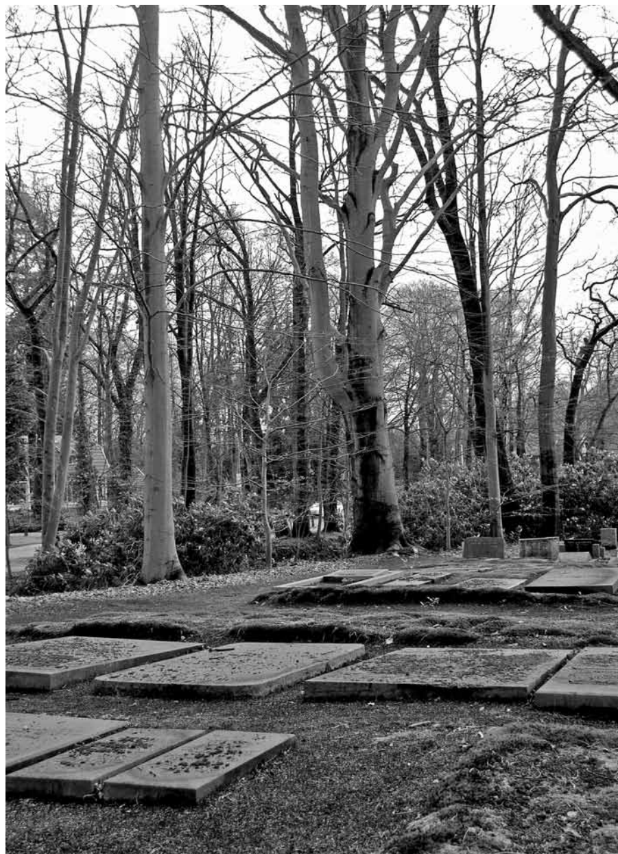
COST BUDDÉ DIEPENVEEN, DE OUDE BEUKEN EN EIKEN ZIJN HOOG OPGESNOEID

Op de familiebegraafplaats Cost Budde in Diepenveen is met name het groen onderhanden genomen en de gracht rond de begraafplaats schoongemaakt. De beuken en eiken rond de kleine, verhoogd gelegen begraafplaats zijn met hulp van een hoogwerker gesnoeid. Een bijzondere begraafplaats in het project is het katholieke Heemkerkhof aan de Assendorperweg in Raalte. Hier is namelijk geen enkel grafteken meer te zien, onder andere als gevolg van jarenlange verwaarlozing in het verleden. Als om het verschil tussen restaureren en 'opknappen' te illustreren staat er een betonnen kruis, in de jaren vijftig van de vorige eeuw bij een opknapbeurt geplaatst ter vervanging van het oorspronkelijke houten kruis met corpus. De werkzaamheden van het RIBO-project vallen hier geheel onder de noemer groenrestauratie. De dodenakker was overwoekerd met opslag. Nadat het project was afgerond is het kerkhof opnieuw ingezegend door de pastoor van de parochie Raalte. Het project is door de veelzijdigheid van de resultaten heel sympathiek. Uiteraard telt het uiteindelijke resultaat. Daarnaast hebben in het restauratievak geïnteresseerde jonge mensen de kans gekregen een opleiding op de werkplek te volgen. Maar een begraafplaats die zoveel mogelijk in oorspronkelijke staat is teruggebracht maar waar niemand komt, is uiteraard niet de bedoeling.