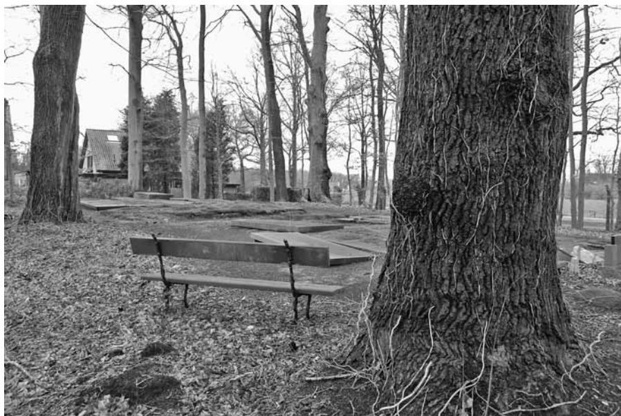
COST BUDDÉ DIEPENVEEN

Tekst: Sytze de Boer (is oud-redacteur van Terebinth en schreef het deel over Zwolle in de reeks Funeraire Cultuur)