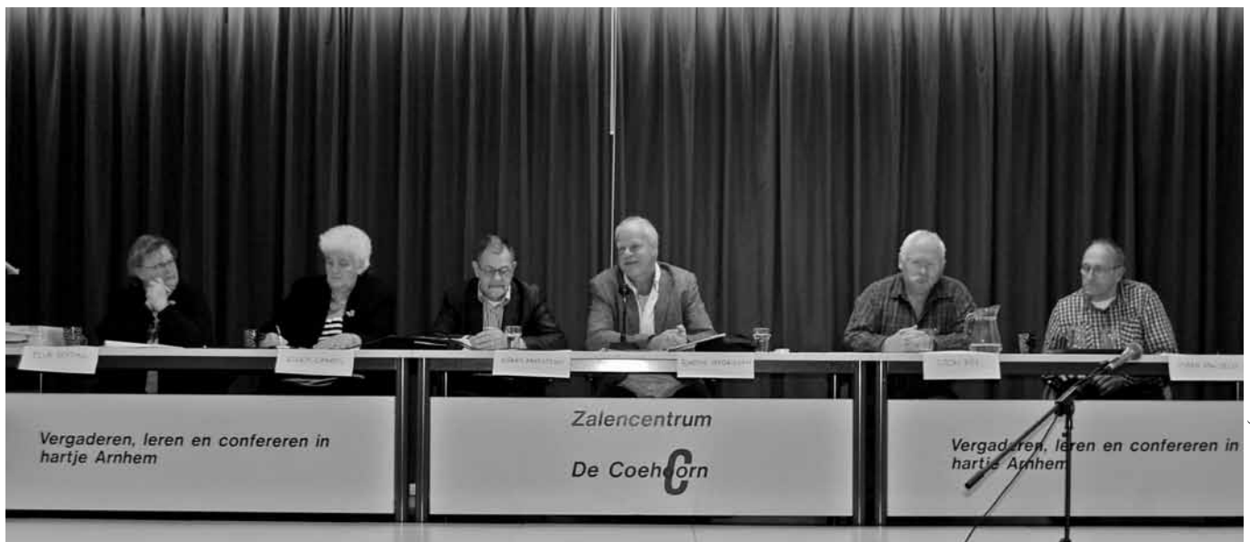
ACHTER DE BESTUURSTAFEL, NOVEMBER 2012

Tekst: Wim Cappers en Joke van der Brug