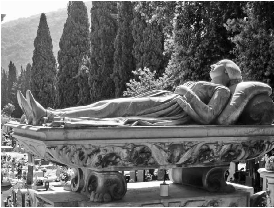
GENUA : IL STAGLIENO

ten, lezingen, workshops en exposities. In Italië deden alleen Rome, Milaan, Lecco en Genua mee. Op het Cimitero Il Staglieno in Genua, volgens velen de mooiste begraafplaats ter wereld, gebeurde het meest: een expositie, een seminar, een concert en dagelijks twee rondleidingen.