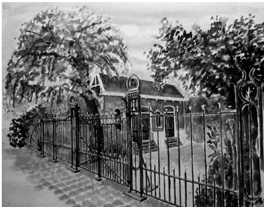
BAARHUISJE RINGDIJK HILLEGERSBERG-SCHIEBROEK 2012. AQUAREL VAN JACK FENS