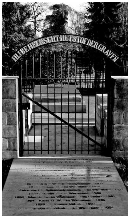
GRAFMONUMENT FAMILIE VAN WASSENAER, BENNEKOM

Van oudsher vonden de doden hun laatste rustplaats in en om de kerk van Bennekom. In 1828 kreeg het dorp een nieuwe begraafplaats aan de rand van het dorp. De ingebruikname vond vermoedelijk plaats in de eerste maanden van 1829. De begraafplaats is eenvoudig van opzet: het kruispad scheidt de beschikbare grond in vier gelijke delen, waarvan één deel is gereserveerd voor eigen graven, de overige delen voor 'inwoners die zich het voorrecht van een eigen graf niet kunne veroorloven'. Aanvankelijk verkreeg de gemeente de grond in erfpacht, maar in 1854 wordt tot aankoop besloten. Een belangrijke plaats wordt ingeruimd voor de grafkelder van de familie Van Wassenaer, de voormalige eigenaren van het landgoed Hoekelum, gelegen tussen Bennekom en Ede.