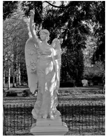
DE ENGEL VAN BENNEKOM