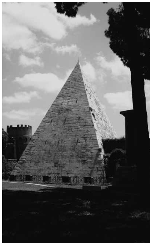
DE PIRAMIDE VAN CAIUS CESTIUS, GEZIEN VANAF DE PARTE ANTICA