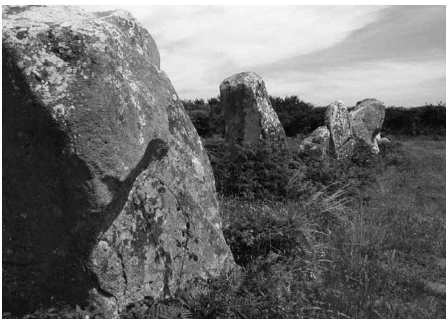
INSPIRENDEN MENHIRS IN FRANKRIJK