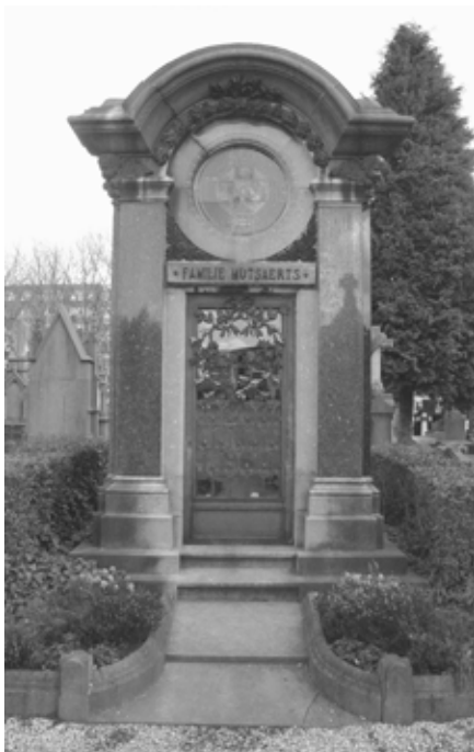
GRAFKAPEL TILBURG, ONTWERPEN DOOR STEENHOEWERIJ SALU UIT BRUSSEL

Vooraf veel grafmonumenten in het zuiden van ons land dragen de signatuur Petit