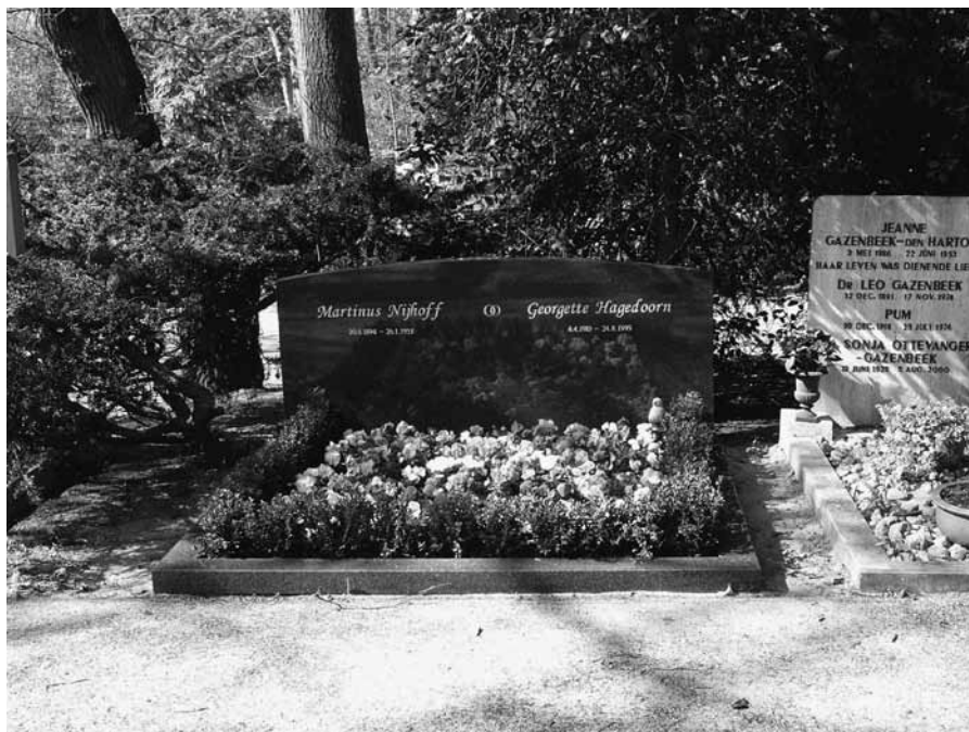
HET GRAF VAN DE DICHTER MARTINUS NIJHOFF EN ZIJN ECHTGENOTE OP DE GEMEENTELIJKE BEGRAAFPLAATS WESTDIJN IN DEN HAAG

Op uitvaartgebied liet de wetgever zoveel mogelijk aan de praktijk over. Er ontstonden tegenstrijdige regelingen. Rechthebbenden waren vaak onbereikbaar. Wetsherziening liet te lang op zich wachten. Toen een grootmoeder op een Bredase begraafplaats gewond werd door een omvallend grafmonument hakte de rechtbank de knoop door. Bij gebrek aan een rechthebbende was de begraafplaats hiervoor als grond-