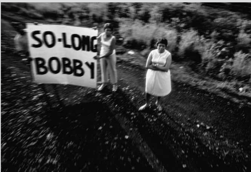
MENSEN LANGS HET SPOOR DIE ROBERT KENNEDY DE LAATSTE EER BEWIJZEN.

Het boek geeft een encyclopedisch overzicht van de militaire begraafplaatsen en andere plekken in binnen- en buitenland waar gesneuvelde Nederlandse militairen begraven liggen. Ook de militaire begraafplaatsen voor buitenlanders in ons land komen aan bod. Het boek telt ook veertien bijlagen.