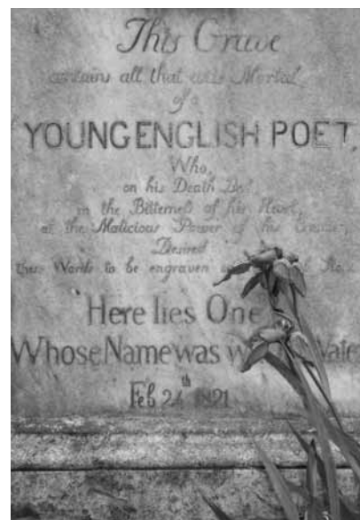
JOHN KEATS, DETAIL

De bezoekersgids is met zijn interessante bijzonderheden, sfeervolle zwart-wit foto's en uitvouwbare plattegrond een funerair verzamelobject op zich