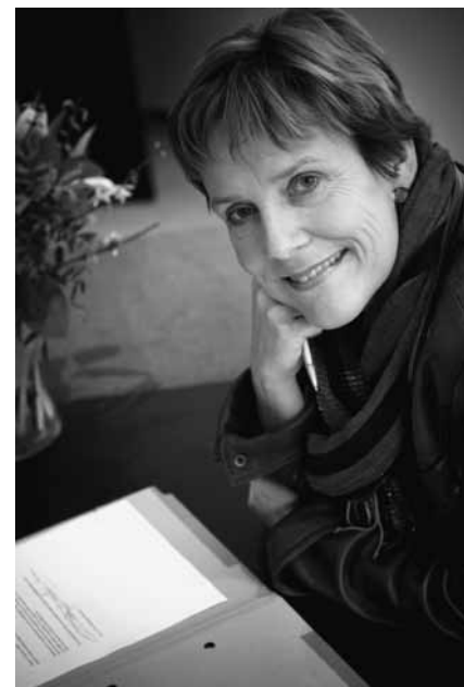
STAATSECRETARIS ANKE BULVELD-SCHOUTEN