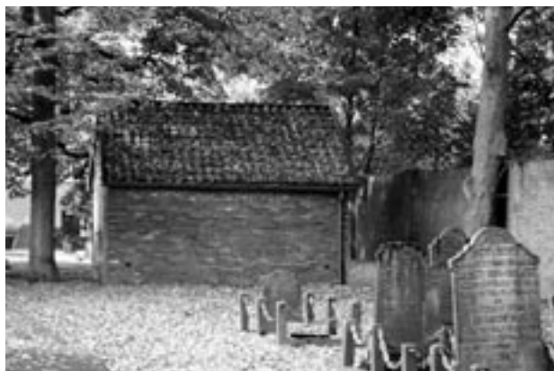
TER NAVOLGING TIEL