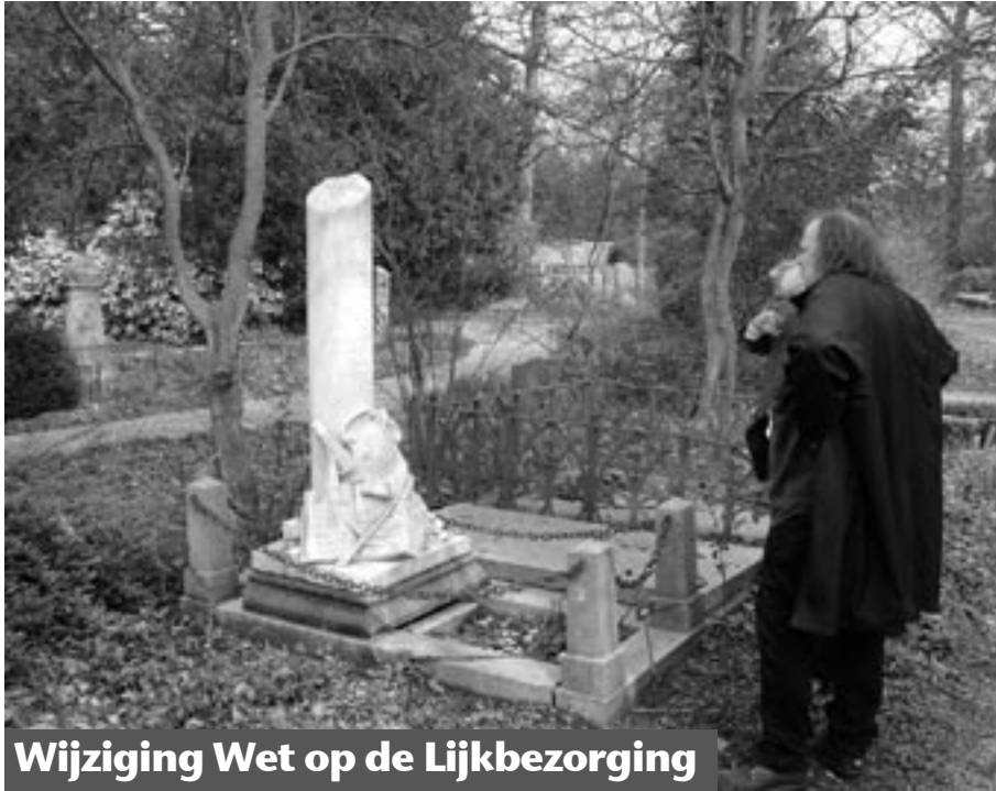
Wijziging Wet op de Lijkbezorging

Na jaren van slepende behandeling kwamen de wijzigingen in de Wet op de Lijkbezorging op 12 juni 2009 in het staatsblad. Op 1 januari 2010 zijn enige wijzigingen in werking getreden. Maar de wet is nog niet af. Mondeling en schriftelijk zijn aanvullingen en reparaties toegezegd. Het is een zorgelijk voorbeeld van ondermaatse wetgeving.