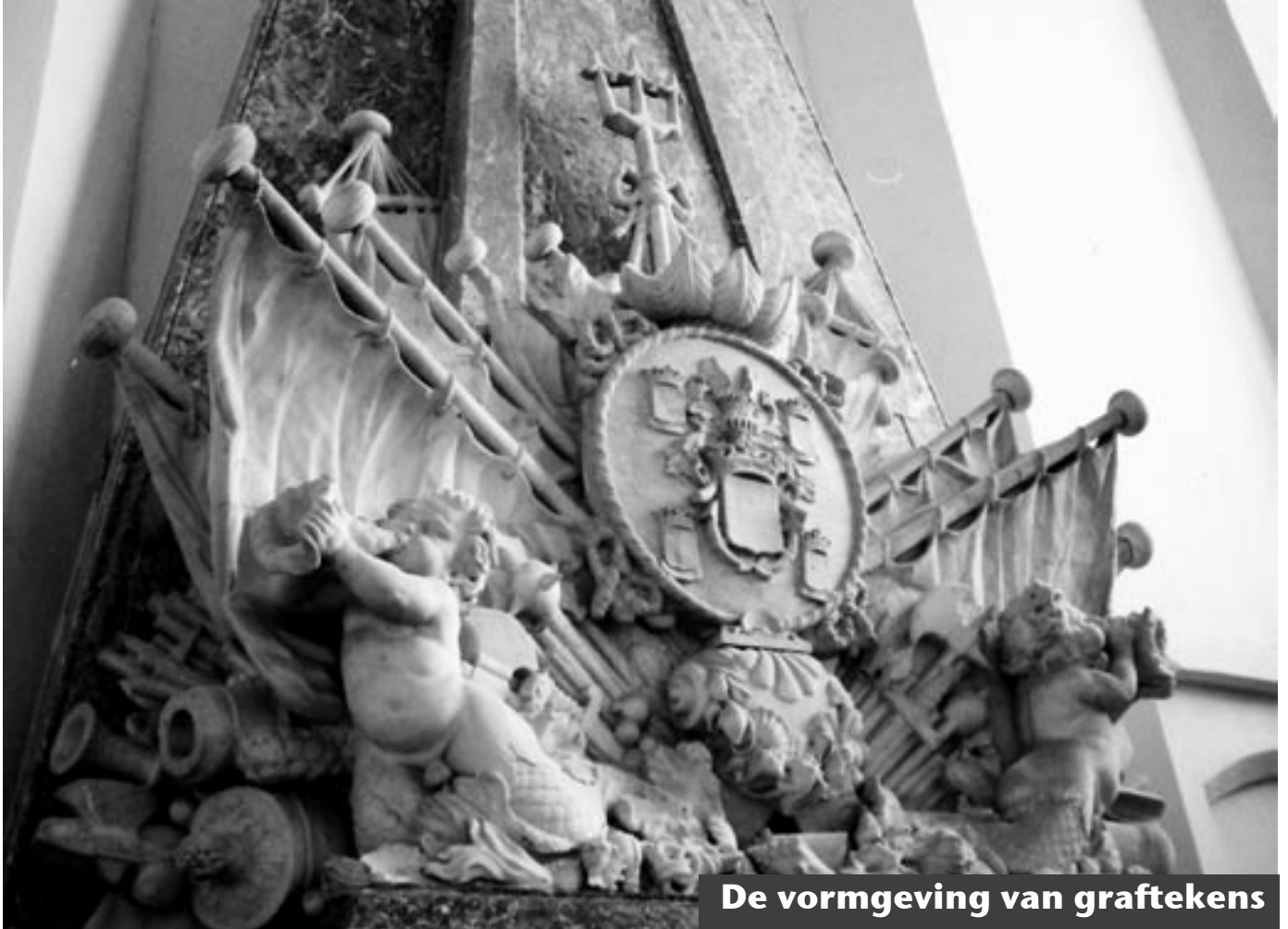
De vormgeving van graftekens