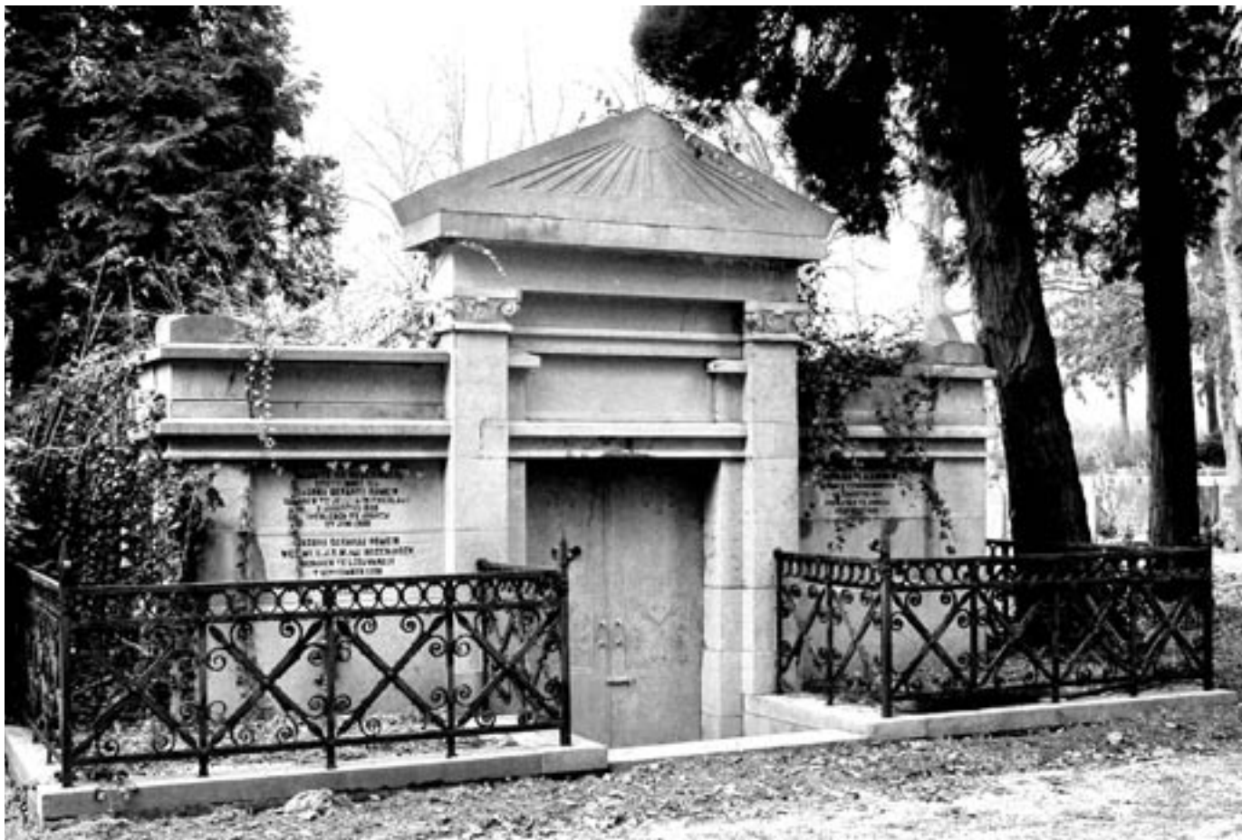
NEOCLASSICISTISCHE OPBOUW GRAFKELDER ROMEIN OP MOSCOWA, ARNHEM

ook. Maar welgestelden lieten hun rijkdom ook graag tot uiting komen op een grafmonument. De vormgeving van veel mausolea en monumentale grafmonumenten uit de 19de eeuw, de eeuw van de neostijlen, was geïnspireerd door de bouwkunst van Grieken, Romeinen en Egyptenaren. In de tweede helft van de 19de eeuw was ook de middeleeuwse gotiek een inspiratiebron, vooral voor grafkapellen en grafmonumenten op rooms-katholieke begraafplaatsen.