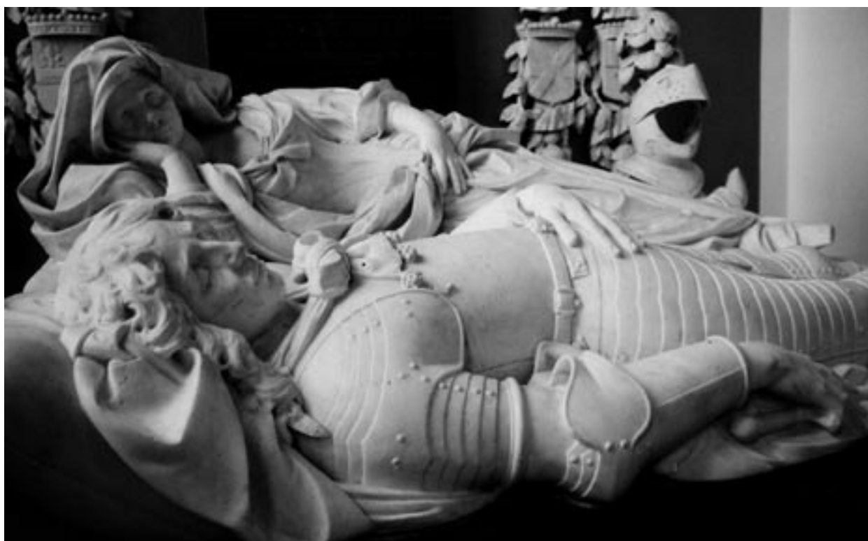
PRAALGRAF WILLEM II BARON VAN LIERE, KATWIJK

de voorgrond staat een 'overheerlijk gebeeldhouwde graftombe' waarop twee figuren liggen: de overleden man is liggend afgebeeld, als een zogenoemde gisant. Achter hem bevindt zich het beeld van zijn toen nog levende echtgenote, leunend op een elleboog. Op de monumenten van zeehelden zijn ook scheeps- en krijgssymbolen uitgebeeld. Zoals in de Geschiedkundige beschrijving der Stad Amsterdam uit 1848 is opgetekend over De Ruyter: 'met den bevelhebberstaf in de rechterhand, rustende de linker op de borst, en het hoofd op een stuk geschut, zijnde aan het hoofd- en voeteneinde een Triton (zeegod) afgebeeld, (...) en boven ziet men een zeegevecht uitgehouwen en de Faam, 's helds roem uitbazuinende.' De praalgraven zijn royaal versierd met putti, engelen en doodssymboliek, bloem- en bladmotieven, banderollen en kwastjes. Maar het was ingetogen vergeleken met de late barok uit de 18de eeuw. Dat is te zien bij het grafmonument voor vlootvoogd Philips van Almonde in de Catharijnekkerk te Brielle. De beeldhouwer is onbekend, het monument is omstreeks 1711-1712 opgericht. Allerlei scheeps- en