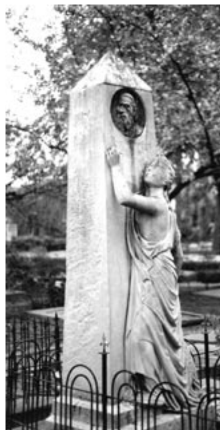
OBELISK HEYBLOM OP CROOSWIJK, ROTTERDAM