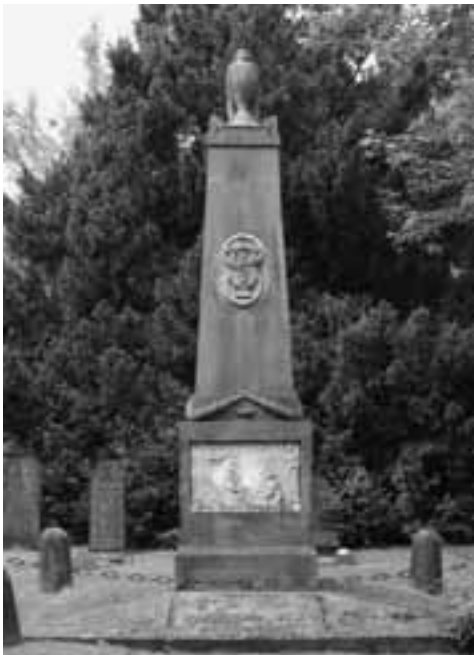
Gedenkzuil met gesluisde urn op de grafkelder van schrijver Rhijnvis Feith op de gemeentelijke begraafplaats aan de Meppelerstraatweg. Hij werd hier in 1825 herbegraven

Deze wandeling verbindt de Grote Kerk, het oudste kerkhof van Zwolle, met Kranenburg, de nieuwste begraafplaats aan de rand van de stad. Toen begraven in de stad verboden werd, moesten de Zwollenaren hun doden naar het 'Nieuwe Kerkhof' aan de Meppelerstraatweg brengen.