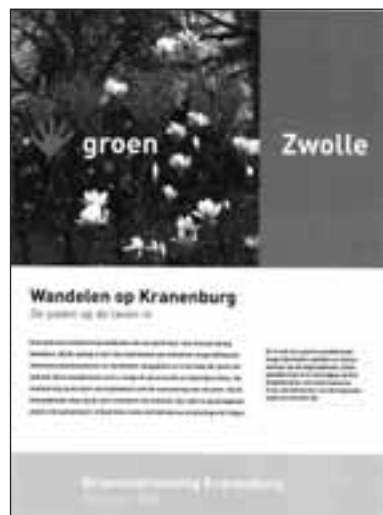
Cover wandelboekje Kranenburg

Via een binnenpad bereiken we Bergklooster, de oudste begraafplaats van Zwolle die nog steeds in gebruik is. Je voelt hier direct een andere sfeer; je betreedt een plek met een lange geschiedenis. De begraafplaats oogt door het ontbreken van grote grafmonumenten en gepolijste stèles sober. Het wekt de indruk van een kerkhof rond een Engels plattelandskerkje. Bij de bouw van het klooster op de Nemelerberg, een rivierduin langs de Vecht, werd ook een kerkhof ingericht. Na de Reformatie werd het 'bergklooster' in 1572 gesloten en negen jaar later afgebroken. Het oude kloosterkerkhof bleef echter in gebruik. De oudste zerk bedekt het graf van Jan Mullert, heer van Kranenburg, en dateert van 1540. De steen ligt op zijn oorspronkelijke plaats in de – nu verdwenen – kloosterkerk. Bij graafwerkzaamheden worden nog regelmatig archeologische vondsten gedaan. Een deel hiervan ligt opgeslagen in de schuur die als klein funerair museum fungeert. Bergklooster is geen natuurbegraafplaats maar wordt wel op een natuurlijke, ecologische wijze beheerd. Op twee oudere grafvelden