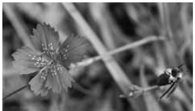
De steenanjer is een zeldzame, beschermde plant die bloeit op Bergklooster en Kranenburg. De oude benaming luidt Zwolse anjer