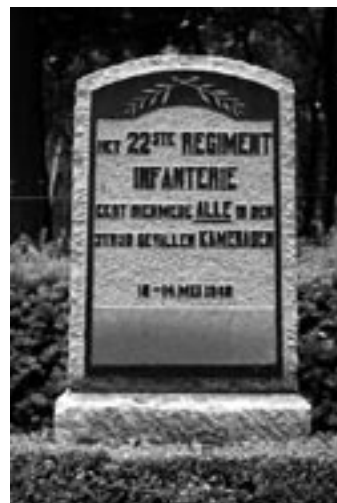
Een gedenkteken voor gesneuvelden op het militaire ereveld Grebbeberg bij Rhenen