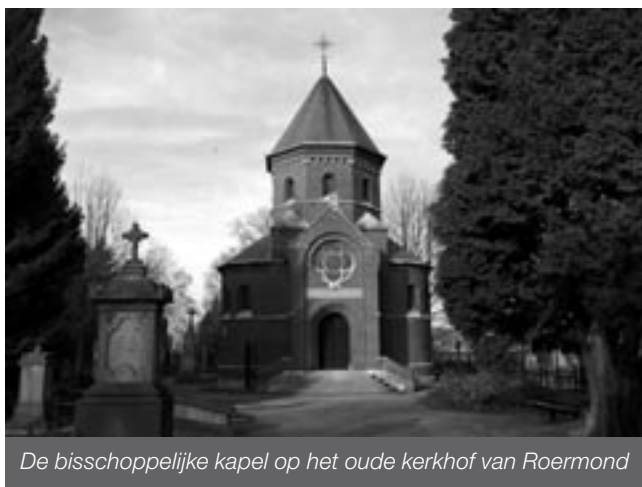
De bisschoppelijke kapel op het oude kerkhof van Roermond

Ter afsluiting nog het volgende. Er zijn (voormalige) kerkelijke begraafplaatsen die binnen een verwoeste of afgebroken kerk liggen. Ook kan een oude toren van een verwoeste kerk op een begraafplaats staan. Allerlei foto's zijn denkbaar die passen binnen de bovengenoemde criteria. Zorg er echter voor dat het funerair én het religieuze aspect van het gefotografeerde object voor de kijker duidelijk is.