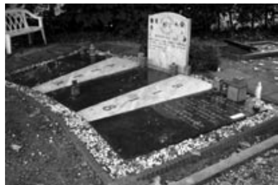
Het broederschapsgraf van de Hells Angels

Doorlopend naar de linker achterkant passeren we het 'broederschapsgraf' van de Hells Angels, met een gezels-