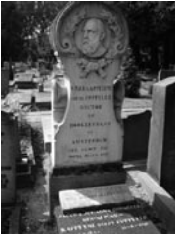
Het monument van Kappelijne van de Coppello

lig plastic tuinbankje, bloemen en een Mariabeeldje. Verderop aan de rechterhand staat een aantal joodse graven. Van oudsher is Rustoord een gemengde begraafplaats, al vanaf het begin van de 19de eeuw werden hier katholieken begraven. In deze periode kochten veel Amsterdamse notabelen een (familie-)graf op Rustoord en kende de begraafplaats een periode van relatieve bloei. Toch kreeg de dodenakker nooit steun van de stad Amsterdam, eerder werkte men de begraafplaats tegen: die was te ver en te duur, zo luidde het. Pogingen van de beheerders om de gemeente Amsterdam of Diemen de begraafplaats over te laten nemen, strandden diverse malen, tot op de dag van vandaag.