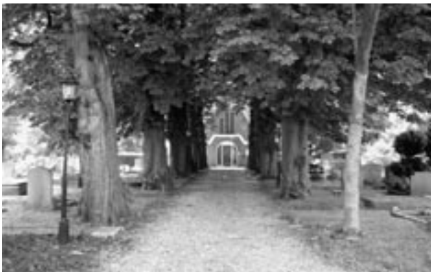
De laan met kastanjes naar de aula

Het is zo'n begraafplaats waar je zomaar voorbij rijdt of fietst. De bedrijvigheid om Rustoord in Diemen vraagt meer aandacht dan de doden die hier soms eeuwen geleden aan de aarde toevertrouwd zijn. Een drukke weg, spoorlijnen, een verhuisbedrijf pal naast het terrein (!), alleen de Weespertrekvaart, parallel aan de weg, stroomt rustig voort. Wie zich even in Rustoord verdiept, krijgt zowat medelijden met deze dodenakker die haar tijd vooruit was en misschien wel daarom nooit door magistraten en lokale overheden werd omarmd en beschermd. Een wandeling over een verweesde begraafplaats.