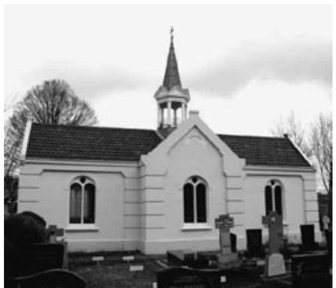
Neoromaanse begraafplaatskapel, Oudenbosch

De oudste begraafplaatskapellen die Zuid-Nederland nu kent, dateren uit de eerste helft van de 19 de eeuw. Er moet al een kapelletje hebben gestaan op de kleine rooms-katholieke begraafplaats, de voorloper van de huidige dodenakker op de Cauberg te Valkenburg aan de Geul. Het gebouw kreeg zijn huidige vorm ten tijde van de uitbreiding van deze begraafplaats in 1836, noodzakelijk geworden omdat het kerkhof rondom de Nicolaaskerk