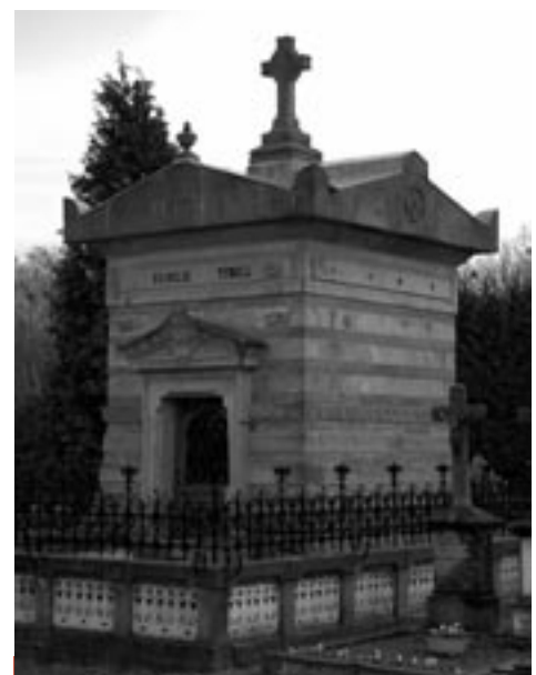
Neoclassicistische grafkapel, Vaals

Veel meer over funeraire bouwkunst is te lezen in Bouwen op de Grens . Deel Zuid. Gids voor de funeraire architectuur in Nederland. Verwacht in juni 2008.