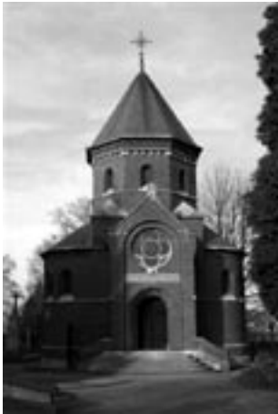
Op 'd'n 'Aje Kirkhoaf' te Roermond staat de Bisschoppelijke Grafkapel. De kapel is in 1887 door architect Pierre Cuypers ontworpen. Zijn grafkelder ligt achter de kapel