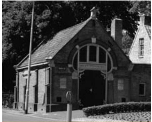
Jugendstil metaheerhuis, Middelburg