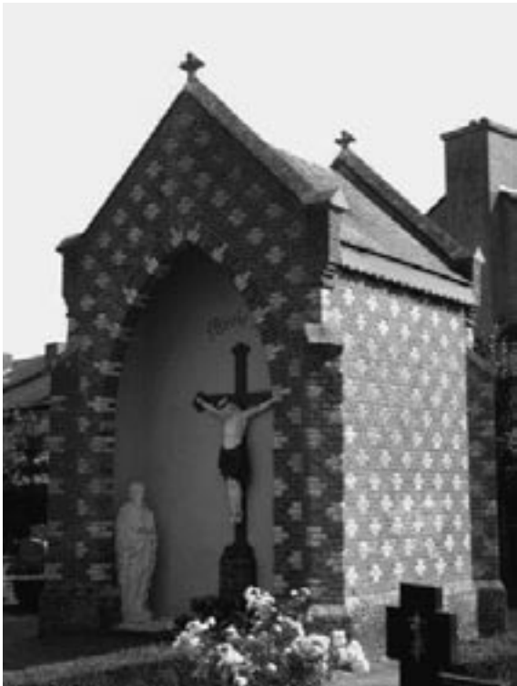
Neogotische begraafplaatskapel, Heesch

Het is verheugend dat in dit jaar van het religieus erfgoed de blik ook is gericht op begraafplaatsen. Luidt de noodklok voor gebouwen die zowel tot het funeraire als het religieuze erfgoed behoren? Een beknopte verkenning van begraafplaatskapellen, grafkapellen en metaheerhuizen in Zuid-Nederland.