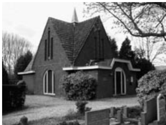
De aula uit 1935