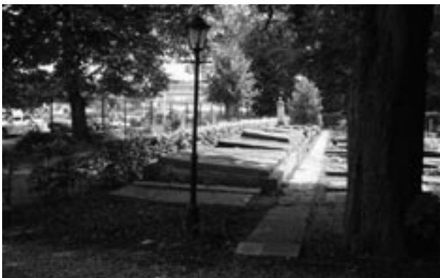
Oude graven als een zerkenvloer, achterin het monument van de familie Suasso-De Bruijn

Het is niet vaak meer dat het prachtige smeedijzeren hek aan de Weesperstraat voor een begrafenis open zwaait: zo'n 35 keer per jaar. Vooral onder moslims uit het nabij gelegen Amsterdam-Zuidoost is Rustoord populair. Vele anderen geven onder meer de voorkeur aan De Nieuwe Ooster. Helemaal rechts van de ingang staat de voormalige beheerderswoning uit 1948, een voorbeeld van een gebouw uit de Delftse School. Het huis is door de vorige eigenaar verkocht en hoort niet meer bij Rustoord. Om de paar maanden wordt de groenvoorziening bijgehouden. De Stichting Crematoria en Begraafplaatsen in Best heeft het groenbeheer uitbesteed. Afhankelijk van het tijdstip van je bezoek, is er net gesnoeid of ziet alles er overwoekerd uit.