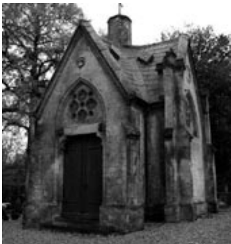
Neogotische grafkapel, Mheer

Een direct gevaar voor de teloorgang van begraafplaatskapellen is er niet. Er bestaat nog steeds, of weer, behoefte aan een kapel op begraafplaatsen. De nieuwe kapel Heilige Maria der Engelen op de rooms-katholieke begraafplaats te Rotterdam dateert uit 2001. En in het Limburgse Pey verbouwden vrijwilligers drie jaar geleden het schuurtje op de begraafplaats van de parochie O.L. Vrouw Onbevlekt Ontvangen tot Mariakapel.