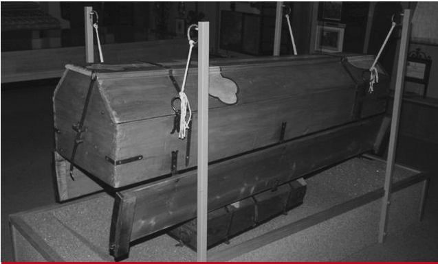
De klapkest uit het Bestattungsmuseum in Wenen