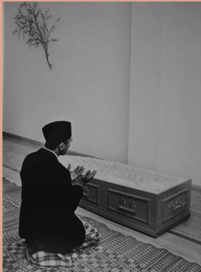
Traditionele Javaanse moslim reciteert smeekbede voor een overledene

Dat project heeft inclusief onderzoek en schrijven zeven jaar in beslag genomen. Het onderwerp bleek binnen sommige culturen moeilijk toegankelijk. Bij Chinezen was spreken over de dood zelfs taboe. Orthodoxe moslims staan de afbeelding van een overledene niet toe. Het verbod foto's te maken, kwam ik ook bij orthodoxe protestanten en joden tegen. Pakistani en Javanen waren bereidwillig mee te werken omdat zij het belang van mijn werk voor hun kinderen inzagen. Kaapverdianen en Surinaamse Hindoestanen maakten altijd al foto's en video's van de uitvaart voor familieleden over zee. Door opvallende aids-begrafnissen en de vliegtuigramp in de Bijlmer werden uitvaarten steeds persoonlijker. Ik denk dat mijn boek in 1998 zichtbaar maakte hoe anderen het doen.