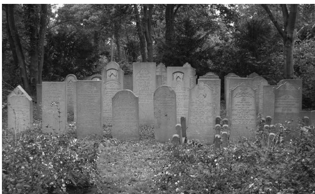
Op dit beschutte plekje op Duinrust in Beverwijk zijn joodse overledenen in de jaren vijftig herbegraven