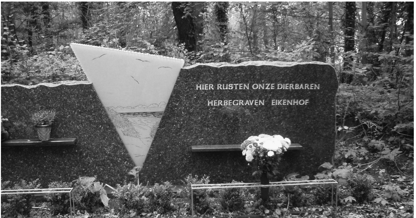
Achter dit kunstwerk op begraafplaats Eikenhof in Heemskerk ligt onder de heuvel een moderne knekelput