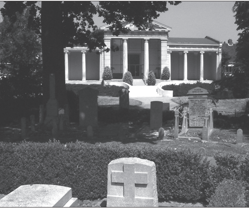
Mausoleum op de begraafplaats aan de Kleverlaan te Haarlem.