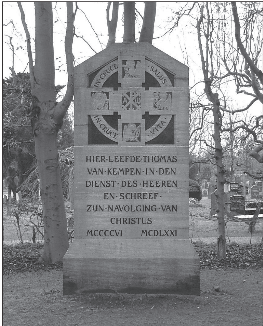
Gedenksteen Thomas a Kempis.

Aangezien ook de nieuwe St. Michaëlskerk na ongeveer veertig jaar wordt onttrokken aan de eredienst, moet Thomas weer verhuizen. Om zijn betekenis te eren is een programma opgezet rondom de verplaatsing van zijn relieken. Na het vertrek uit de kerk is hij in een open auto naar begraafplaats Bergklooster gereden. De stichting Thomas a Kempis, een oecumenische organisatie die zich ten doel stelt belangstelling te wekken voor diens spirituele erfgoed, had een ontmoeting georganiseerd voor de gedenksteen bij de zij ingang van Bergklooster. De relieken werden op een kinderbaar voor de gedenksteen geplaatst. Teksten uit de Imitatio Christi werden in diverse talen voorgedragen door studenten van de Theologische Universiteit Kampen en een theoloog sprak over de tegenwoordige betekenis van Thomas werk. Uit de Agnietenbergkroniek werd de passage voorgelezen over het sterven van Thomas. Het was een bijzondere beleving voor ondergetekende om als beheerder van de begraafplaats en hoeder van de oude kloosterplaats even het gebeente van Thomas op de oude plek terug te hebben. De gedachte speelde door het hoofd om een einde