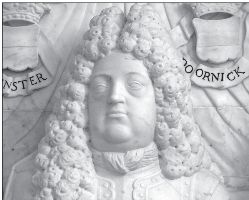
Buste van een grafmonument in de St. Nicolaaskerk te Wijhe.