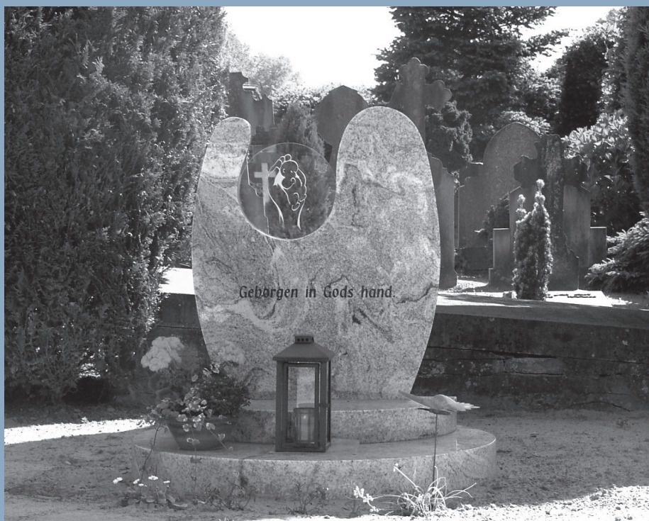
Kindermonument ingezegend in april 2006 op de katholieke begraafplaats te Wijhe.

Tot onze spijt is de foto van J. Hattinga Verschure in het juninummer aan de verkeerde maker toegeschreven. De fotograaf is Femke Woltring uit Landsmeer.