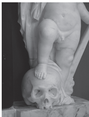
Putto in St. Nicolaaskerk te Wijhe.