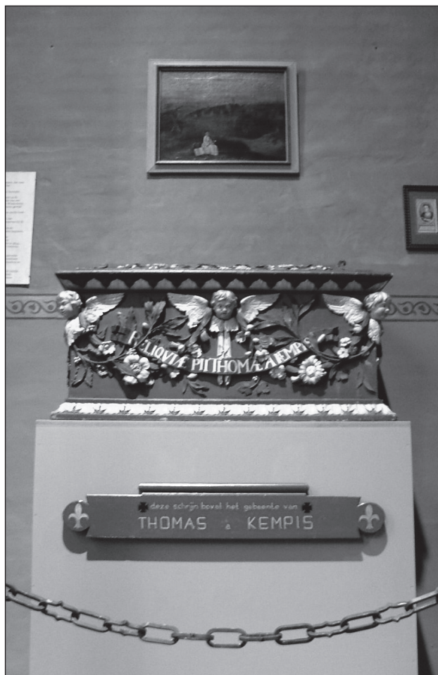
Schrijn Thomas a Kempis.

Thomas a Kempis was in de 15 de eeuw een van de belangrijkste vertegenwoordigers van de vernieuwingsbeweging de Moderne Devotie. Deze spirituele beweging wilde herstel van het persoonlijke en gemeenschappelijke leven in kerk en maatschappij, dat sterk veruiterlijkt was. Thomas van Kempen, in 1379 of 1380 geboren in het Duitse Kempen onder de naam Thomas Hemerken, kwam op twaalfjarige leeftijd naar de Nederlanden en nam uiteindelijk zijn intrek in 1399 in het klooster op de Agnietenberg te Zwolle. Thomas werd vooral beroemd door zijn Imitatio Christi , Het werd in vele talen vertaald. In het Nederlands ging het Over de navolging van Christus heten. Het zou na de Bijbel het meest gelezen boek ter wereld worden. Op 25 juli 1471, de feestdag van St. Jacobus, stierf hij op 91-jarige leeftijd en werd hij op een diepte van tien voet ofwel drie meter in een met leem bestreken kist begraven in de oostelijke kruisgang, tegen de muur van de kloosterkerk. In 1672, toen Frankrijk, Engeland, Munster en Keulen de Republiek binnenvielen, hadden de Duitse bisschoppen speciale belangstelling voor het katholieke volksdeel in de officieel protestantse Lage Landen. Zo gaf aartsbisschop Maximiliaan Hendrik