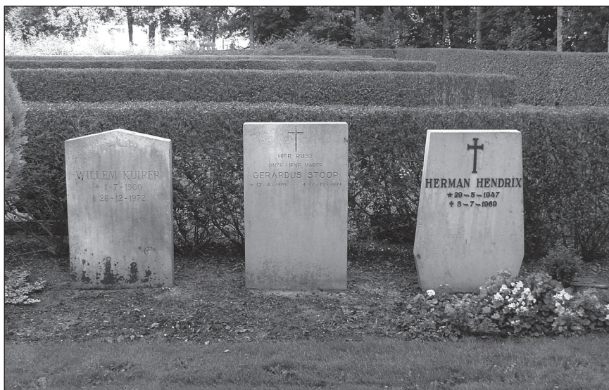
Voorgescreven modellen sinds de jaren vijftig.

Er zijn maar weinig graven uit die eerste jaren, ongeveer tachtig liggen er uit de eerste tien jaar. Hier zijn vooral levenloos geboren en kinderen begraven. Het eerste graf stamt uit 1947 en is inderdaad van een kind. Verder valt op dat kinderen en volwassenen hier door elkaar liggen. Achter het oudste deel liggen de vak-