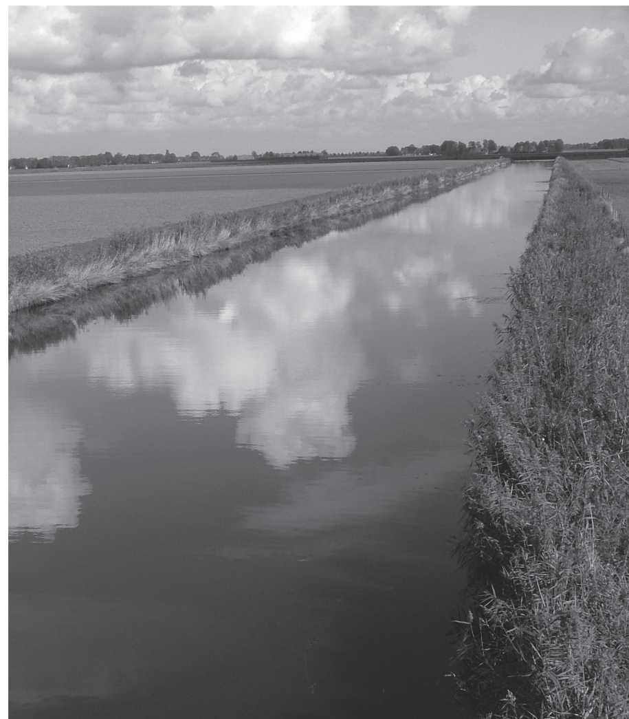
Rechtlijnig ontwerp in de Noordoostpolder.

Het landschap van Flevoland is bijna helemaal bedacht en door mensenhand gevormd. Ook over wie waar moet gaan wonen is veel nagedacht. De Noordoostpolder, aangelegd in de jaren veertig van de vorige eeuw, is hét voorbeeld van dat ideaal van de maakbare samenleving. De begraafplaatsen in de polder laten echter zien dat het met die maakbaarheid wel meevalt. Dit artikel is gebaseerd op het boekje Flevoland & Lelystad in de reeks Funeraire Cultuur van de Terebinth.