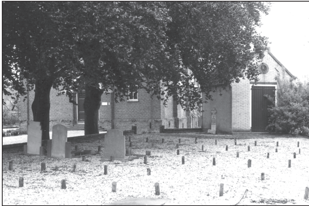
Nummerpaaltjes kerkhof Reeuwijk-Dorp

Dat veel Nederlanders op een begraafplaats van hun eigen 'zuil' begraven willen worden, blijkt vooral in de Zuid-Hollandse Bollenstreek. Je vindt er rooms-katholieke, hervormde, gereformeerde en joodse begraafplaatsen, terwijl op andere dodenakkers gedeeltes zijn ingericht voor groepen als jansenisten of instanties als het Groot-Seminarie - beide in Warmond. Op den duur zal de ontzuiling wel op de begraafplaatsen in de Bollenstreek doordringen. Maar anderzijds is het heel goed mogelijk dat de tendens om op gemeentelijke begraafplaatsen voor bepaalde groepen aparte vakken in te richten terrein zal winnen. Een aparte begraafplaats voor hoogleraren van de Universiteit Leiden is er niet. Hun graven liggen over de hele regio verspreid. Tot pakweg 1829 waren hun grafmonumenten vaak voorzien van loftuitingen. Zoals in de Pieterskerk te Leiden de lofzang op Heurnius die 'een man van grote wijsheid en van opperste schoonheid en befaamdheid in zijn onderricht en publicaties' wordt genoemd. Na 1829 verminderde het aantal loftuitingen op grafstenen geleidelijk om uiteindelijk vrijwel geheel te verdwijnen. Eerst beperkte men zich tot de vermelding 'hoogleraar' al dan niet met toevoeging van de faculteit, later bleef zelfs