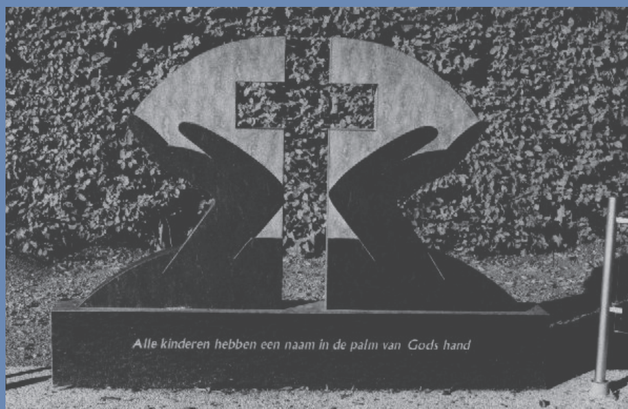
Foto kindermonument rooms Katholieke begraafplaats Raalte