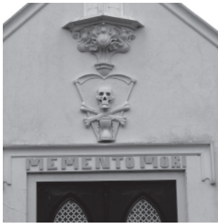
Detail van foto voorpagina, baarhuisje Genemuiden