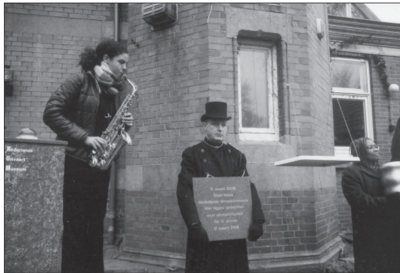
Opening van het NUM