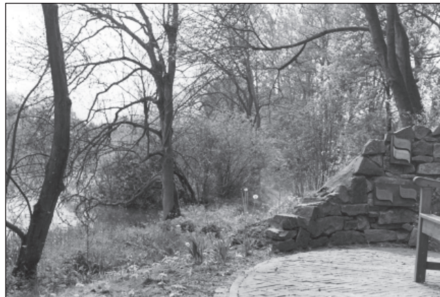
Gedenkplek IJsselhof Gouda

Een provincie bekijken door de bril van haar begraafplaatsen is een ongebruikelijke, maar boeiende opdracht. Een verslag van de tocht langs bijna alle dodenakkers in Zuid-Holland is opgetekend in twaalf deeltjes van de funeraire reeks. Kortgeleden zijn de beide laatste delen Regio Den Haag en Rijnstreek verschenen. Een impressie in vogelvucht.