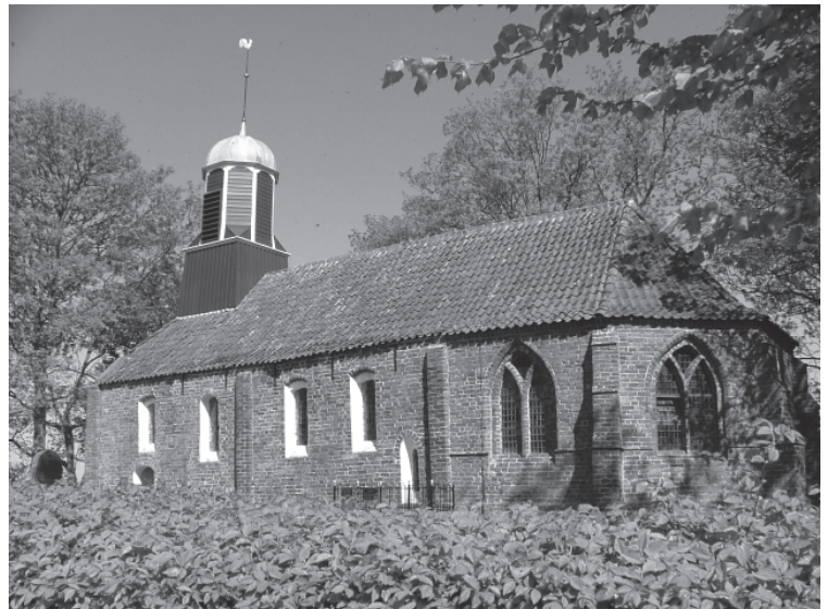
Kerk te Fransum