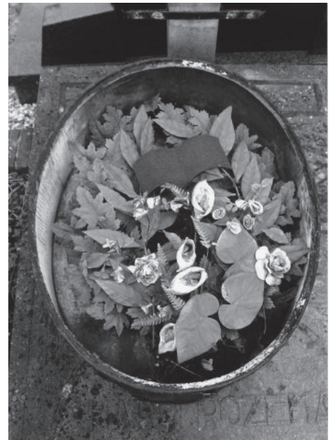
Graftrommel begraafplaats Loppersum.