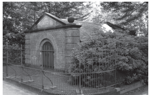
Grafkelder van de familie Van der Borch te Vorden

Wie mogelijk meer informatie heeft over dit onderwerp kan die zenden aan labbok@hotmail.com .