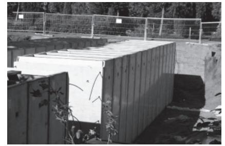
De toekomst: begraven in betonnen bakken?

Afgesloten werd met een bezoek aan de Nieuwe Ooster. Deze begraafplaats is van de hand van Springer en veel ruimer opgevat dan Zorgvlied. Allereerst brachten we een bezoek aan het crematorium. Wat voor ons wat eigenaardig overkomt is de verplichting om de urne een aantal maanden te bewaren vooraleer de nabestaanden mogen beslissen wat er mee aan te vangen. Dit heeft na-