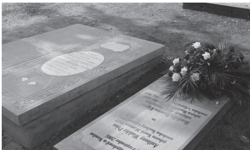
Grafzerk familie Winkler Prins

Hoe legt men komende generaties uit, dat in Nederland van ongeveer 1965 tot 1995 geen belang werd gehecht aan de graven van cultuurdragers of aan geschiedenis in het algemeen? Vanwege het Heilig Graf in Jerusalem zijn kruistochten gevoerd. De Sint Pieterskerk in Rome dankt zijn belang vooral aan het graf van Petrus en anderen. Oude geschiedenissen? In 1997 werd in Tenkitten bij Fischhausen het negen meter hoge Adalbertkreuz weer opgericht, omdat duizend jaar daarvoor Adalbert van Praag als martelaar stierf. Het kruis uit 1831 was in 1945 verwoest. Adalberts graf ligt