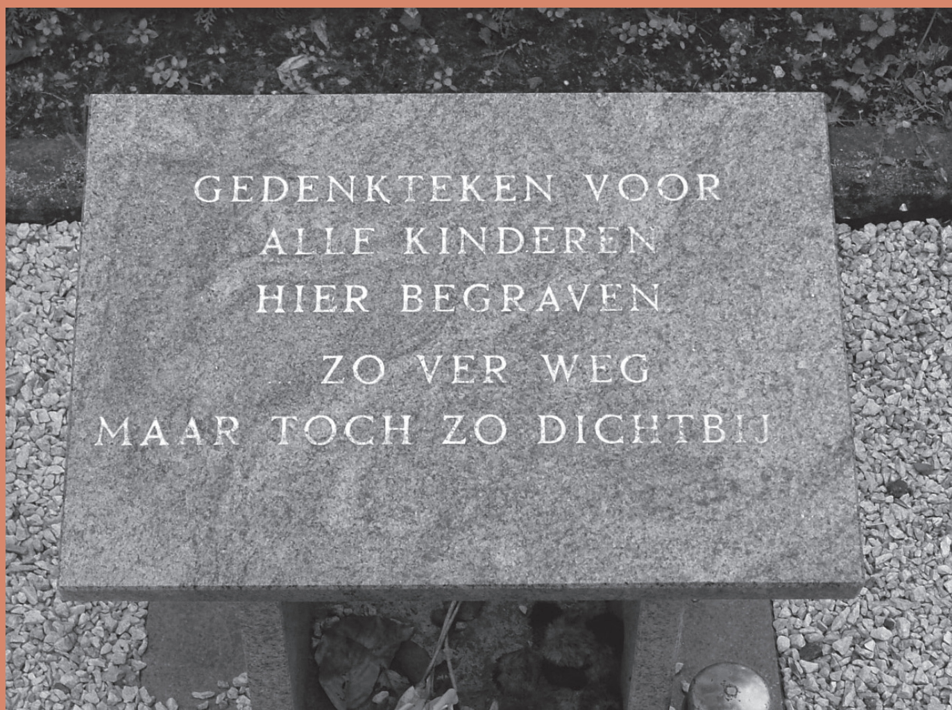
Monument voor levenloos geboren kinderen op de rooms katholieke begraafplaats Nieuw Heeten