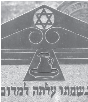
Excursie Terebinth Synagoge en Joodse begraafplaats