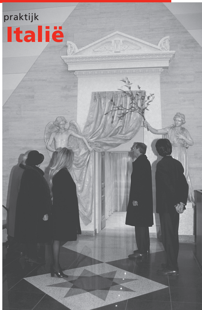
Aula van crematorium van Turijn. Bij het afscheid wordt het karretje met de kist tussen de beelden door de ovenruimte ingerold.

In de jaren negentig van de 20 ste eeuw zijn er door verschillende personen en instellingen in Nederland inspanningen verricht om onderwijs, onderzoek en voorlichting ten behoeve van de uitvaartbranche op elkaar af te stemmen. Er zijn diverse voorstellen gedaan om verenigingen en stichtingen samen te voegen of tenminste inhoudelijk te laten samenwerken. Hoezeer de efficiëntie en rendabiliteit van een dergelijke bundeling van krachten ook kon worden aangetoond en door gezaghebbende vertegenwoordigers uit het veld werd erkend, tot op heden zijn de meeste inspanningen in dit kader vruchteloos gebleven. De inhoudelijke ondersteuning van de uitvaartbranche in Nederland wordt nog steeds gekenmerkt door een bonte lappendeken van verenigingen, stichtingen en freelancers, die ieder hun eigen spoor trekken en elkaar soms zelfs in de wielen rijden. Zonder de pretentie te hebben om voor de ontstane situatie een oplossing te bieden, wil ik met het onderstaande artikel de ontstaansgeschiedenis van een Italiaanse instelling schetsen, die er inmiddels al jarenlang in slaagt om op hoog niveau onderwijs, onderzoek en voorlichting ten behoeve van de uitvaartbranche te bundelen. Een kijkje over de grens kan soms inspireren en zo bijdragen tot de realisering van de idealen die in eigen kring leven.