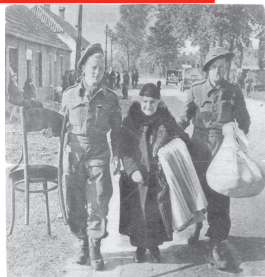
THE OLD LADY was driven out of her home in the Dutch village of Best when it became a battle ground. Two soldiers help her salvage bed clothes and a chair.