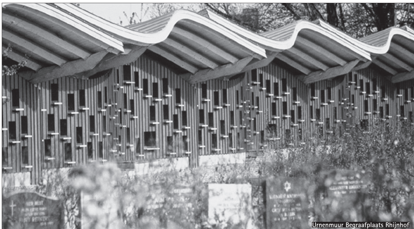
Urnenmuur Begraafplaats Rhijnhof