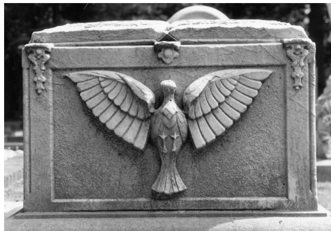
foto duif op opengeslagen bijbel - kerkhof Veendam

In het bestuur zal ik mij gaan toeleggen op de PR taken. Samen gaan we daar nog een nadere invulling aan geven.