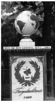
reis om de aardbol, kerkhof Veendam