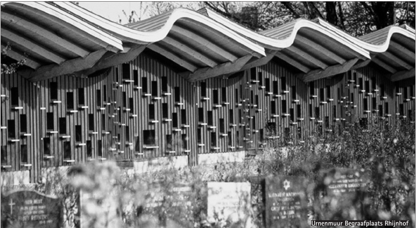
Urnenmuur Begraafplaats Rhijnhof