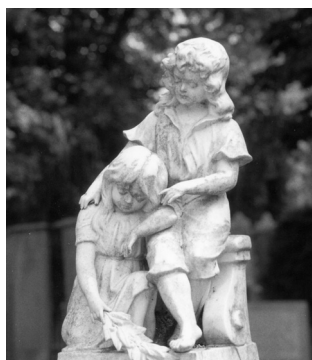
Treurend meisje met jongentje, kerkhof Veendam