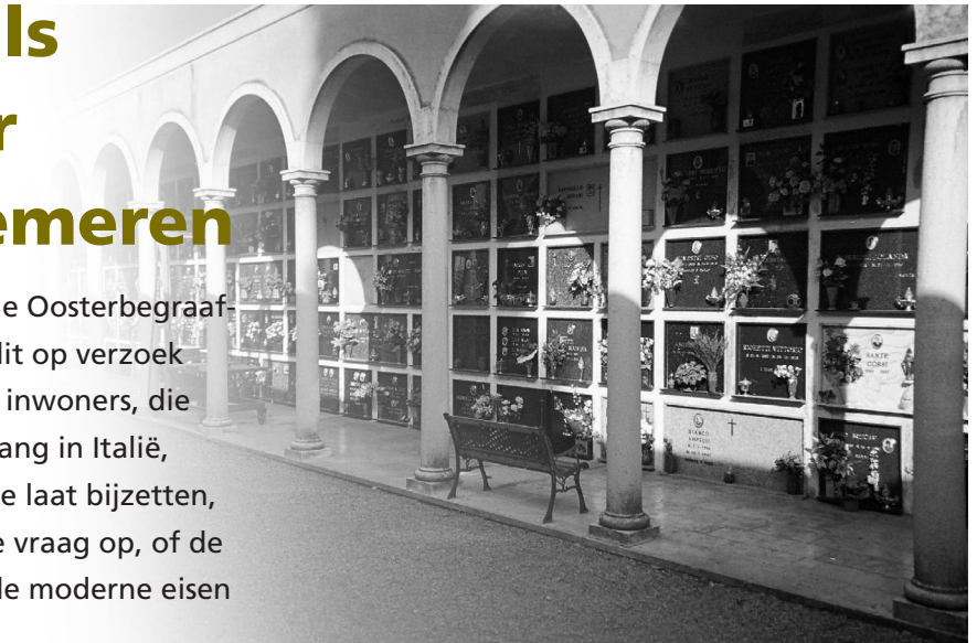
Cimitero di Negrar, Verona

De gemeente Enschede is van plan op de Oosterbegraafplaats wandgraven te maken. Ze doet dit op verzoek van Italiaanse en andere Zuid-Europese inwoners, die dit van huis uit gewend zijn. Een rondgang in Italië, waar liefst 68 procent zich op deze wijze laat bijzetten, en andere Mediterrane landen roept de vraag op, of de traditionele wandgraven nog wel aan de moderne eisen voldoen.