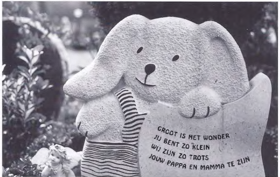
Kindermonument op Heidehof, Apeldoorn

Cornielieke: 'Zat een overleden kind op school, dan proberen we tijdens de uitvaart bij de kinderwereld aan te sluiten door het invoegen van theater, een verhalenvertelster of andere vormen die hij kinderen passen.' Tegelijk streeft de Wending ernaar