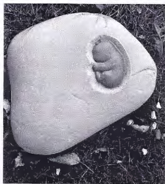
Voorbeeld kindersteentje in 'De laatste tuin', Floriade