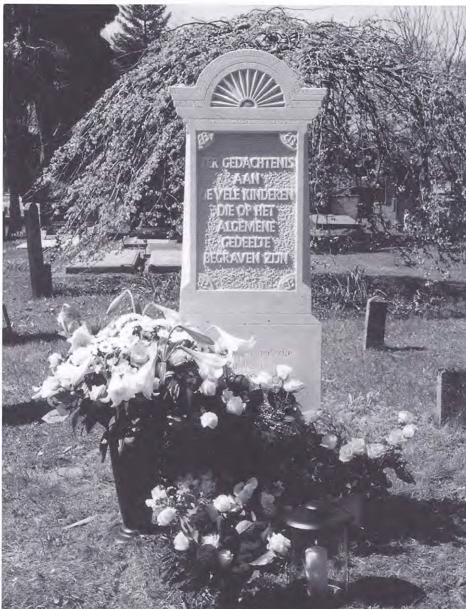
Kindermonument op algemene gedeelte begraafplaats Bergklooster, Zwolle

De vraag wordt wel opgeroepen hoe dit soort ontwerpen voor kindergraven beleefd zal worden door nabestaanden na tien of twintig jaar. De levenssfeer verandert, het verdriet blijft wel, maar krijgt een andere plaats, het blijft wel. Maar ouders worden ouder, broertjes en zusjes worden volwassen en zullen géén gebruik meer maken van de glijbaan en de zandbak. Wordt er rekening gehouden met de veranderende levenssfeer zodat het ontwerp aangepast kan worden aan de eisen van de voortschrijdende tijd?