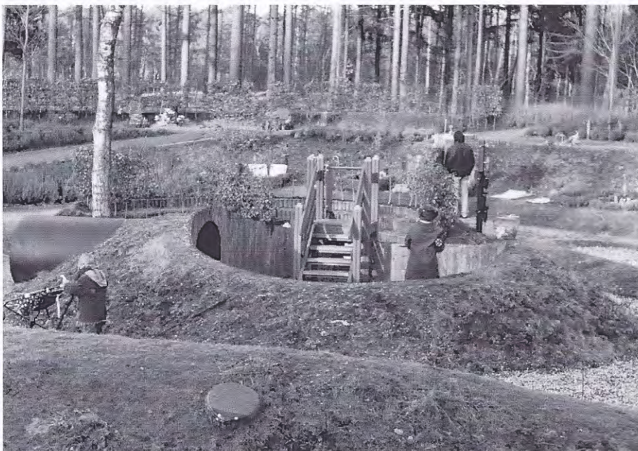
Kindergedeelte op Rusthof, Amersfoort

Opvallend is dat de aandacht voor een graf in z' n algemeenheid, maar voor een kind in het bijzonder, sterk is toegenomen. Grafbedekkingen onderscheiden zich steeds meer van elkaar