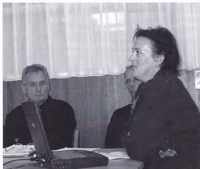
De recodag in Haren.

Vanuit het project Kerken in 't Groen worden ook cursussen georganiseerd. Deze worden enthousiast bezocht, ook door een aantal reco's. Men kan hier kennis opdoen over de wijze waarop het beheer van een begraafplaats gedaan kan worden. De Milliano sloot af met het feit dat het project inmiddels het vijfjarig bestaan heeft gevierd en dat de continuïteit