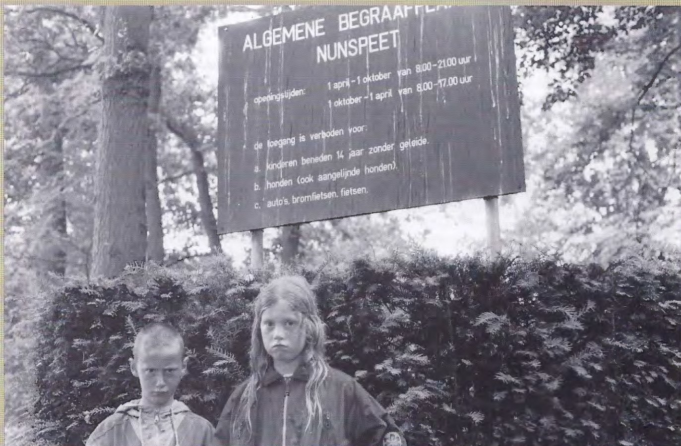
Op veel gemeentelijke begraafplaatsen is de toegang voor kinderen beneden de 14 jaar zonder geleide verboden.

Excursie Kruiningen, Kapelle en Middelburg