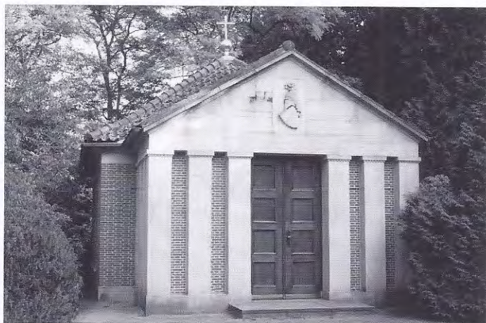
Mausoleum Wilhelm II, Doorn