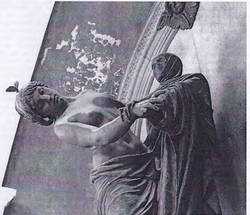
Campo Santo Genua: vrouw danst met de dood

Terug naar Nederland. Via Freiburg. Een vriendelijk dorpsachtig Stadthotel. Een gezellig afscheidsdiner met verrukkelijke streekgerechten. En een gang over het Alte Friedhof tot besluit. Een cultuurhistorisch kleinnood, en een oase van rust in een hoofd vol rijke funeraire herinneringen met een totale lengte van 1782 kilometer.