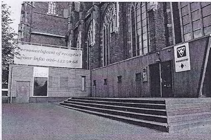
Ombouw Grote Kerk Arnhem