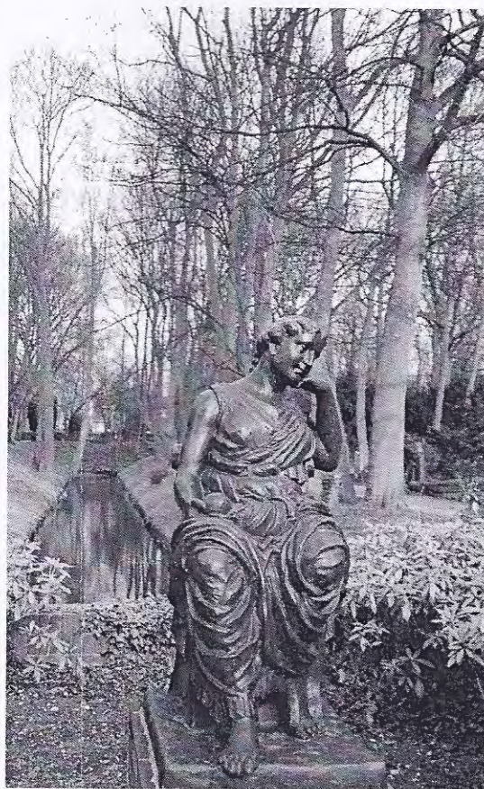
Algemene Begraafplaats Jaffa te Delft

Aanvankelijk waren er tot in de jaren zestig vijf klassen. Nu worden nog alleen maar familiegraven voor bepaalde tijd uitgegeven. Voor het oude gedeelte geldt bovendien de beperking dat alleen hardstenen grafmonumenten zijn toegestaan. Frappant zoals tijden veranderd zijn. Uit de annalen van 1829 blijkt dat de kosten voor baren, handwerk, etcetera 99,38 gulden bedroegen, terwijl deze nu, afgezien van de salarissen, voor trucks, machinerieën enzovoorts jaarlijks op 99.377,- euro komen, aldus Schipaanboord. In 1995 vond een renovatie plaats, terwijl inmiddels aan een volgend