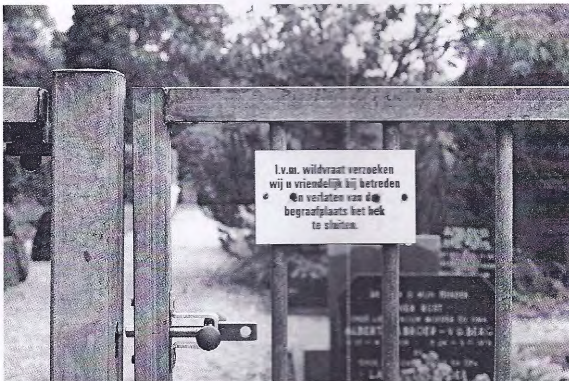
toegangshek begraafplaats Schaarsbergen