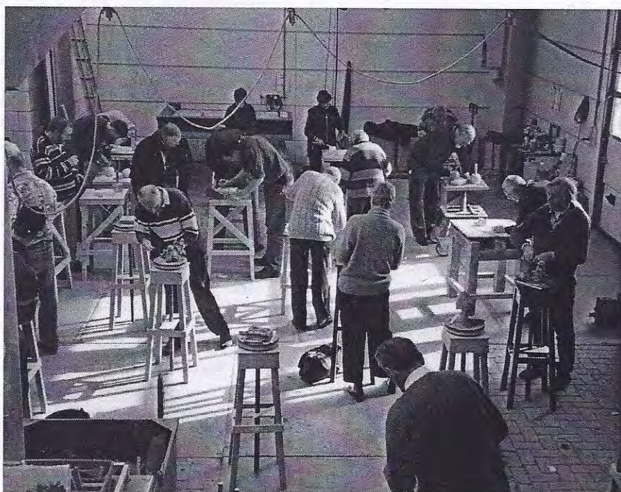
Terebinthleden leven zich uit met klei en mergel

De excursie voerde langs vele wijzen van natuursteenbewerking met geheimzinnige namen als scharreren, boucheren en joppen, namen die door de demonstraties van medewerkers al snel veel van hun geheimzinnigheid verloren. De rondgang culmineerde in een creatieve sessie waarbij van ieder uitdrukking van zijn of haar innerlijke roerselen in steen of klei werd gevraagd. Voor velen een korte, maar leerzame kennismaking met het gevecht met