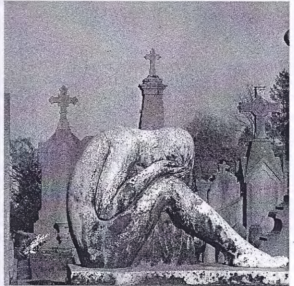
Tournai, Cimetière du Sud, beschermd deel

Bij de lezingen rond het thema crematie werd door gepensioneerd architect Jean Décarie uit Montréal het even opmerkelijke als oorspronkelijke plan gelanceerd om van kerken weer begraafkerken te maken 'om de doden terug te brengen temidden van de levenden'. Het idee ontstond bij het zien verschijnen van enorme betonnen mausolea op de begraafplaatsen in Montréal, die in het centrum van de stad op de Mont Royal zijn gelegen, bij het streven de begraafplaatsen in hun oorspronkelijk-