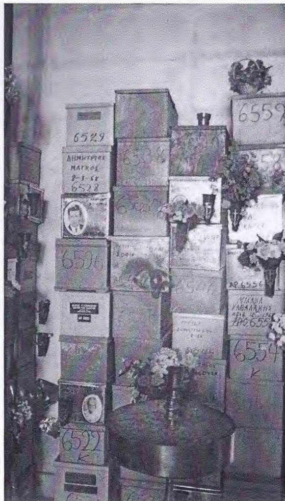
Respectloze beenderenopslag in Athene