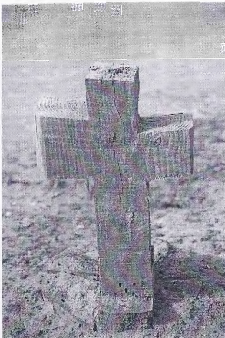
Op de Westerbegraafplaats in IJmuiden

lgde door de heer Vlaanderen, lid van de excursiecommissie en niet onbekend met het begrafeniswezen. Een eveneens beroemde ontwerper, de tuinarchitect L.P. Zocher uit Haarlem zat achter de aanleg van begraafplaats De Biezen in Santpoort-Noord. Deze begraafplaats werd geopend in 1874. De combinatie van opgehoogde geestgronden begroeid met symmetrische boompertjes en doorsneden met waterpartijen en paden met de voor de landschapsstijl kenmerkende zichtlijnen maken de begraafplaats zeer de moeite waard. In deze beschouwing mag de prachtige doodgraverswoning in Art Nouveaustijl uit 1907 niet ontbreken, net zomin als het imposante