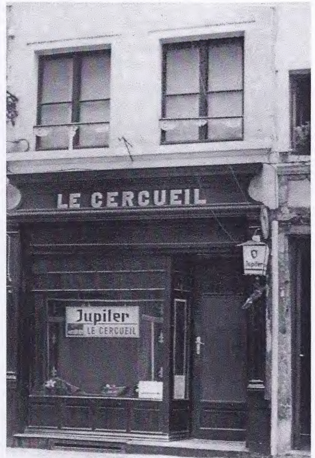
Funeraire cultuur in Brussel