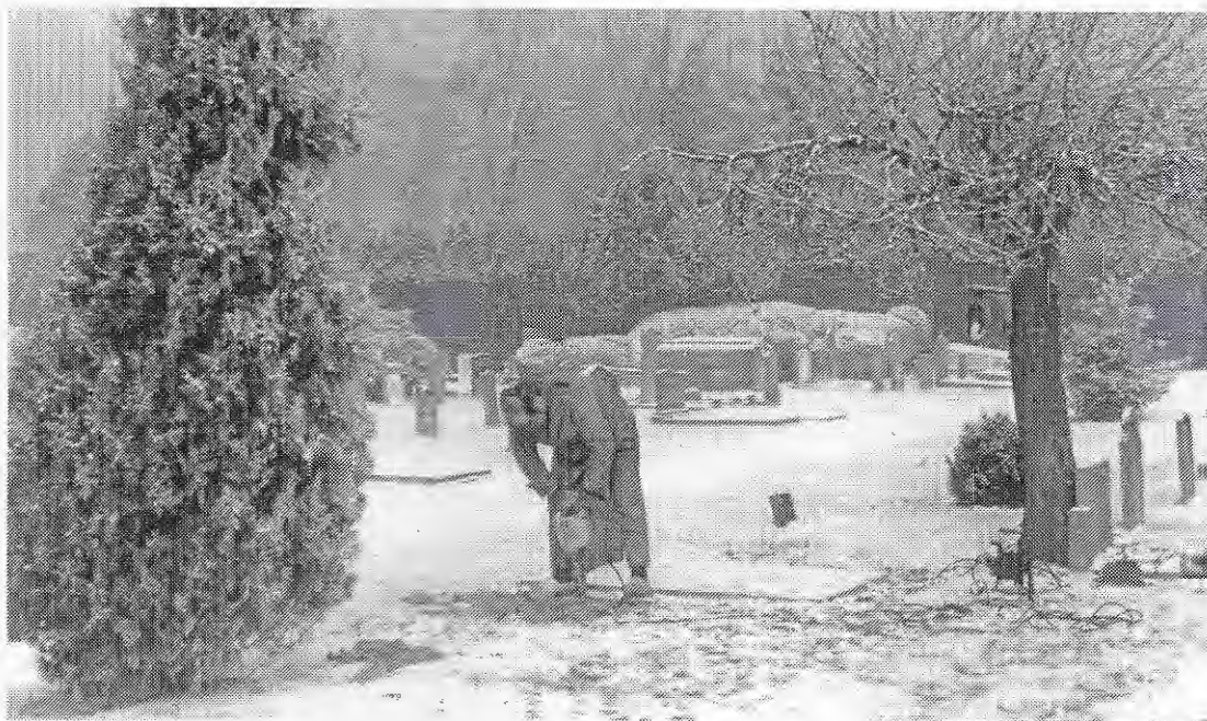
Het openen van een graf in de winter met een kangoeroe

Bij de expositie hoort een catalogus te verkrijgen bij de Arbeitsgemeinschaft Friedhof und Denkmal, Weinbergstrasse 25-27, D-34117 Kassel, telefoon: 0049561918930, e-mail: afd.kassel@t-online.de