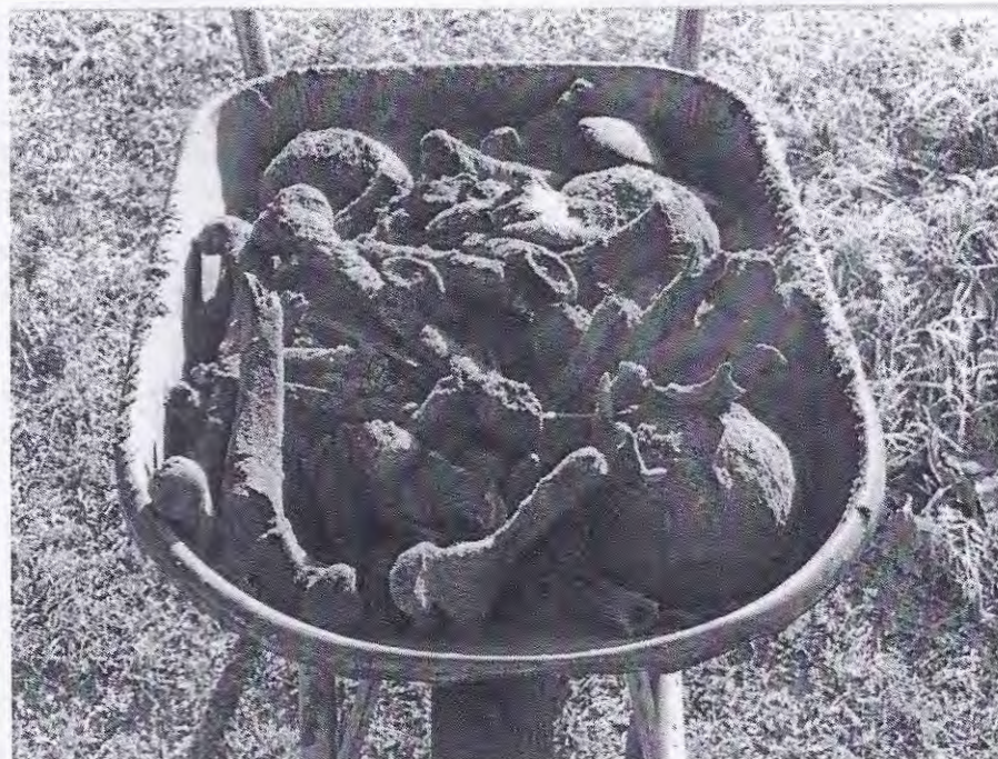
Na het schudden van een graf wachten de beenderen in een kruiwagen om weer verdiept begraven te worden

Uit beide berichten uit de krant blijkt hoe geschokt er gereageerd kan worden op uiterlijke verschijningsvormen van een dode of de dood, in de vorm van een bot of een afbeelding