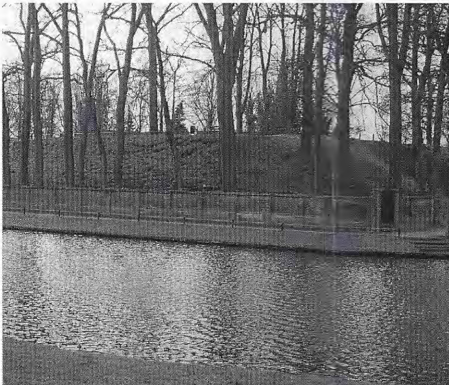
Joodse begraafplaats Kanonswal Groenlo

Hoewel funeraire cultuur een bijzondere lading heeft, is een bundeling van krachten tussen de Terebinth en Menno van Coehoorn goed mogelijk. De excursie voerde ook naar de joodse en de hervormde begraafplaats. Niet alleen is de geschiedenis van deze dodenakkers met elkaar verbonden door het graf van een joods jongetje op de hervormde begraafplaats: toen tijdens de Tweede Wereldoorlog dit onderduikertje bij een luchtaanval stierf, is het daar 's nachts begraven om de mensen, waarbij hij ondergedoken zat, niet in gevaar te brengen. Maar ook de geschiedenis van de begraafplaatsen