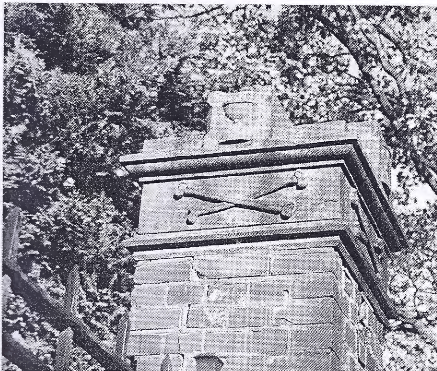
Oude hervormde begraafplaats Groenlo

Kosten: F20,- per persoon contant te voldoen in de bus