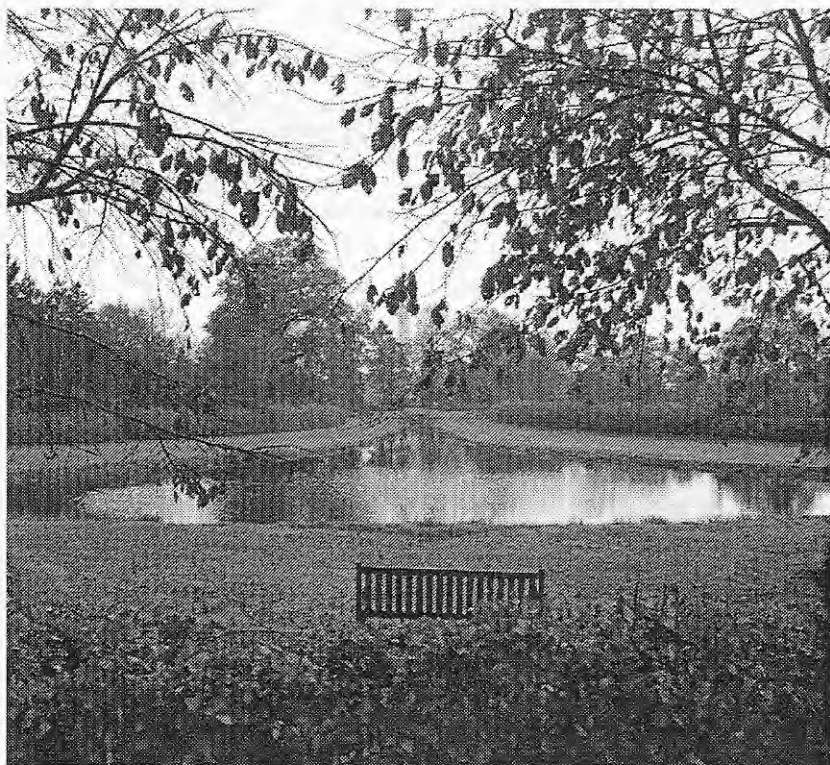
Ontwerp Copijn, Kranenburg in Zwolle

Copijn pleit ervoor dat de Terebinth een adviserende rol krijgt voor bij het ontwerpen van begraafplaatsen. Hierop zou ik een voorschot willen nemen. De Terebinth zou zich kunnen bezinnen op de wijze waarop wij omgaan met knekels uit algemene graven. Deze verdwijnen doorgaans na tien jaar in een anoniem massagraf. Er zouden speciale knekelgra-