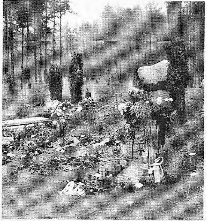
Uitbreiding Rusthof Amersfoort

De verschillende begraafplaatsen beschouwend, is het moeilijk om te bepalen wat nu ideaal is. Er zijn genoeg mooi aangelegde begraafplaatsen. Maar die dulden nauwelijks individuele invulling. Als gebruiker moet je je thuis voelen bij het ontwerp en de nadrukkelijke sfeer van een begraafplaats want anders is er geen ruimte voor je. Daarentegen is een begraafplaats met een uiterst sober en functioneel ontwerp misschien niet mooi. Maar juist door veel ruimte te geven aan individuele wensen ten aanzien van de grafbedekking kan dat weer een aardig begraaflandschap opleveren. Aan de andere kant zie je dat veel individuele vrijheid resulteert in begraafplaatsen met een bont en chaotisch uiterlijk waar soms wansmaak de boven-