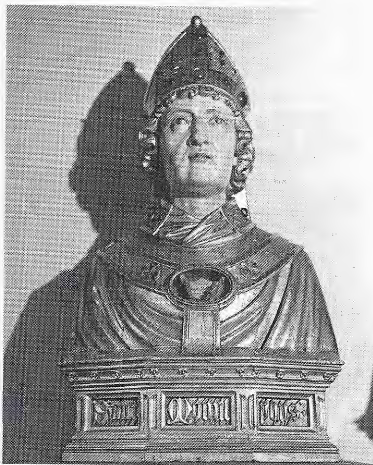
Reliekhouder uit de Sint Servaaskerk in Maastricht