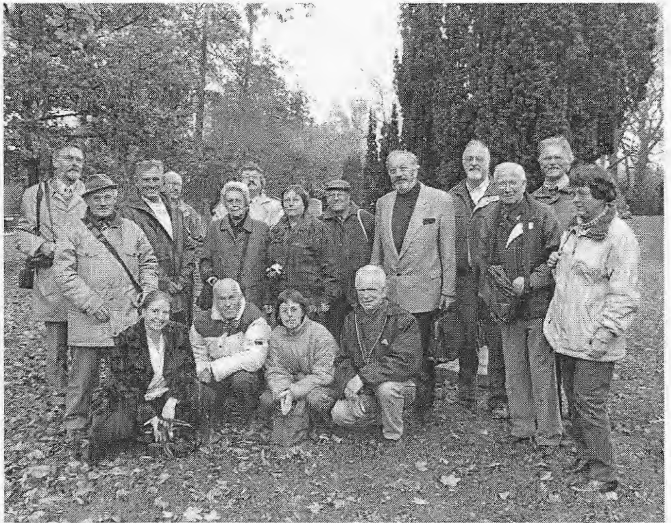
Recobijeenkomst te Baarn