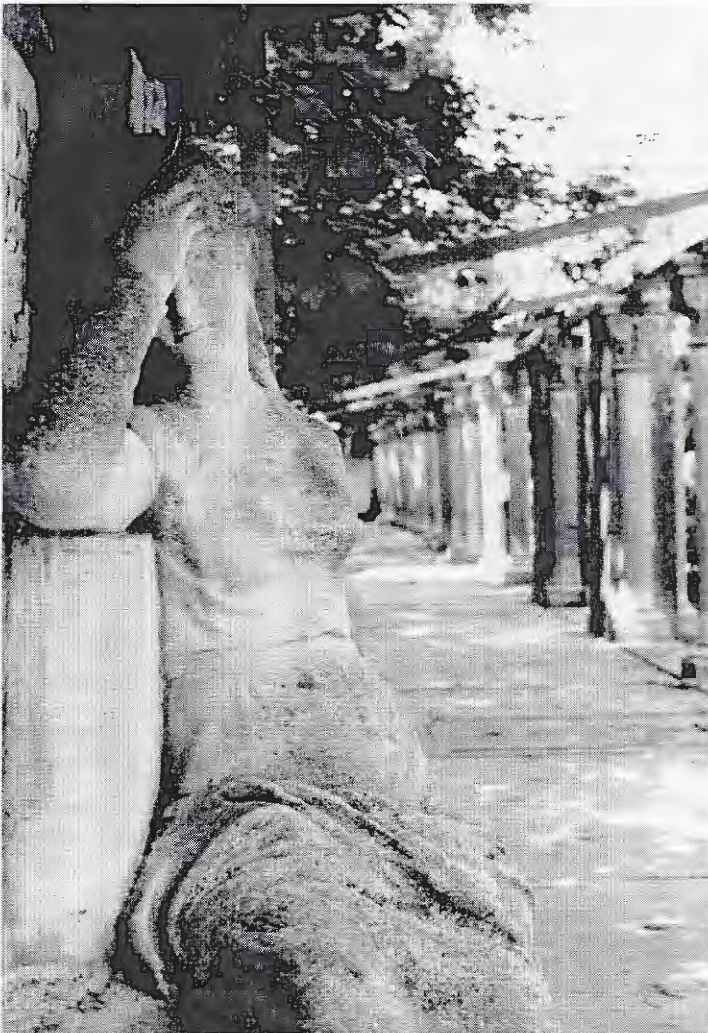
De Arcade van RK Begraafplaats Crooswijk in Rotterdam