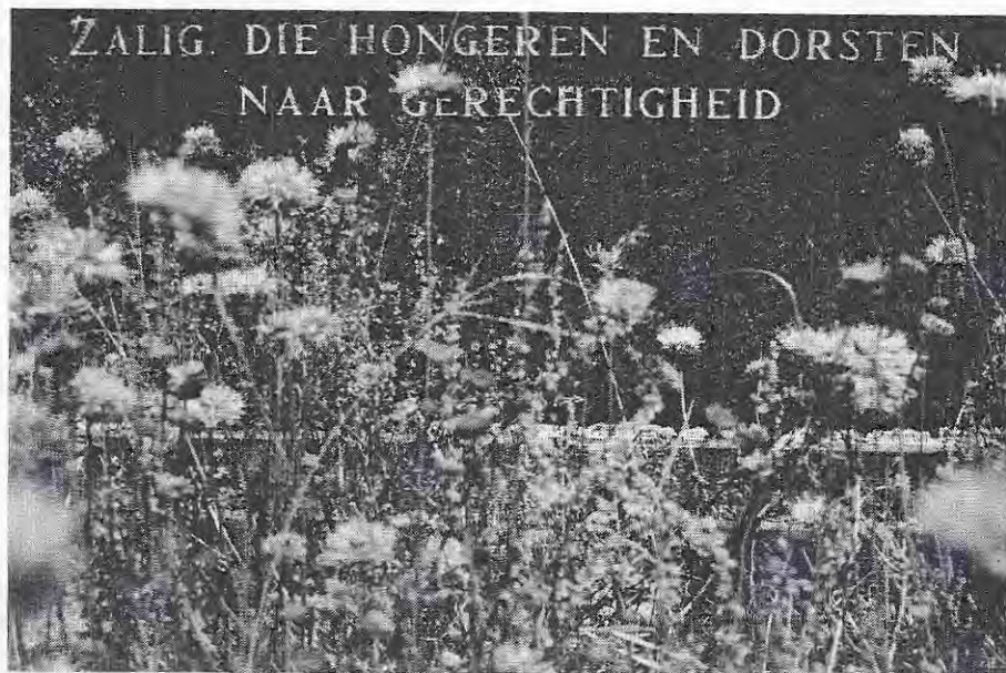
Zandblauwtjes en schapezuring door minder intensief maaien

Met uitzondering van de zerk van Jan Mulert stammen de nog aanwezige grafmonumenten van na 1825. Oude zandstenen bouwfragmenten, die de slopers van het klooster hebben laten liggen, zijn in groten getale gebruikt als grafsteentjes. Een stuk van zo'n steen werd vlak geschuurd, waarna de initialen van de overledene erin werden gekrast. Samen met fragmenten, die tijdens het delven van graven zijn gevonden, worden enkele van deze gedenktekens nu op de begraafplaats bewaard in een schuurtje, dat dienst doet als museum. Door onderzoek in schriftelijke bronnen en door veldonderzoek is