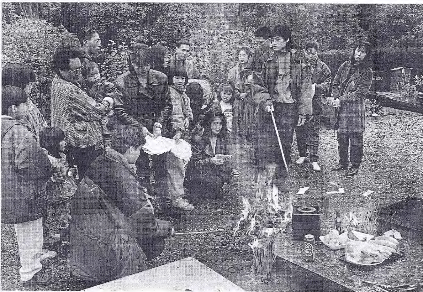
Chinese familie voert verbrandingsoffer uit op een van de vier voorouderherdenkingsdagen