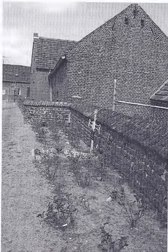
Het Jodenhoekje in Beesel

De bus stopt op de smalle weg in Ouddorp in gemeente Beesel. Links ligt, opvallend hoog, de te bezoeken begraafplaats. De plek is wat kaal, weinig groen, weinig grote monumenten. Wel veel keramiek waar Beesel om bekend staat. De fundering van een kerkje doet vermoeden dat op deze plek al vanaf de twaalfde eeuw wordt begraven. De oorspronkelijke vorm van de kerk is niet duidelijk. Er liggen minstens drie graven