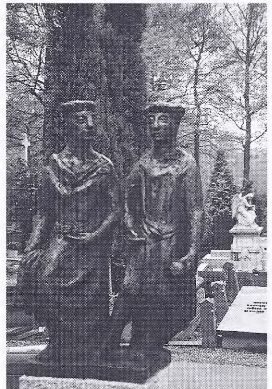
Het beeld van Cosmas en Damianus op de begraafplaats Sint Barbara in Utrecht