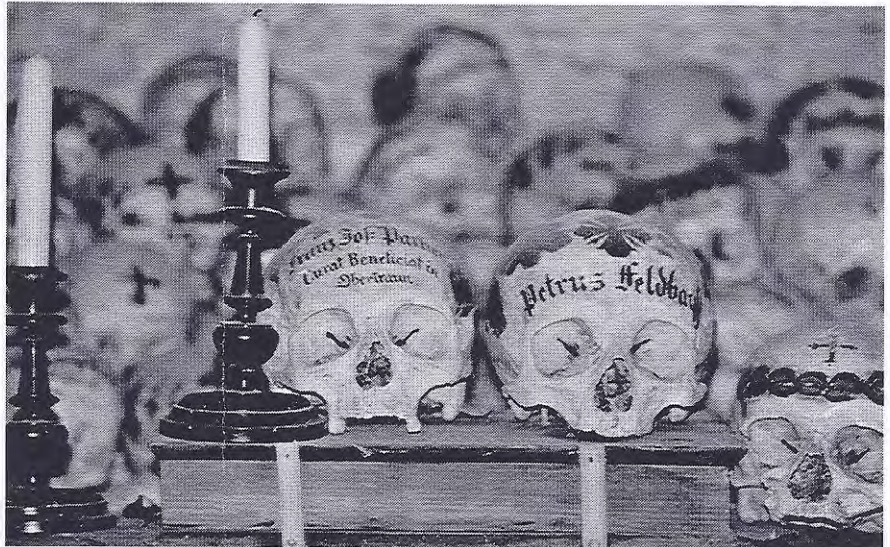
Kartner in Hallstatt

In Zuid-Europa legde men meer de nadruk op het recht van het individu; vandaar dat men hier niet dergelijke knekelhuizen kende, maar wel mummiebegraafplaatsen. Als de lichamen na de eerste begrafenis niet verder meer veranderden, omdat ze ofwel verdroogde geraamten ofwel mummies waren geworden, kregen ze hun