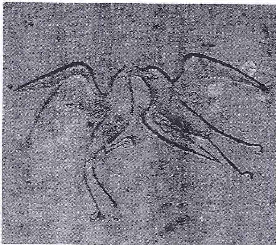
Zwaluwen in baltsvlucht, Petrus en Paulusbegraafplaats Ulfst

A an de andere kant heeft de popularisering van orgaandonatie een raakvlak met de asdeling, die bijna wettelijk is geregeld. Dit betekent, dat nabestaanden een beetje as bij zich kunnen dragen. Volgens de wet is as geen stoffelijk overschot en kan er