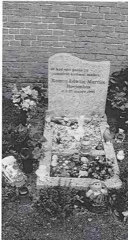
Kindergraf te Overveen