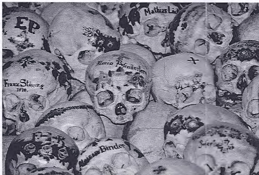
Karner in Hallstatt