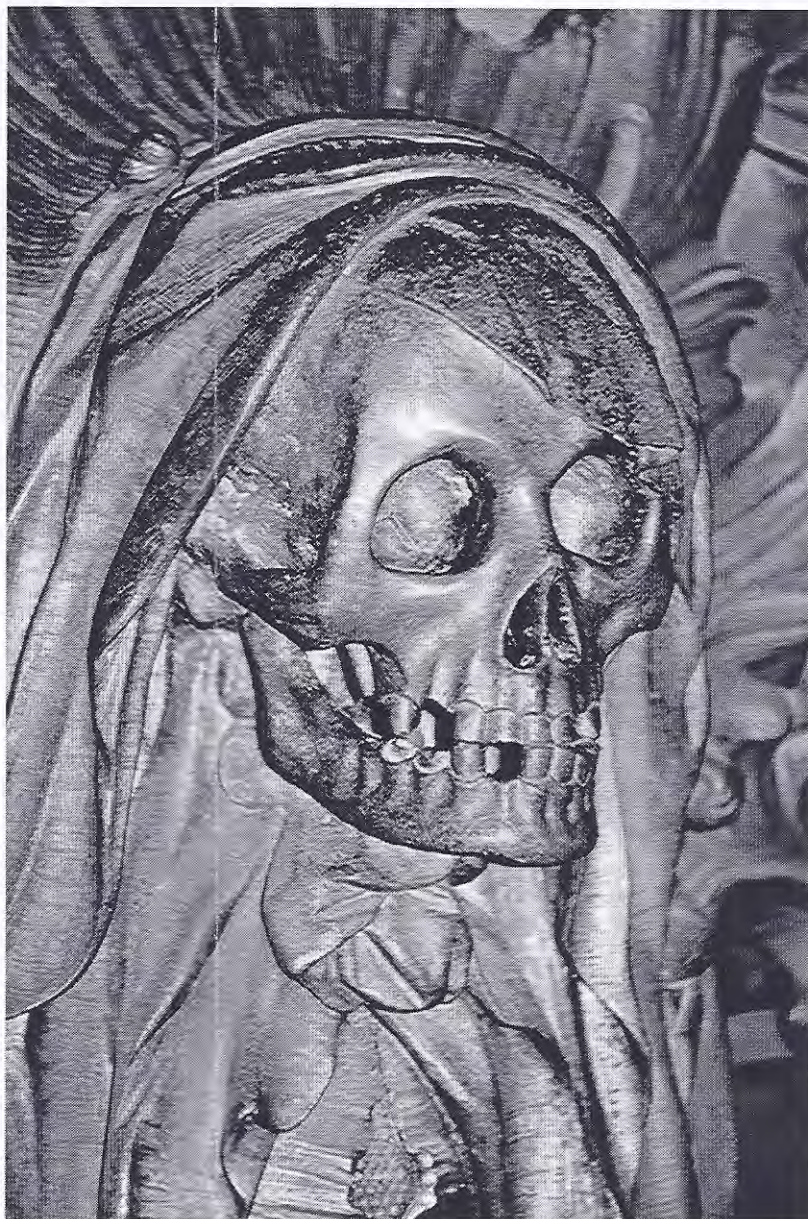
Kaisergruft in Kapuzinerkirche