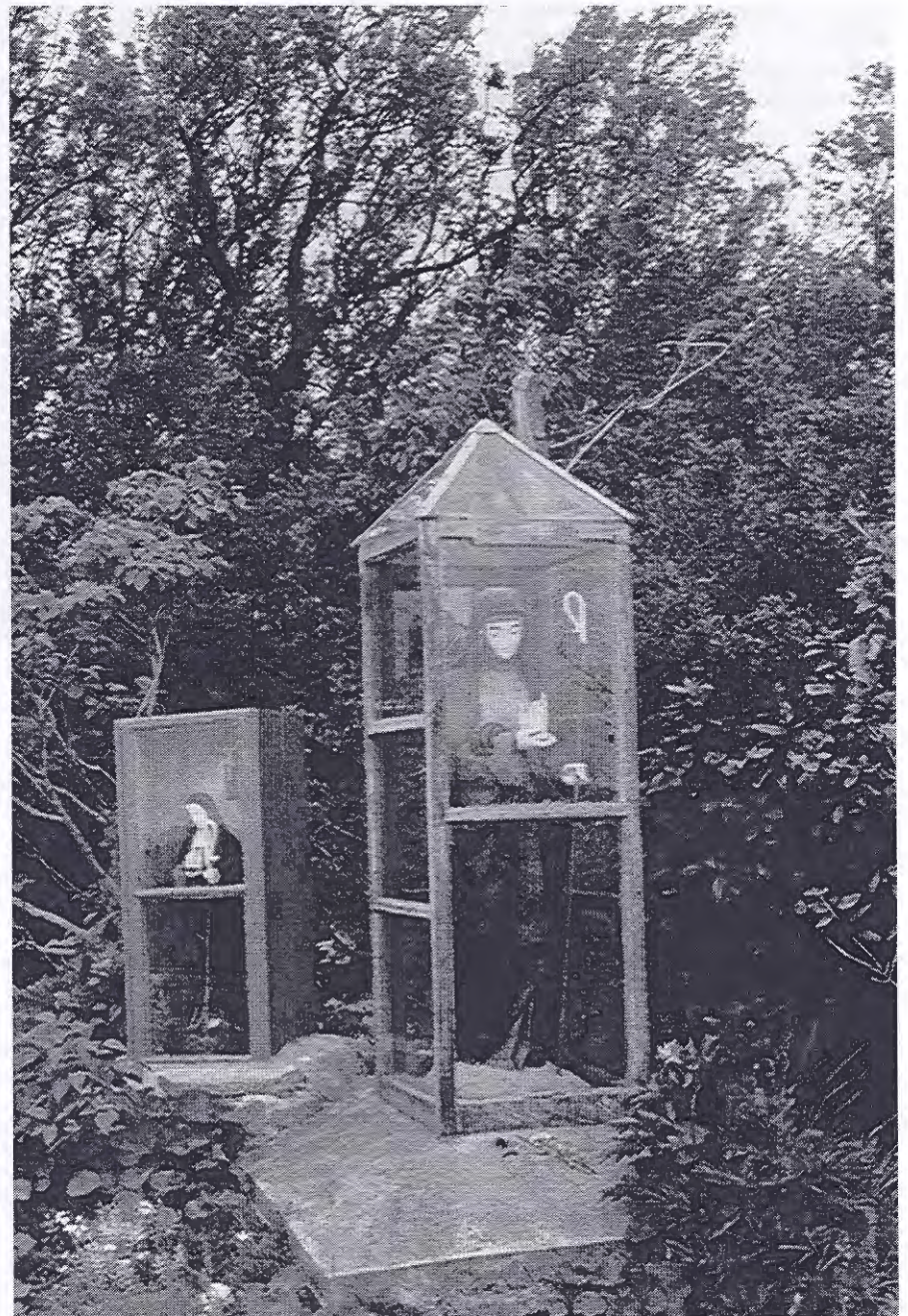
Heiligen in Ierland