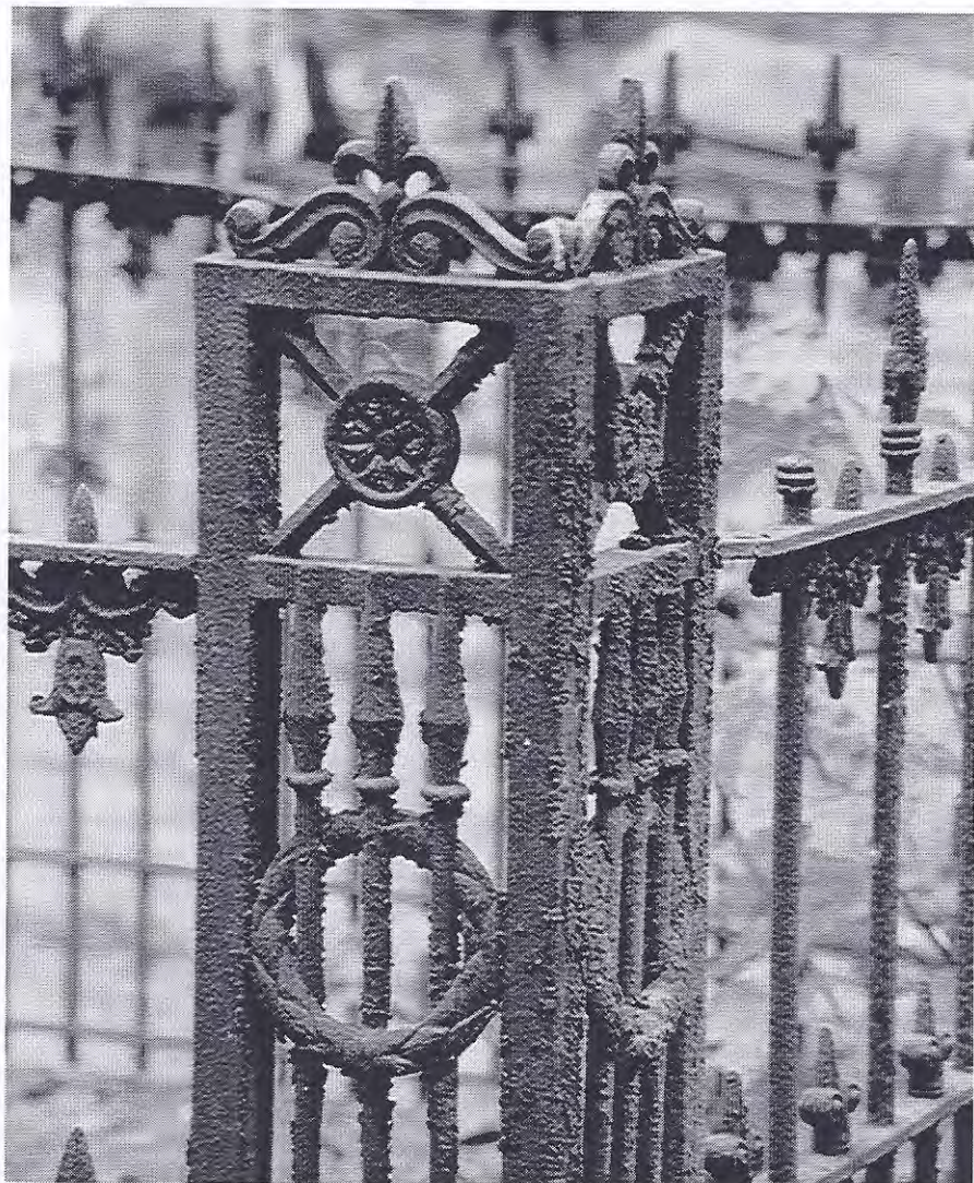
Hekwerk op begraafplaats in Leeuwarden

Een verslagje in ons blad is er toen niet van gekomen, maar ik kan degenen die nog nooit op de Spanjaardslaan zijn geweest, verzekeren dat goed te zien was dat de begraafplaats behoorlijk te lijden had gehad van de verwaarlozing. Duidelijk was te zien dat het lijkenhuisje een bouwval was en wie er oog voor had, zag dat de parkachtige aanleg grotendeels overwoekerd was geraakt door één soort struik. Goed onderhoud aan de paden was de laatste jaren achterwege gebleven. Dan heb ik het nog niet eens gehad over de honderden verwaarloosde grafmonumenten. In 1994 was er nog geen goed zicht op de toekomst van de begraafplaats. Alles zat vast op medewerking van de gemeente Leeuwarden. Een van de wethouders van de stad had wel oren naar de oprichting van een stichting die renovatie en onderhoud van de begraafplaats op zich zou nemen. Eind 1994 benaderde hij hiertoe een aantal Leeuwarders. Deze personen hadden allen iets te maken met de begraafplaats of met het funeraire gebeuren in het algemeen. Tevens werden een aantal regionaal en landelijk bekende personen aangeschreven om zitting te nemen in een comité van aanbeveling. Onder andere de commissaris der Koningin van Friesland, de burgemeester van Leeuwarden en graaf Van Zuylen van