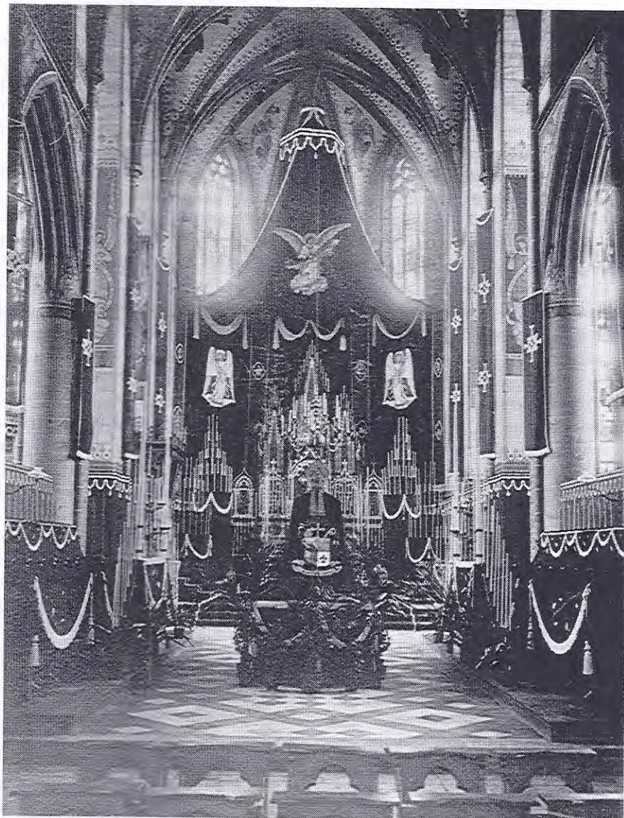
Zwarte rouw in de kathedrale Christoffelkerk bij het overlijden van bisschop J.H. Drehmanns in augustus 1913

In de achttiende eeuw kwam het standsverschil nog nadrukkelijker tot uiting. In november 1784 kreeg de