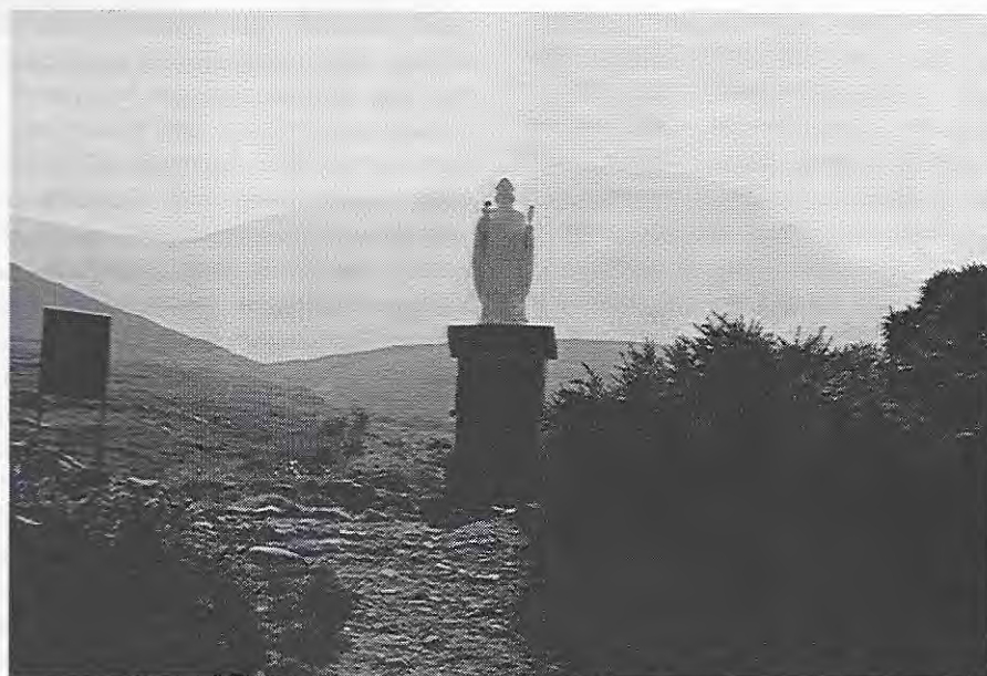
St. Patrick in de verte