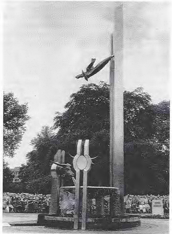
Indisch Monument Roermond

Pas in 1987 werd het Indisch Monument in Den Haag onthuld. "Jaren te laat voor een stad als Den Haag, maar het sluit aan bij al die jaren dat de overheid zich niets gelegen heeft laten liggen aan de Indische gemeenschap. We hebben er ontzettend lang voor gevochten en pas toen het er stond, bleek hoe hard het nodig was. Bijna iedereen brengt na de plechtigheid de bloemen naar het monument. Het is het enige blijk van erkenning voor alle kamp- en oorlogservaringen, die men heeft doorstaan en het is van grote waarde voor de Indische gemeenschap". "Het is een bekend gegeven in Den Haag, dat mensen een klein beetje as verstrooien bij het monument. Als het straks mogelijk wordt dat mensen de as kunnen ver-