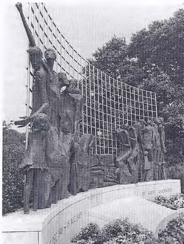
Indisch monument Den Haag

"De laatste jaren is er een kentering in de toespraken.