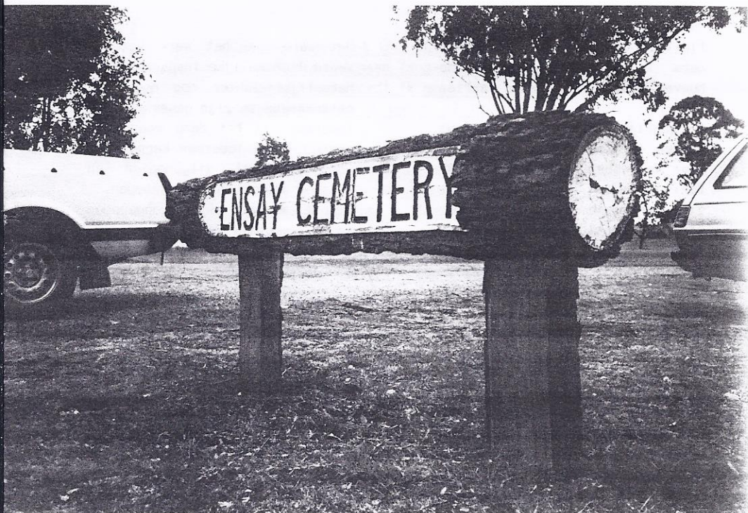
Ingang Ensay Cemetery

De begraafplaats, Ensay Cemetery, ligt op een hoge heuvel, die ligt tussen nog hogere heuvels in de omgeving. Er zijn in de wijde omgeving geen huizen of wegen te bekennen. Het uitzicht is op de met gras bedekte heuvels met her en der groepen eucalyptusbomen en groepen schapen adembenemend. De stevige wind en de snel voorbij drijvende wolken dragen hieraan bij. Het hele dorp is op komen dagen. Het is duidelijk dat de zondagse kleren van de schaapherders en de automonteurs niet dagelijks worden gedragen onder hun door zon en werk gegroefde gezichten. Het wachten is op de brandweer-