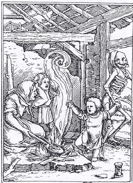
Dodendans uit: 'Het beeld van de dood' (156), Philippe Arriès