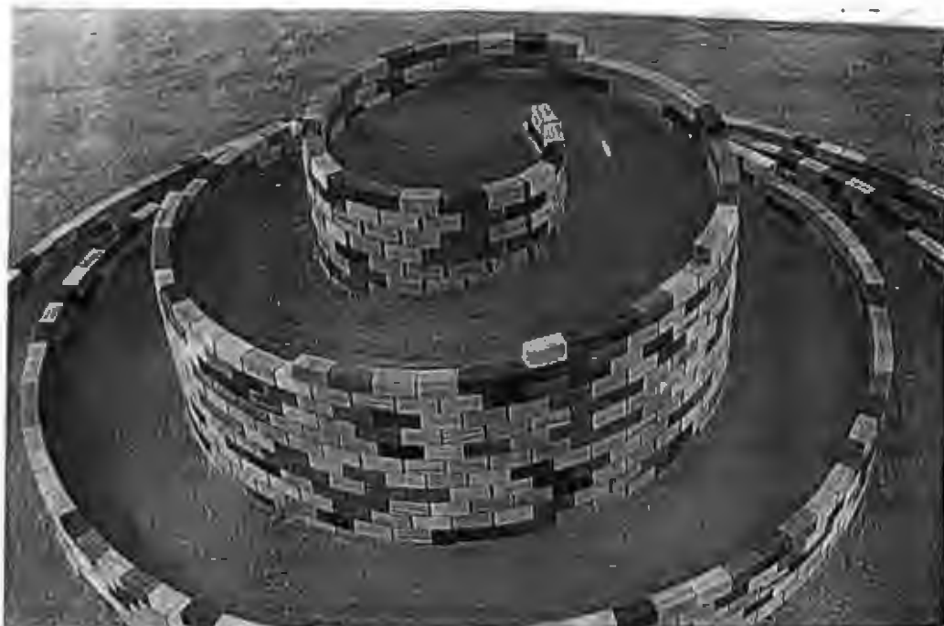
Het ontwerp van Marius Boender

Eén van de consequenties van een dergelijke begraafplaats is dat de bodem regelmatig opgehoogd zal moeten worden om nieuwe ruimte voor graven te creëren. Daardoor zullen de onderste gedenksteden op den duur aan het oog onttrokken worden. Boender stelt dat bij vijf begrafenissen per week de meeste gedenksteden zo'n vijftig jaar zichtbaar zullen