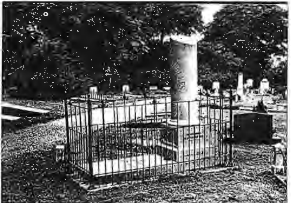
Grafmonument van S.N. Sablailrolles.

Uiterst bescheiden is het aantal 'grafwerk onder architectuur'. Het gaat hier om traditioneel vaak classicistisch geïnspireerde modellen die in de volksmond al gauw de benaming grafmonument krijgen. En veel werden ze kennelijk niet gemaakt want toen de catalogus werd uitgebracht beschikte