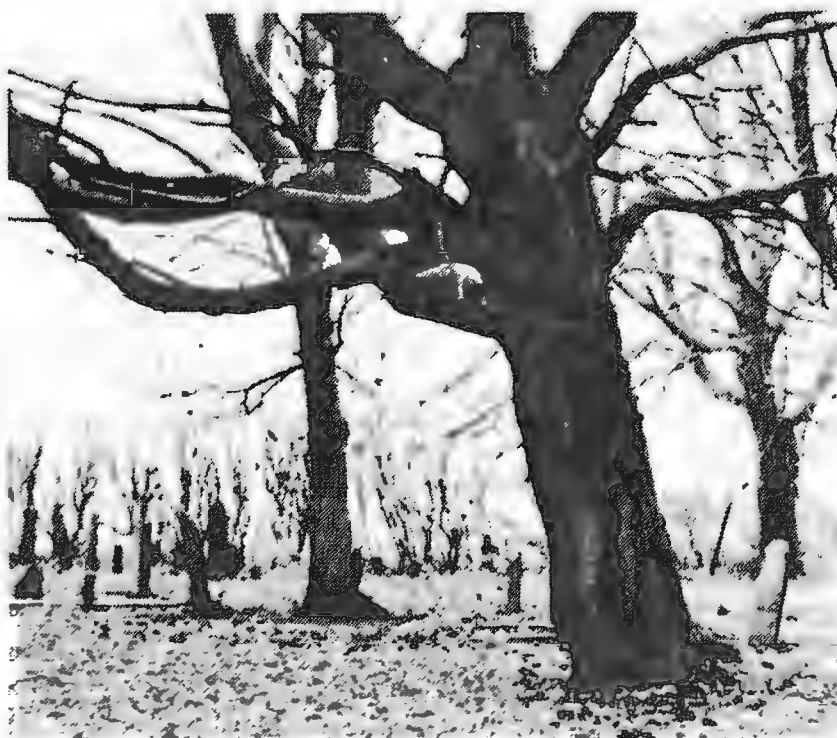
Impressie van het begraafplaatsje Het heilige kruis of Buitengasthuis te Zwolle.

'Dit plan kenmerkt zich door de gelukkige wijze waarop, met zeer eenvoudige