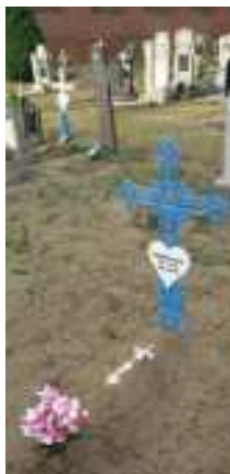
Kerkhof van Langdorp

Tijdelijke, beperkt duurzame funeraire gebruiken die ingrijpen op de aanleg van het kerkhof verdienen eveneens aandacht, gezien hun hoge erfgoedwaarde die deels voortvloeit uit de betrokkenheid van de bevolking. Een typisch voorbeeld hiervan is de traditie van aarden bedjes.