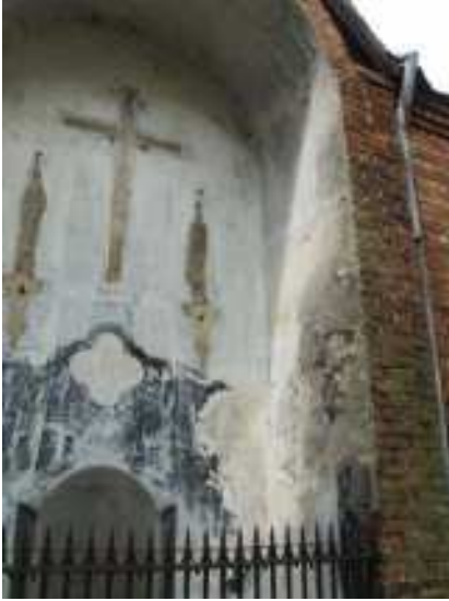
Koorgevel Sint-Antonius Abtkerk in Wolfsdonk