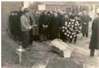
Teraardebesteding op het kerkhof van Langdorp

derzoek, inventarisatie, herwaardering en aanvraag voor financiering (zie pag. 67).