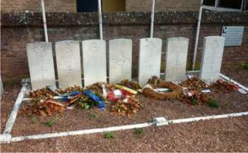
Militair ereperk op kerkhof van Langdorp

vaak voor een betekenisvol funerair geheel. Voor nog functionerende kerkhoven is het van belang om een passende plaats te voorzien voor de toekomstige graven van kinderen, vroeg-geborenen en foetussen.