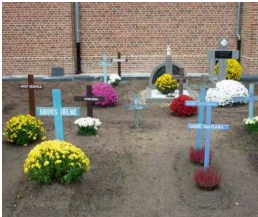
Het kinderperk in Wolfsdonk

zijn wegens hun typische vormgeving en emotionele betekenis 14 , en betekenisvolle relaties tussen een grafteken en andere funeraire elementen op de kerkhofsite.