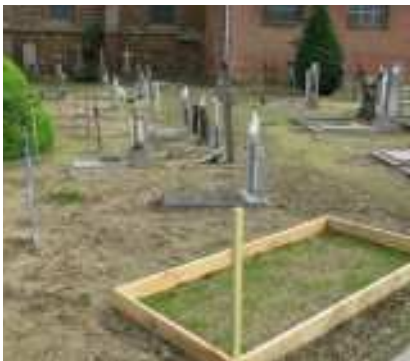
Onderzoek van de bodem in Langdorp.

Door jarenlang gebruik van pesticiden is het belangrijk te weten hoeveel residu van deze stoffen zich momenteel nog in de bodem bevinden. Dit is noodzakelijk om de kerkhoven te transformeren van een 'platgespoten' arme oppervlakte naar een groene, bloeirijke, gras- en kruidenvegetatie. Hiervoor kan aan de gemeente gevraagd worden met welke producten de voorbije jaren gespoten werd, met welke dosis en met welke frequentie per jaar. Afhankelijk van dit overzicht en om uitsluitel te geven over mogelijke residu's in de ondergrond en over mogelijk schadelijk effect op toekomstige bezaaiingen en aanplantingen, dient minstens op drie plaatsen een zaakiemproefvlak aangelegd te worden. Deze bestaat erin om op minimum 2m 2 , afgeboord met houten latten, te zaaien met een grasmengsel en te evalueren of dit een normale uitgroei kent.