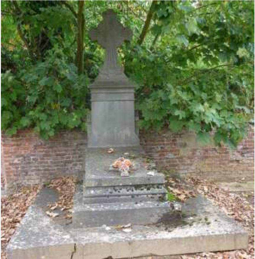
Kerkhof van Langdorp (2014)