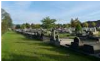
Begraafplaats van Lot (Beersel) voor en na.

kan verlopen. IGO-vzw, een dienstverlenende intergemeentelijke vereniging, actief in het arrondissement Leuven, heeft in de afgelopen jaren ervaring opgedaan in het omvormingsbeheer van de groenstructuren op begraafplaatsen, met oog op pesticidenvrije onkruidbestrijding. Op de begraafplaats van Moorsel in Tervuren is bij de heraanleg, met ontruiming van niet-geconcedeerde gronden, de door grindpaden gedomineerde structuur in 2014 aangepast. Naast het inzaaien met gras van de dolomieten paden, inclusief lucht inbrengen en loswerken van de grond met een messenschudfrees, is vanuit esthetische, financiële en plantkundige overwegingen gebruik gemaakt van allerlei vaste planten, bodembedekkers en – tussen de grafstenen – winterharde, groenblijvende sedum matten die variëren in hoogte, volume en kleur, en slechts een jaarlijks onderhoud vergen. Op de levenscyclus van een aanplanting van 10 jaar is deze omvorming kostenbesparend.