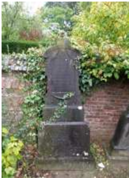
Kerkhof van Langdorp (2014)

Op vele kerkhoven wordt momenteel nog een groot aantal graftekens door nabestaanden onderhouden. Soms worden goedbedoelde, maar schadelijke handelingen gesteld. Velen weten niet dat bleekwater (javel) op lange termijn schade toebrengt aan natuursteen of dat de groene patina aan het brons een meerwaarde geeft. Onderhoudstips kunnen verspreid worden via folders, via gemeenteborden net voor Allerheiligen of via infoborden bij de begraafplaatsen. Op die manier kunnen handelingen die ongewild schade veroorzaken, vermeden worden. 21