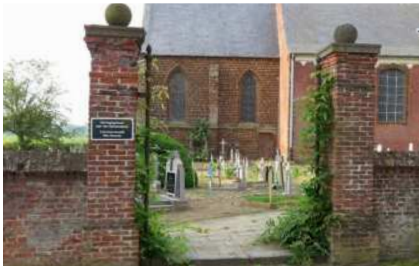
Toegang tot het kerkhof van Langdorp

Ten slotte legt een landschappelijke studie de basis voor een duurzaam onderhoud, herstel en beheer van kenmerkende funeraire structuren. Uit de inventaris en het bodem- en historisch onderzoek zal immers blijken welke elementen architectonische, ecologische en historische waarde hebben, bijvoorbeeld welke planten sierwaarde of symbolische betekenis hebben, al dan niet bij gebruiken op gedenkdagen.