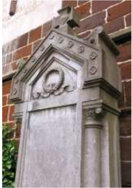
Grafteken van de familie Sterckx in Langdorp

Bij de interpretatie van symbolen is de context belangrijk, omdat een symbool, naargelang de situatie, een verschillende betekenis kan dragen. Bloemen en planten worden graag afgebeeld, dit kadert in de plantensymboliek die nog tot in de 19de eeuw algemeen gekend was. Ook in het interbellum worden rozen en klimop volop aangebracht. Het is niet altijd duidelijk of die gekozen werden om hun inherente symboliek, of eerder uit decoratief oogpunt. De roesverwekkende papaver verwijst overduidelijk naar de eeuwige rust. Sierlijke papavers zijn ingewerkt in de acroteria (spiraalvormige versieringen op de hoeken van het fronton) van het grafmonument van de familie Sterckx (ca. 1902). Andere elementen verwijzen dan weer naar funeraire praktijken. Hetzelfde graf is drager van een immortellenkrans in steen. Immortellen zijn droogbloemen die speciaal gekweekt werden om te verwerken in rouwkransen, waarmee de graven bedekt werden.