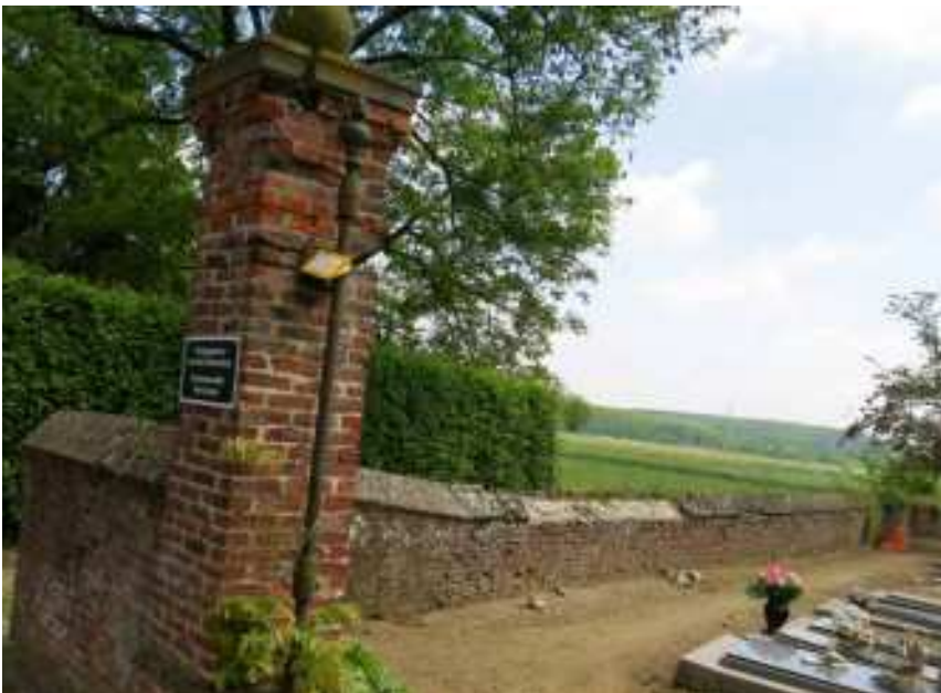
Kerkhof van Langdorp

leefde nog toen de onderpastoor aankwam, maar stierf kort daarna. De vier slachtoffers werden piëteitsvol begraven links van de noordoostelijke toegang. Later zijn ze ontgraven. Uit de registers van de burgerlijke stand van de gemeente Langdorp werden hun biografische gegevens gereconstrueerd. Een gedenkteken-gedenkplaat kan dit feit in de herinnering houden. Een samenwerking met Joodse organisaties of de Dossin-kazerne kan dit lokale gebeuren de bredere uitstraling geven die het in feite reeds in zich draagt.