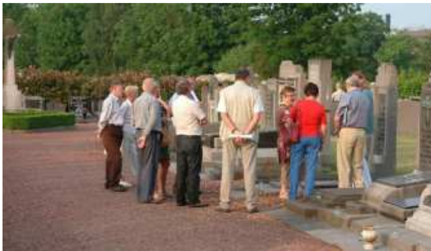
Rondleiding op de begraafplaats van Steenhuffel (Londerzeel).

Open Monumentendag Vlaanderen, het grootste cultureel ééndagsevenement van Vlaanderen, zet elk jaar op de tweede zondag van september het onroerend erfgoed in de kijker. Open Monumentendag Vlaanderen is een initiatief van Herita, in nauwe samenwerking met de Vlaamse steden en gemeenten en het agentschap Onroerend Erfgoed van de Vlaamse overheid. De coördinatie en dagelijkse werking van Open Monumentendag Vlaanderen worden verzorgd door Herita vzw. Open Monumentendag sensibiliseert de bevolking en de overheid in Vlaanderen om collectief zorg te dragen voor het onroerend erfgoed en het roerend en immaterieel erfgoed dat er deel van uitmaakt. Zowel het bouwkundig, landschappelijk als archeologisch patrimonium maken deel uit van het programma.