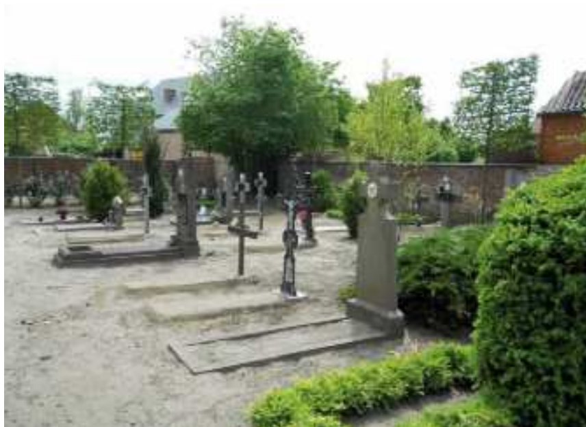
Oostzijde van het kerkhof van Wolfsdonk

Het kerkhof van Wolfsdonk, zowel de graven als de ommuring, is sinds 2012 erkend als waardevol door de provincie Vlaams-Brabant. Voor de bepaling van het waardevolle karakter van dit kerkhof dat de kern vormt van een typisch plattelandsdorp, werden de graftekens niet individueel beoordeeld, maar de grafkruisen, -stèles en kerkhofmuur globaal bekeken. De erkenning slaat dan ook op het beeldbepalende karakter van de gehelen aan voor het merendeel eenvoudige kruisen in hout, beton of ijzer, die, samen met de ommuring, de omgeving van de kerk en het dorpsplein visueel versterken.