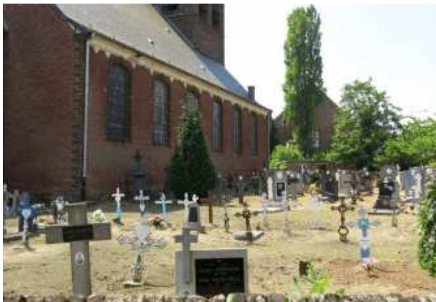
Kerkhof bij de Sint-Pieterskerk in Langdorp (Aarschot)

In vergelijking met grotere stedelijke begraafplaatsen, zijn de graftekens op plattelandskerkhoven meestal meer representatief op sociaal en demografisch vlak. Gezien aan dergelijke kerkhoven soms niets meer gewijzigd is, eens ze niet meer dienden voor grafbestemming, zijn zo goed als alle lagen van de bevolking er vertegenwoordigd. Uit de studie blijkt dat de overgrote meerderheid van de graven van Wolfsdonk op gewone grond staan, dus zonder grondvergunning. Er is vanaf 1913, de datum vanaf wanneer de gemeenteraadsbesluiten bewaard zijn, slechts één vergunning genoteerd, namelijk die van de familie Brems. Op het kerkhof van Langdorp dat in 1967 sloot, zijn ook maar enkele concessies aangetroffen. De sobere graftekens van de 'gewone man', opgericht vanaf het interbellum, zijn er het grootst in aantal. Ze zijn veelal getooid met portretfoto's, grafgiften zoals kruisen in ceramiek en votiefbordjes in marbriet. Onder meer door dit socio-historische belang, komen ook graven in gewone grond, die niet verbonden zijn aan een concessie, in aanmerking voor erkenning als (boven)lokaal waardevol of voor bescherming op (boven)lokaal niveau.