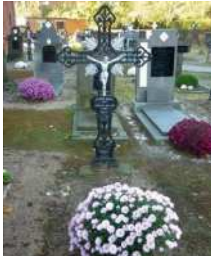
Gietijzeren kruisen op het kerkhof van Langdorp