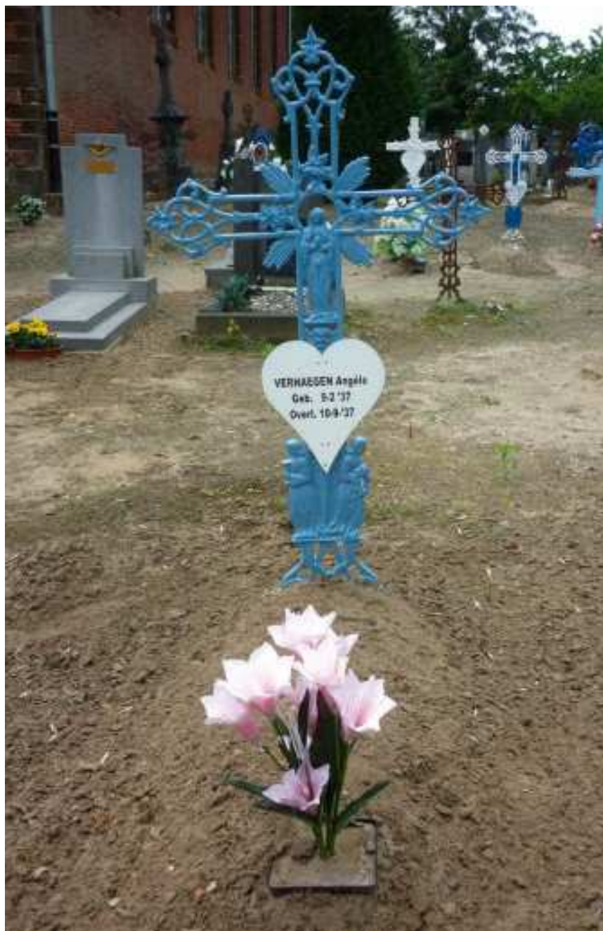
Gerestaureerd gietijzeren grafteken met aarden bedje op het kerkhof van Langdorp