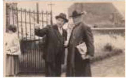
Kruisen in het hoge gras op het kerkhof van Wolfsdonk

Deze waarden spreken uit de structuur en aanleg van het kerkhof, inclusief de relatie tussen graftekens en andere funeraire