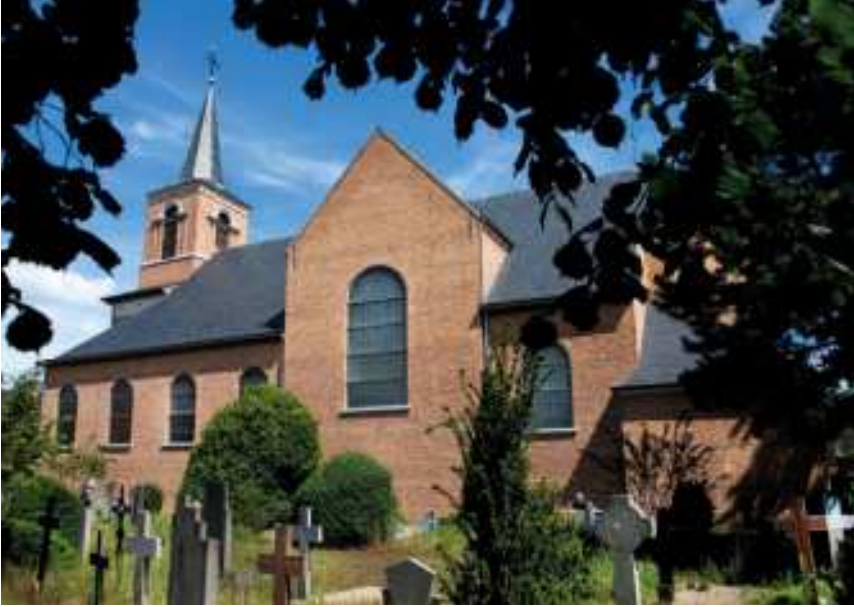
Kerkhof bij de Sint-Antonius Abtkerk in Wolfsdonk (Langdorp – Aarschot)

Naast het slechts druppelsgewijs toegepaste, meer dan twee eeuwen oude verbod op het begraven in de bebouwde kom, zorgden de bezorgdheid over de volksgezondheid, de goedkopere grondprijs aan de rand van de gemeente en de mogelijkheden tot uitbreiding aldaar ervoor dat kerkhoven in onbruik raakten ten voordele van begraafplaatsen aan de rand van dorpskernen. Ook de druk van 'koning auto' deed tal van kerkhoven wijken voor parkeerplaatsen die aangelegd werden tot aan de kerk. Niet zelden beslisten lokale overheden vanuit praktische overwegingen kerkhoven te ruimen of graftekens te verwijderen, hierin gesterkt door een context van een desinteresse voor oudere graftekens, een gebrek aan onderhoud en een veranderende begraafcultuur. Enkele van deze landelijke kerkhoven zijn echter tot op vandaag (gedeeltelijk) bewaard gebleven.