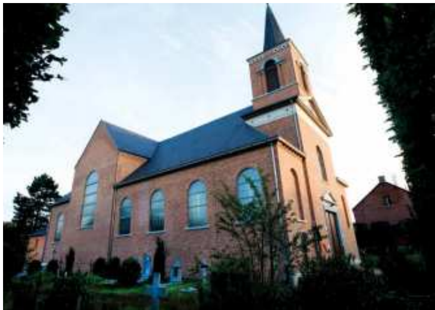
Kerkhof van Wolfsdonk