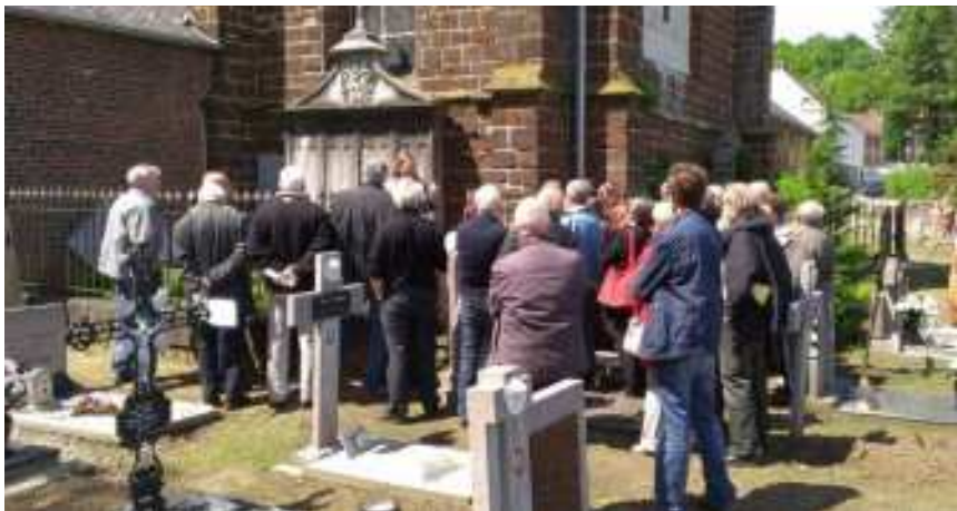
Open Kerkendag – Week van de Begraafplaatsen in Langdorp (1 juni 2013)

Het is belangrijk om de bevolking te informeren over zowel de algemene toekomstplannen van de begraafplaats als over het statuut van individuele graftekens. Een in-foavond of een bericht in het gemeentelijk informatieblad en op de gemeentelijke website kan de opzet van het herwaarderingsplan kaderen. Ook op de begraafplaats kan daarvoor plaats worden voorzien. Een publicatie over kerk en kerkhof vergroot de kennis en waardering van het publiek. Ontsluitingsinitiatieven rechtvaardigen en onderbouwen de (financiële) inspanningen die de gemeente en andere actoren ondernemen voor inventarisatie en bescherming. Een publieke actie kan ook gebruikt worden als startschot voor het zoeken van vrijwilligers bij de inventarisatie.