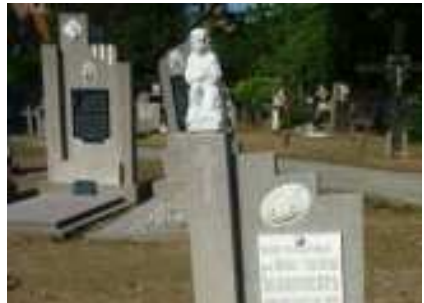
Kindergraf op kerkhof van Langdorp

Het is van belang om de intimiteit van de bestaande kinderperken te versterken. Hun typische vormgeving, afwijkend kleurenpalet en specifieke decoratie zorgen