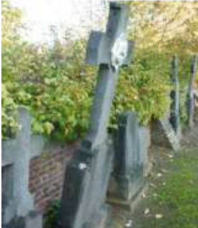
Kerkhof van Langdorp (2014)