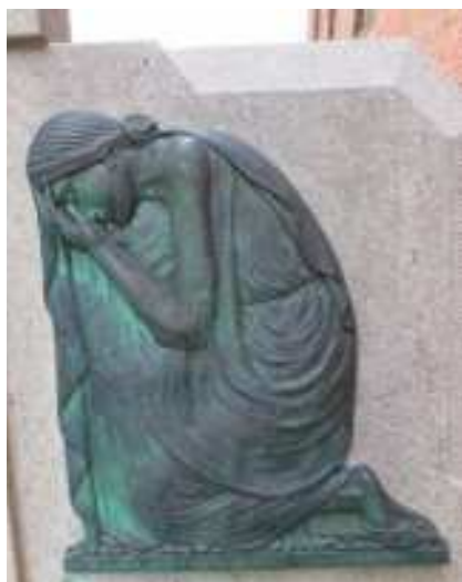
Bronzen applicatie op grafteken in Langdorp

Daarnaast zijn er nog een aantal porseleinen applicaties verdwenen, waarvan duidelijk nog een afdruk te zien is. Reliëfs in porselein zijn aangewend tot het kerkhof sloot in 1967. Zo'n 105 graven dragen een Christuskop, meestal in medaillon, op een Grieks kruis of - in mindere mate - op een rechthoekige plaat. Verder staan er op 9 graftekens vlammen, op één graf zijn bloemen bevestigd en op vier graven staat een kruisbeeld. Bij de volwassenen gaat het dus vooral om afbeeldingen van Christus, met als uitzondering de afbeelding van het symbool "handen in elkaar" (2 exemplaren). De oudste porseleinen applicatie, uit 1890, is de Christuskop op het graf van zuster Perpetua (1848-1890).