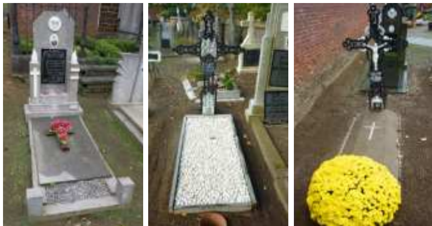
Graftyper op kerkhof van Langdorp

Decennialang ging de voorkeur uit naar gedenkplaatjes in marbriet (breekbaar, want gemaakt uit glasmassa), doorgaans in zwart, maar ook in groen, blauw of wit. Diverse leveranciers voldeden aan die vraag, door naast een tekst naar keuze ook kant en klare bordjes aan te bieden met standaardopschriften, zoals "Rust zacht lieve moeder" of "Kille aarde gij verbergt voor altijd onze schat." Deze grafgraven maken onlosmakelijk deel uit van een grafteken en vragen ook om aandacht. Zolang de beschermlaag intact is, bestaat er weinig kans op schade. Indien water kan binnendringen, kan er schade ontstaan door zouten en vorst. Deze inwendige spanningen kunnen breuken of afschilfering veroorzaken. Ze vereisen in dat geval consolidatie of opvulling van breuknaden. Deze handelingen moeten doorgaans ter plaatse worden uitgevoerd.