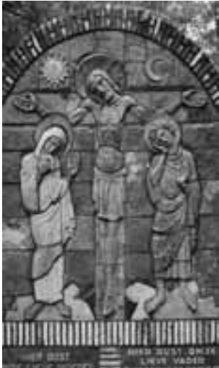
Op de gemeentelijke begraafplaats van Venlo werd Bert Pierik tijdens de excursie in oktober naar begraafplaatsen in Noord-Limburg getroffen door dit keramische grafmonument van de familie Brouwer