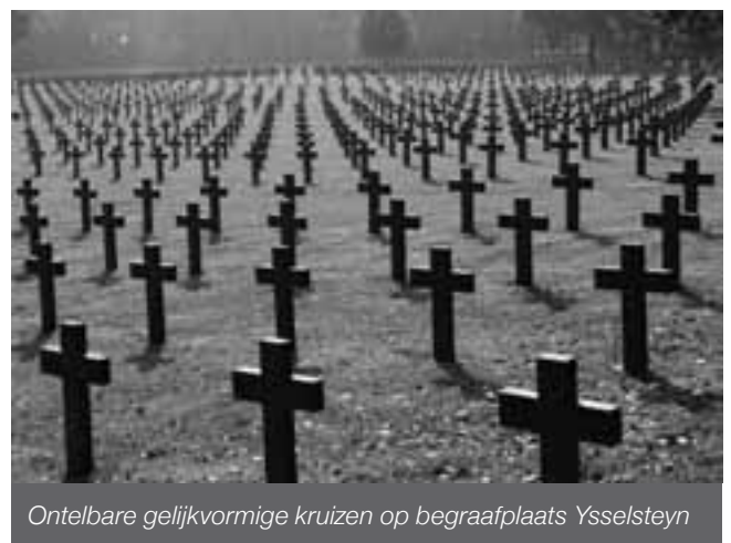
Ontelbare gelijkvormige kruizen op begraafplaats Ysselsteyn