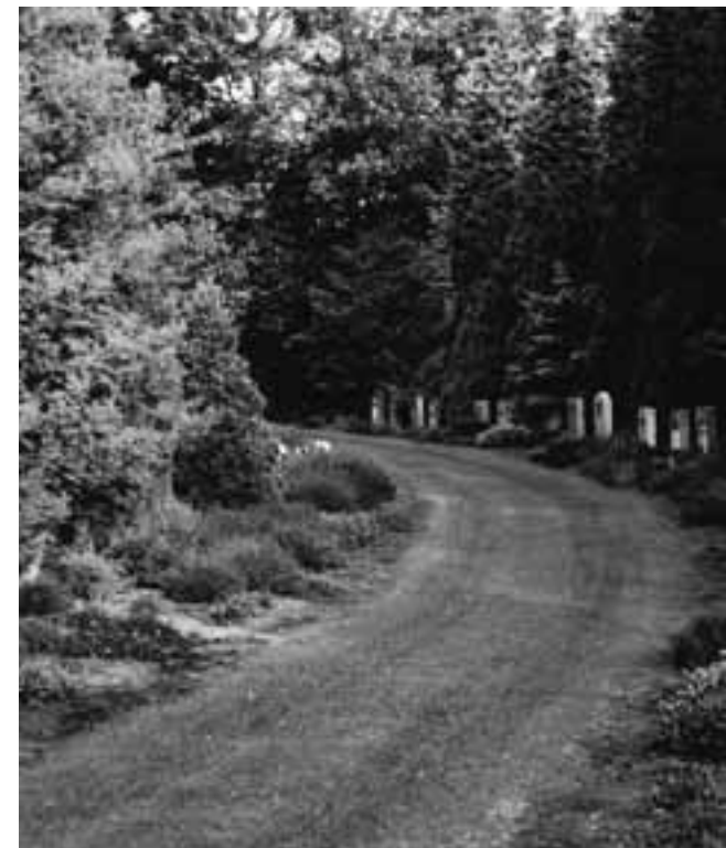
Een gebogen graspad op Kranenburg, Zwolle

voor vlinders en insecten en als pluktuin voor bezoekers. Maar ook worden binnenstedelijke ruimten weer geschikt geacht voor begraaffuncties: oude kerken kunnen worden ingericht met bovengrondse grafkelders of urnenmuren. Oude kerkhofjes worden opgeknapt en hergebruikt. De dood is weer terug in de stad. Sluitingstijden versoepelen of de hekken worden zodanig aangepast dat bezoekers niet opgesloten raken. Want zolang we kunnen, willen we er ook wel weer weg!