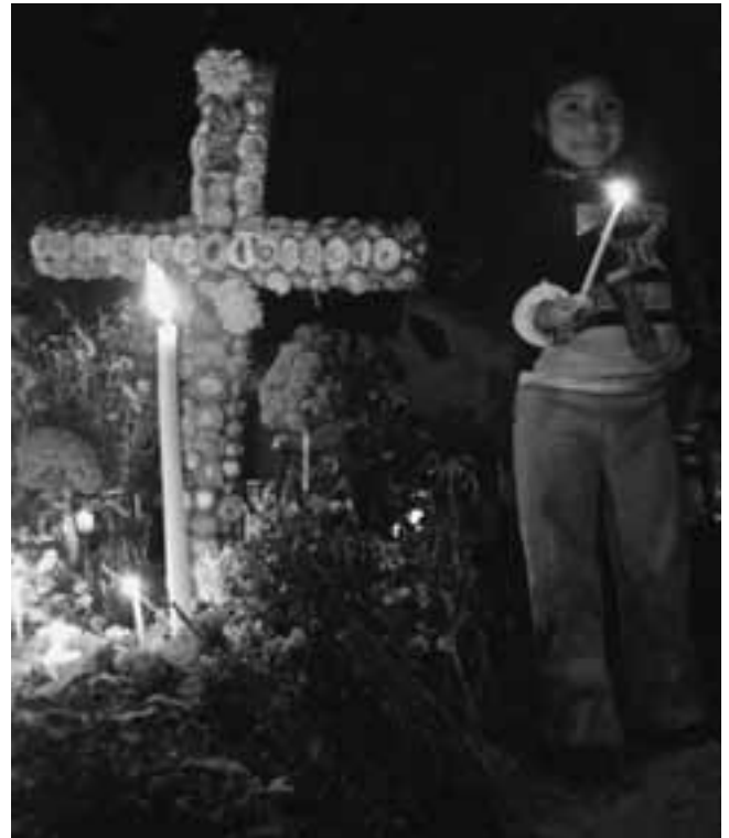
Een meisje bij een met bloemen versierd graf

Daarnaast zijn er kookcursussen om te leren de traditionele gerechten van de Dag van de Doden te bereiden, zoals 'pan de muertos', ofwel 'brood voor de doden' en kleine doodskopjes van suiker. Vaak wordt dit gecombineerd met een bezoekje aan de 'Markt van de Doden', de lokale markt, waar de bezoekers onder begeleiding hun eigen ingrediënten kopen. Ook het traditioneel huiselijke ritueel van het bouwen van een altaar voor de overledenen behoort tot de mogelijkheden. De meeste hotels nodigen hun gasten uit om te participeren in de