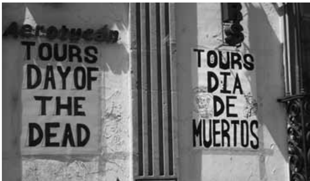
Toeristen kunnen meedoen aan een rondleiding

indrukwekkende interculturele kennismaking met een bijzonder dodenritueel. Voor een kleine groep behelst het bezoek een ingrijpende en spirituele ervaring waarin ze een mogelijkheid vinden om hun eigen geliefde te herdenken. Sommigen maken zelfs plannen om na de vakantie de Mexicaanse tradities waar ze mee in aanraking zijn gekomen voort te zetten.