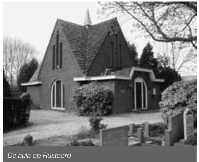
De aula op Rustoord