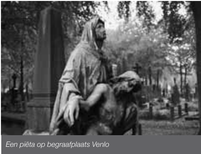
Een piëta op begraafplaats Venlo