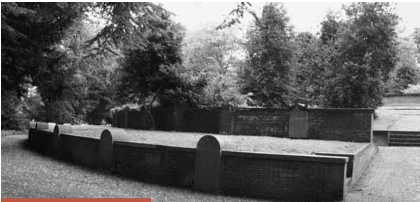
Een unieke 'rotonde' op Soestbergen in Utrecht

Rond 1900 was de Romantiek over haar hoogtepunt heen. In de vormgeving van begraafplaatsen zien we dan ook naast landschappelijke/romantische structuren steeds meer de toepassing van monumentale vormen: lanen, stervormen en assenstelsels voegen een strakke noot toe aan het voorheen slingerende vormenspel van de Romantiek. Deze combinatie van vormen wordt ook wel Gemengde