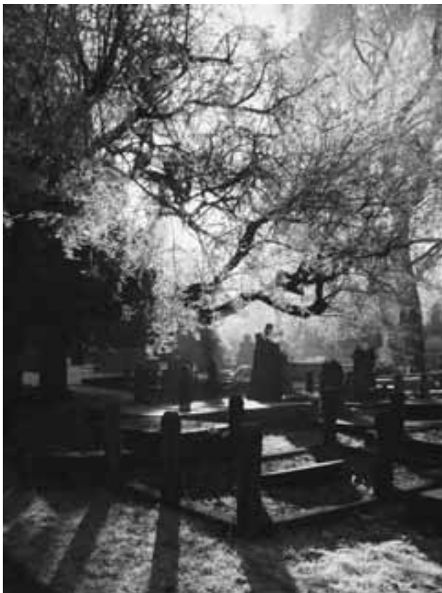
Eerste prijs: Mieke Noorloos-Lagewaard (Gemeentelijke begraafplaats Gorinchem)