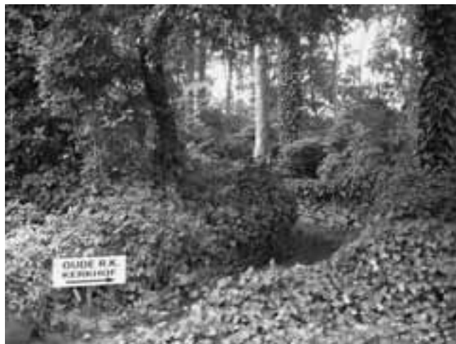
Tweede prijs: Tjeerd de Jong (Steggerda)