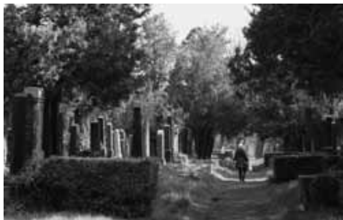
Op de oude joodse afdeling

www.viennatouristguide.at/Friedhoefe/Zentralfriedhof met veel details.