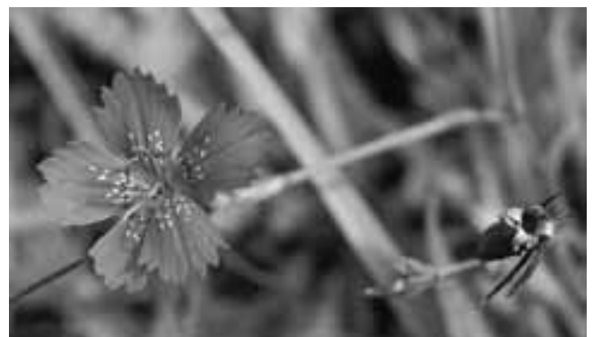
De steenanjer is een zeldzame, beschermde plant die bloeit op Bergklooster en Kranenburg. De oude benaming luidt Zwolse anjer

Evenals de Algemene Begraafplaats ligt het naburige Rooms Katholiek Kerkhof ingeklemd tussen de nieuwe stadsuitbreidingen. De opening van het kerkhof in 1841 verhoogde het zelfbewustzijn van de eeuwenlang achtergestelde katholieke gemeenschap. De restauratie van de bakstenen ommuring en de dichtgetimmerde Michaëlkerk geven het kerkhof een rommelig aanzien, maar eenmaal binnen de toegangspoort trekken direct het blinkende gietijzeren kruisbeeld en de gerestaureerde kapel de aandacht. Direct links van de poort staat het baarhuisje met daarachter, tegen de ommuring, een klein 'museum' met oude grafstenen en kruizen. Het contrast met de naastgelegen Algemene is groot: hier staan nauwelijks bomen of opvallende losstaande grafmonumenten. De begraafplaats laat zich lezen als een sociale atlas: rond de kapel werden de religieuzen en de burgerlijke elite van de stad begraven. Hoe lager de sociale status, des te verder werd men van de kapel begraven met als 'dieptepunt' de ongewijde aarde bij de muur naast de toegangspoort. Hier werden zelfmoordenaars en ongedoopte kinderen begraven. Het nieuwe deel buiten de oude muur is een ontwerp van landschapsarchitect Ada Wille.