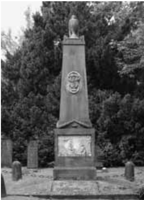
Gedenkzuil met gesluierde urn op de grafkelder van schrijver Rhijnvis Feith op de gemeentelijke begraafplaats aan de Meppelerstraatweg. Hij werd hier in 1825 herbegraven

Deze wandeling verbindt de Grote Kerk, het oudste kerkhof van Zwolle, met Kranenburg, de nieuwste begraafplaats aan de rand van de stad. Toen begraven in de stad verboden werd, moesten de Zwollenaren hun doden naar het 'Nieuwe Kerkhof' aan de Meppelerstraatweg brengen.