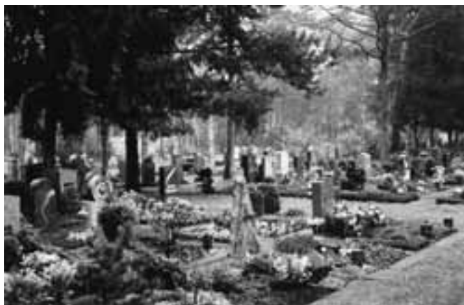
In Duitsland zijn de graven bloembedden

Er zijn ook grensgevallen. Zwitserland heeft veel buurlanden. Op de begraafplaatsen tref je Duitse bloembedden, Italiaanse lantaarntjes en Oostenrijkse afdakjes van hout aan.