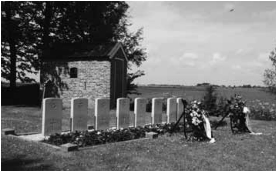
Een begraafplaats met uitzicht op het Friese landschap

In het weidse Friese land vallen de vele kerktorens goed op. Gelegen op terpen met eromheen kleine kerkhoven in het groen vormen ze een karakteristiek beeld in de gemeente Littenseradiel. Die kerkhoven zijn op zich ook weer kleine landschappen met een heel eigen verhaal. Geschiedenis, symboliek en cultuur worden zichtbaar in de kleine kerkjes en op de kerkhoven van deze gemeente, met maar liefst 29 dorpen en dorpjes.