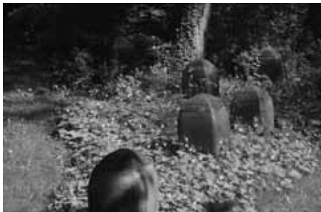
Urnenveld bij crematorium