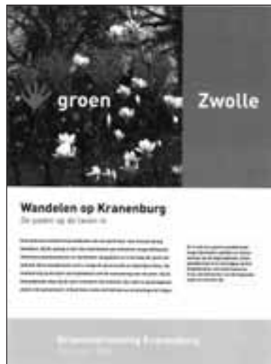
Cover wandelboekje Kranenburg

Via een binnenpad bereiken we Bergklooster, de oudste begraafplaats van Zwolle die nog steeds in gebruik is. Je voelt hier direct een andere sfeer; je betreedt een plek met een lange geschiedenis. De begraafplaats oogt door het ontbreken van grote grafmonumenten en gepolijste stèles sober. Het wekt de indruk van een kerkhof rond een Engels plattelandskerkje. Bij de bouw van het klooster op de Nemelerberg, een rivierduin langs de Vecht, werd ook een kerkhof ingericht. Na de Reformatie werd het 'bergklooster' in 1572 gesloten en negen jaar later afgebroken. Het oude kloosterkerkhof bleef echter in gebruik. De oudste zerk bedekt het graf van Jan Mullert, heer van Kranenburg, en dateert van 1540. De steen ligt op zijn oorspronkelijke plaats in de – nu verdwenen – kloosterkerk. Bij graafwerkzaamheden worden nog regelmatig archeologische vondsten gedaan. Een deel hiervan ligt opgeslagen in de schuur die als klein funerair museum fungeert. Bergklooster is geen natuurbegraafplaats maar wordt wel op een natuurlijke, ecologische wijze beheerd. Op twee oudere grafvelden