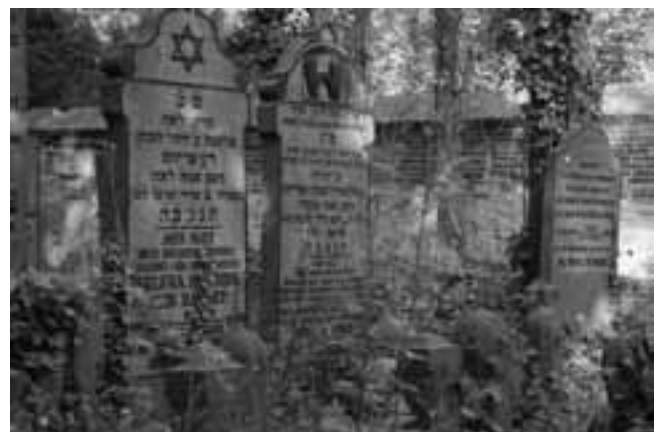
Joodse begraafplaats bij Overveen

Een kilometer westwaarts ligt de Bloemendaalse Eerebegraafplaats die, vanaf het toegangshek aan de Zeeweg, door een hoog duin aan het zicht wordt onttrokken. Een breed onverhard pad leidt naar de poort met de toogtekst 'Geheiligd is de grond dien gij betreedt'. Die heilige grond is een ommuurde begraafplaats in een weids duinlandschap. Wat direct opvalt, is de eenvoud: niets meer dan een rechthoekige vorm, een vlag en een klokkentoren. Op deze desolate plek in de Kennemerduinen werd op 27 november 1945 in aanwezigheid van de koninklijke familie