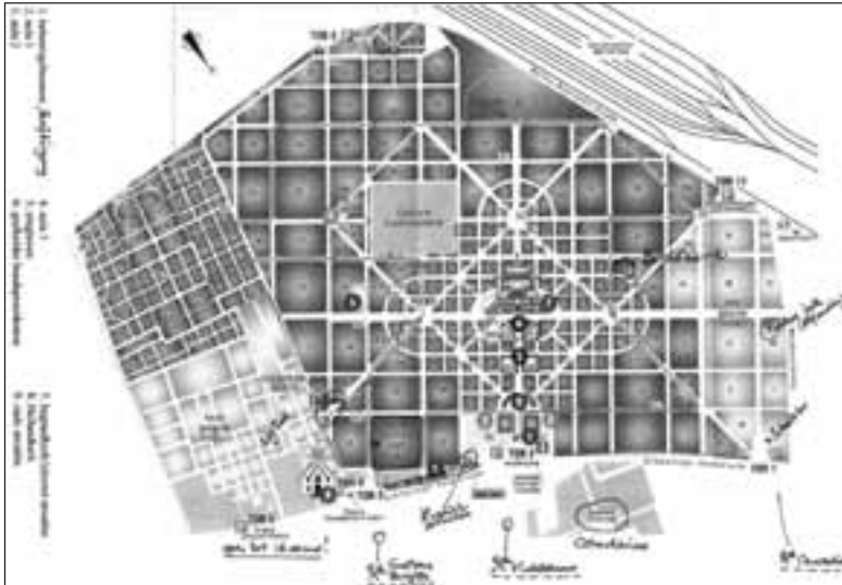
Plattegrond van het Zentralfriedhof