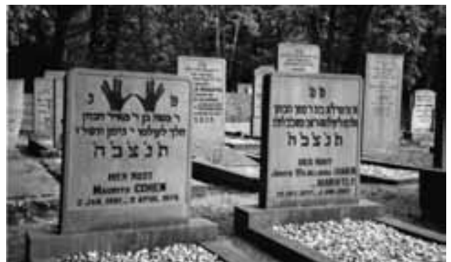
Op de begraafplaats aan de Noord Esmarkerrondweg toont de linkerstèle de handen van de hogepriester, de letter sjen vormend: de eerste letter van een van de namen voor God. De hebreeuwse tekst (vijf letters) betekent: moge zijn/haar ziel verbonden zijn in de bundel des levens

Zuijlen, Frank van. (red.): Joods leven in Enschede vanaf 1767 . Stichting Synagoge Enschede (Enschede: 2003, ISBN 10: 907 01 6280 6 - ISBN13: 978 90 7016 2801, 120 blz., € 29,50). Veel foto's en illustraties, zowel in kleur als zwart/wit.