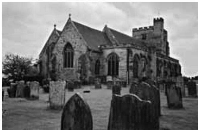
In Groot-Brittannië zijn begraafplaatsen dodenweitjes