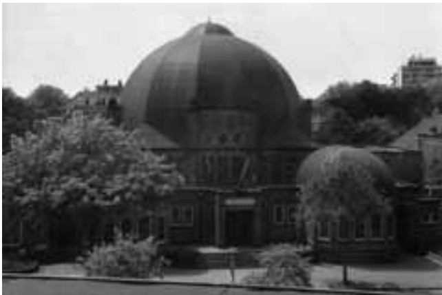
Hier goed zicht op de entree en koperen koepels van de synagoge