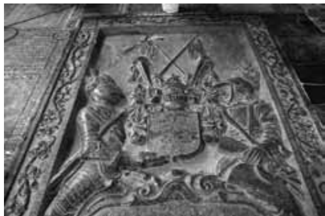
Een zerk met een wapen