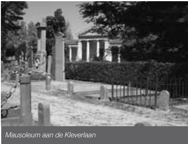
Mausoleum aan de Kleverlaan

De route van deze wandeling van ongeveer vijftien kilometer brengt u langs vier historische begraafplaatsen, stuk voor stuk fraai en met een eigen karakter. Eén ervan ligt in Haarlem, de overige in het duingebied westelijk van de provinciehoofdstad.