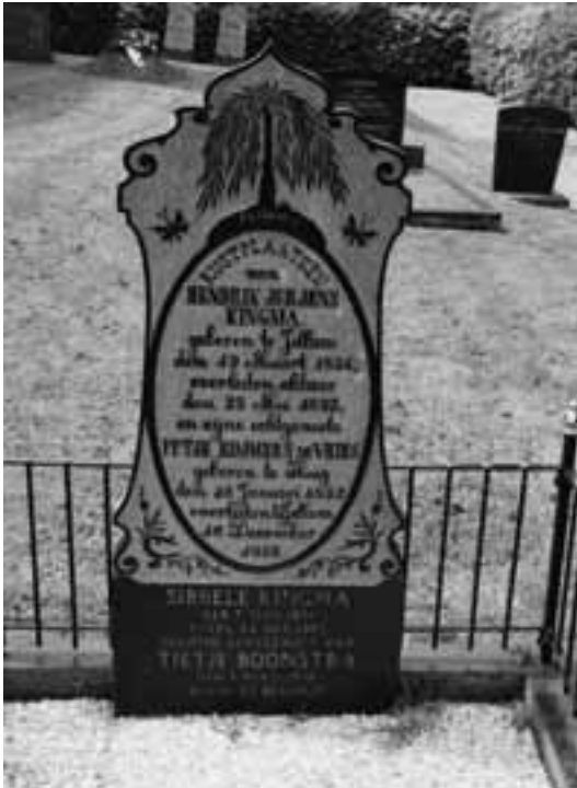
Op het kerkhof van Jellum staat deze stèle, vol met symboliek waaronder de niet te missen treurboom

de terp afgegraven is Het kerkhof ligt zeker twee tot drie meter hoger. Op het kerkhof veel hardstenen zerken en stèles (zoals staande grafstenen worden genoemd). In de westhoek van het kerkhof staat een lijkenhuisje. Op zes van de kerkhoven uit deze wandeling staat nog zo'n huisje.