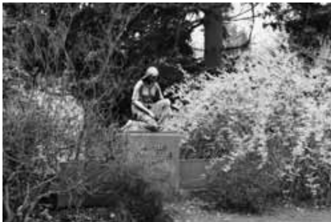
Op begraafplaatsen in Noord-Europa ligt de nadruk op de natuur

Oudere begraafplaatsen zijn dikwijls aangelegd als park en hebben een bijzondere, geheel eigen flora en fauna. En vaak zijn de laatste rustplaatsen ook oases van rust en bezinning te midden van de hectiek van de omringende stad. Elke tijd, elke plaats, elk volk en elke cultuur heeft