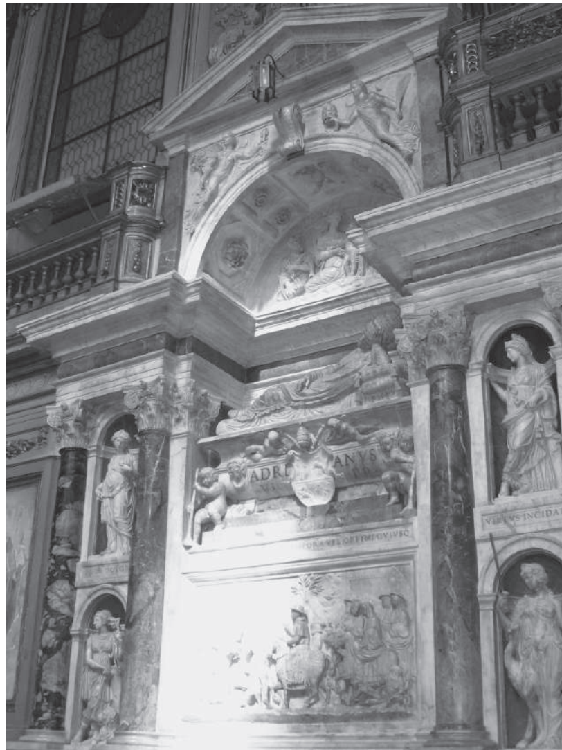
Graf paus Adrianus VI te Rome.