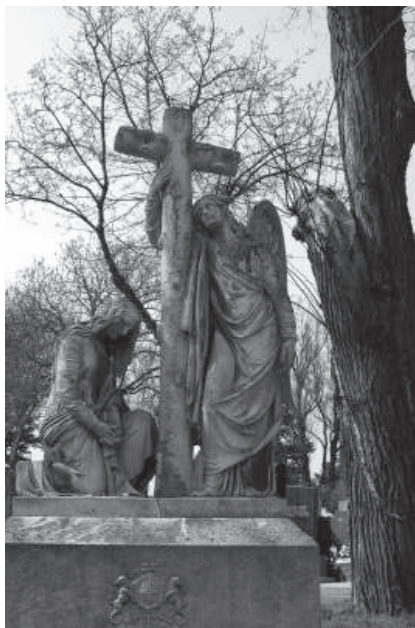
Grafmonument op het Zentralfriedhof, Wenen