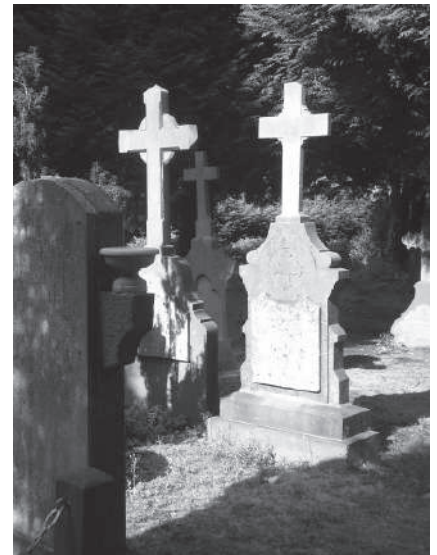
Zerk op de rooms-katholieke begraafplaats te Abcoude

Vervolgens naar de huidige katholieke kerk, in 1885 gebouwd door Alfred Tepe, een neogotisch bakstenen gebouw. Achter de kerk ligt de begraafplaats die sinds 1904 in gebruik is. Vlak bij de ingang ligt achter hagen verscholen een plekje voor ongedoopte kinderen met een eigen monumentje.