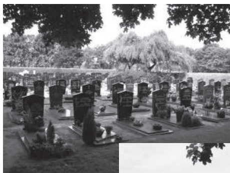
R.K. Begraafplaats Helenaveen: grafveld na 1970

Het behoud van dit grafveld als ensemble is van cultuurhistorisch belang als weerspiegeling van een bepaald tijdsbeeld. Dit grafveld geeft door middel van materiaal (hardsteen en kunststeen), vormgeving (vooral het kruisymbool), christelijke symboliek (lijden, dood, verrijzenisgeloof) en belettering een goed beeld van een katholieke dorpsbegraafplaats uit globaal de jaren 1900-1970. Daarna trad er in Nederland een periode in waarin werd gekozen voor uniformiteit op begraafplaatsen. Een goed voorbeeld daarvan zien we op het rechter grafveld. Beide grafvelden vormen zo een mooi contrast van een stuk begraafcultuur. Het Deurnese college van Burgemeester en Wethouders heeft nu wel besloten dat het ruimen gefaseerd moet gebeuren. In eerste instantie mogen vier totaal geruïneerde grafstenen worden verwijderd, hetgeen inmiddels is gebeurd. De gemeente stelt vervolgens ook voorwaarden, waaraan de nieuwe graven op de plaats van de oude moeten voldoen. Inmiddels is er een vereniging tot behoud en onderhoud van de (overige) historische monumenten opgericht, die ongetwijfeld ook gaat waken over de funeraire cultuur in de gemeente Deurne.