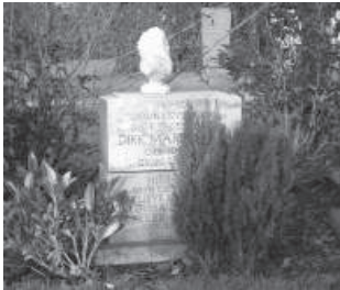
De zogenaamde 'broodjes' op de algemene graven te Papendrecht