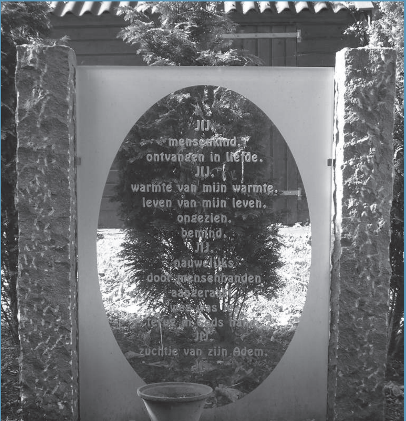
Grafmonumentje voor ongedoopte kinderen op de Rooms-Katholieke Begraafplaats, Abcoude

Inschrijving: Eskoo Reizen, telefoon 0416 - 281514, E-mail: info@eskooreizen.nl